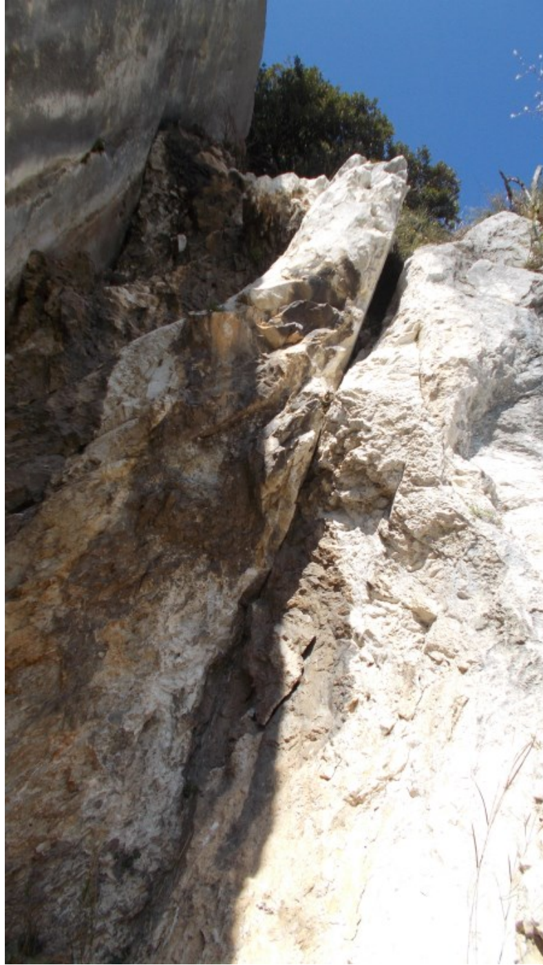
Uscita dal sesto tiro