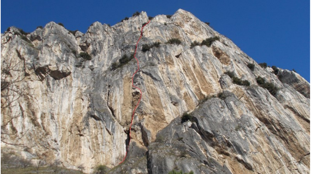
Tracciato della via