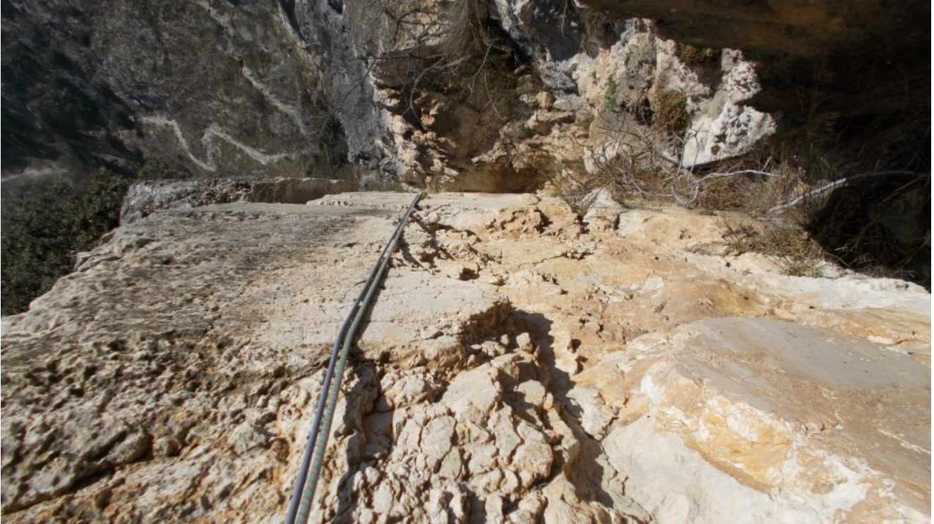
La placca del sesto tiro