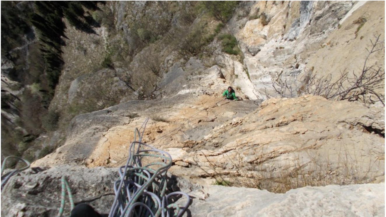
Uscita dal primo tiro