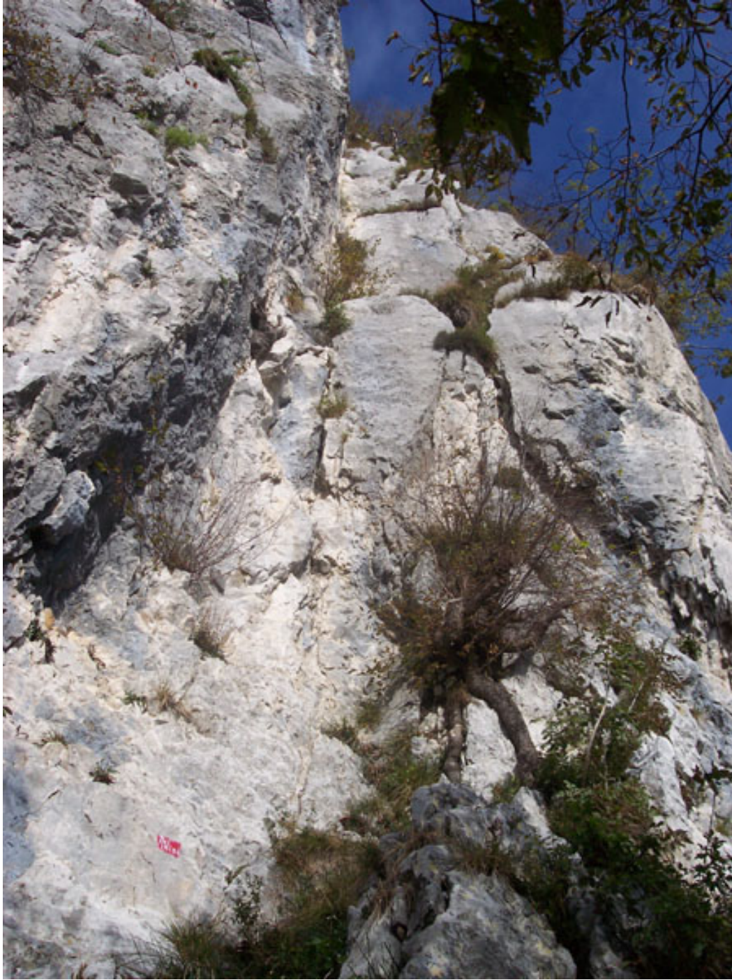
Alla base della prima lunghezza