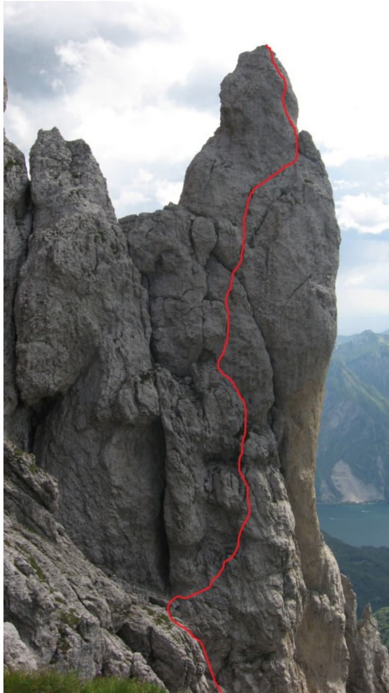
Tracciato della via