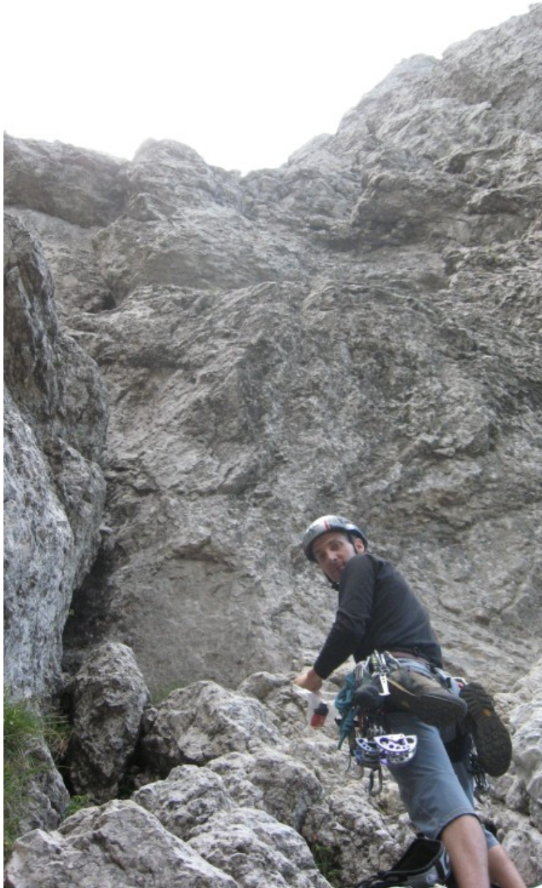
Attacco prima lunghezza