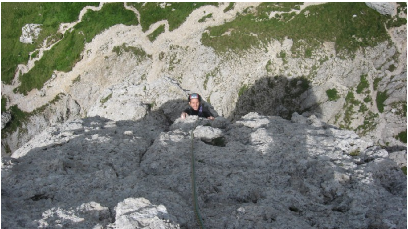
Uscita dal quarto tiro