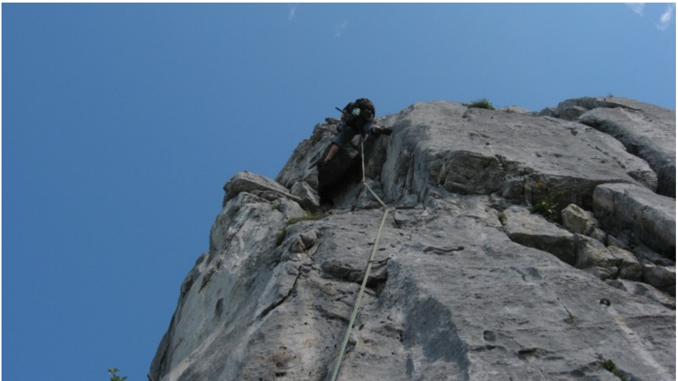
Sulla quarta lunghezza