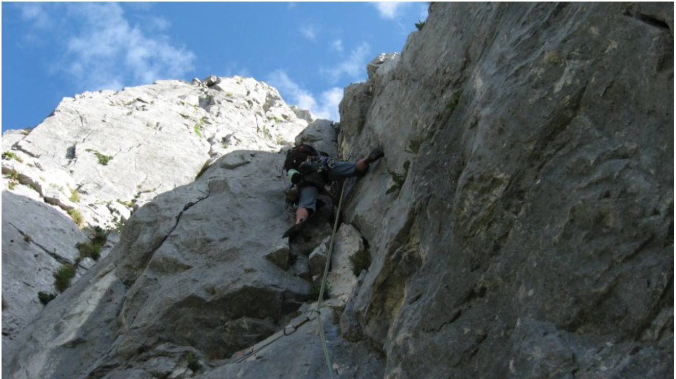
Sulla seconda lunghezza