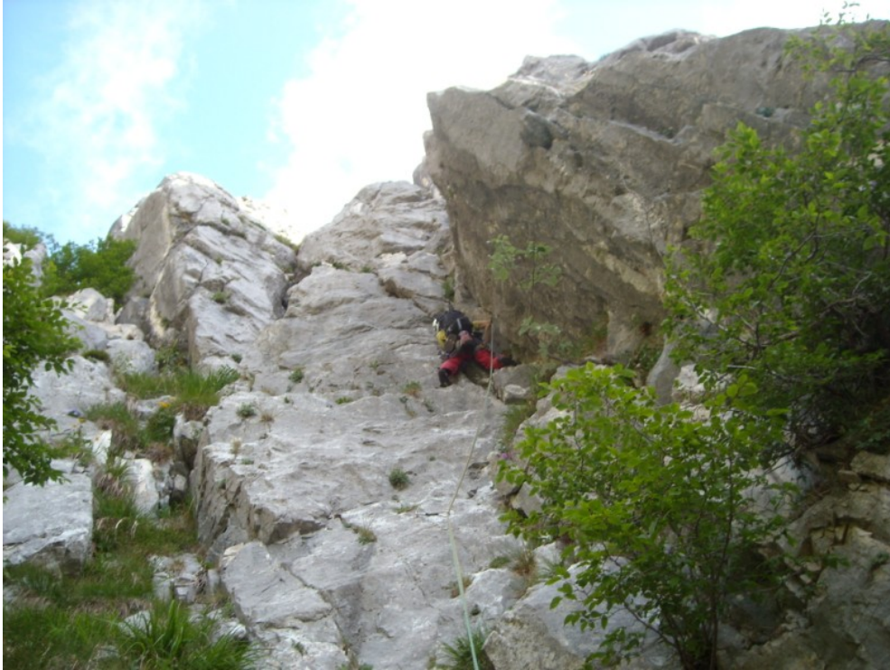
Sulla prima lunghezza