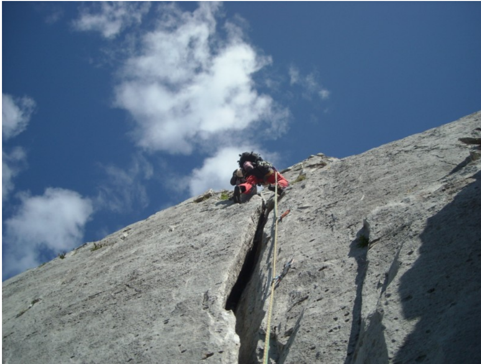
Sulla terza lunghezza