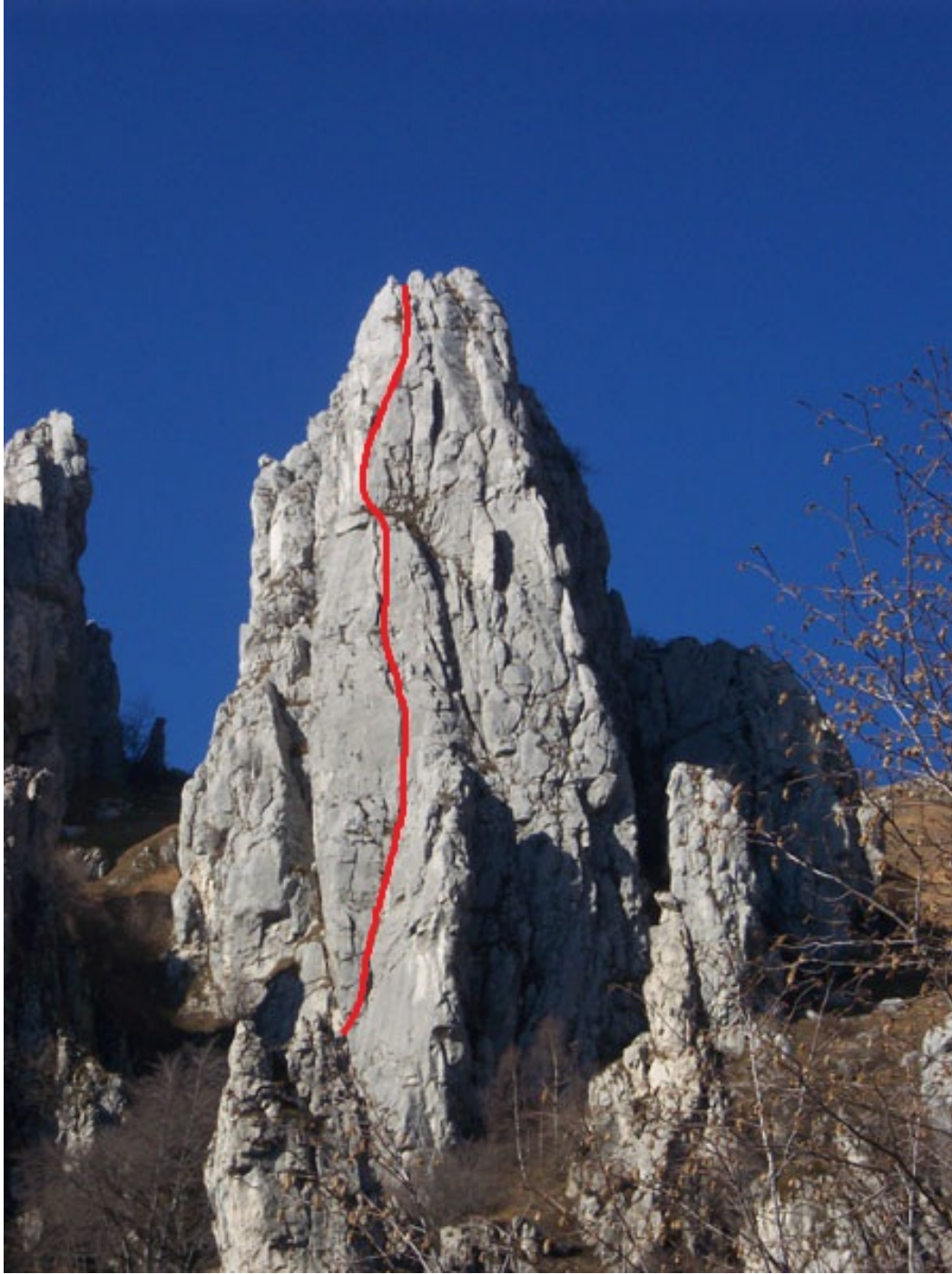
Tracciato della via