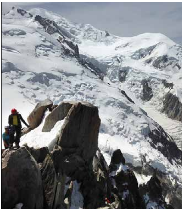
Sulla cresta dei Cosmiques e sullo sfondo il Monte Bianco