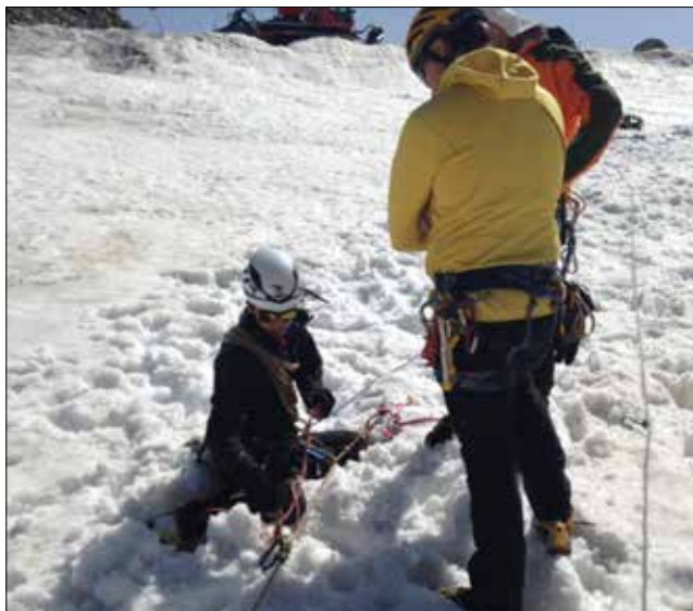
Manovre sul ghiacciaio d'Argentiere