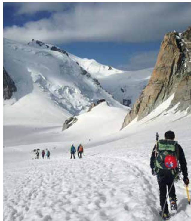
Sul ghiacciaio e di fronte il Mont Blanc du Tacul e il Mont Maudit