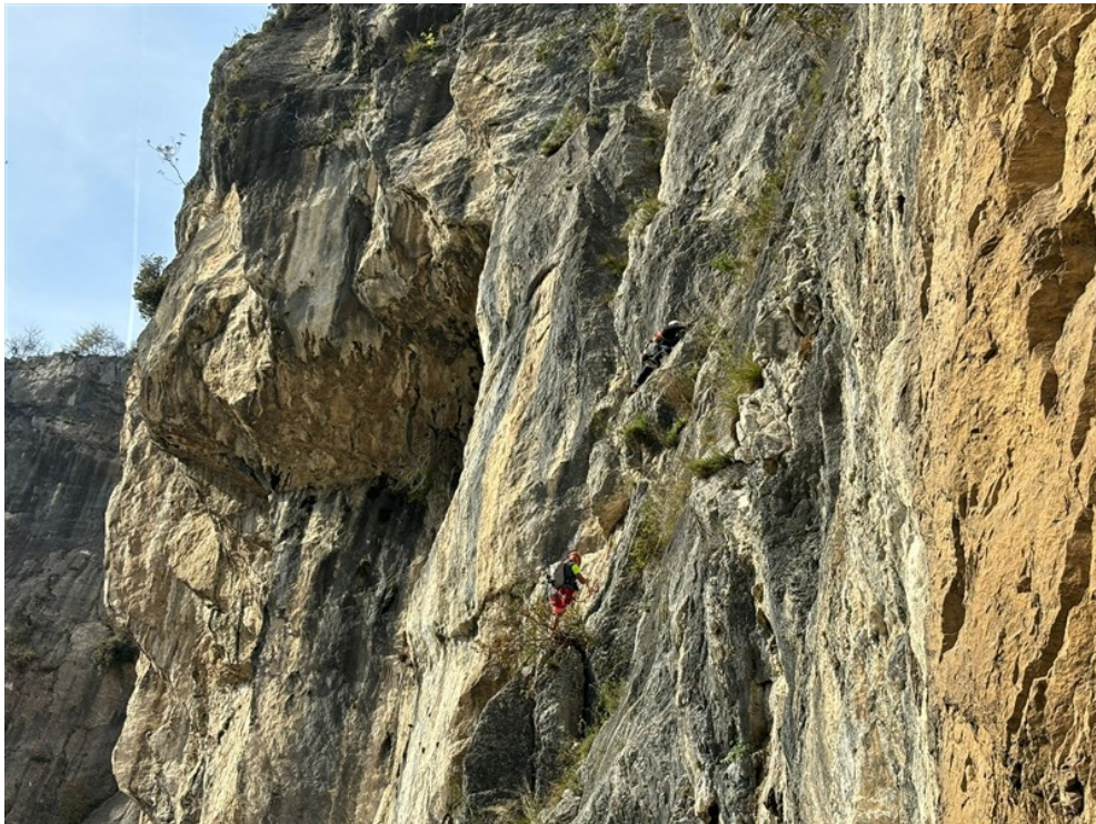
L2, con sosta sulla via del Bepi e continuazione su fine L2+L3