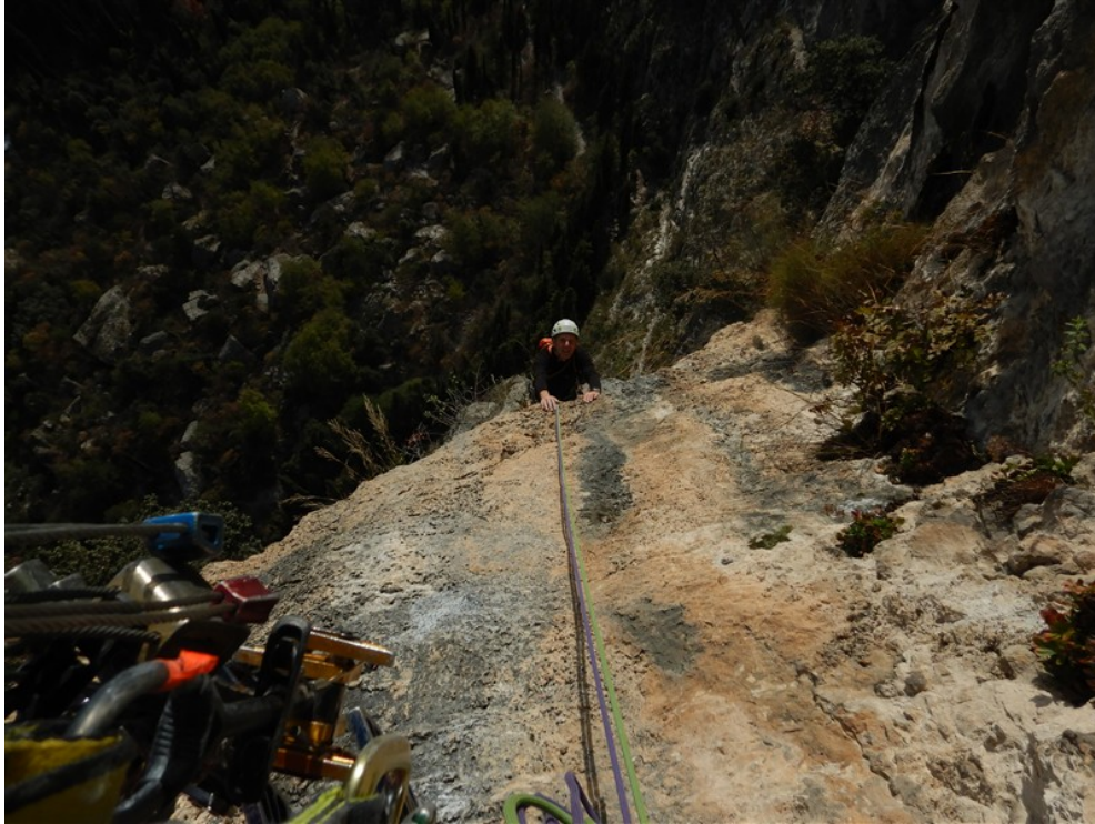
Placca finale della quarta lunghezza