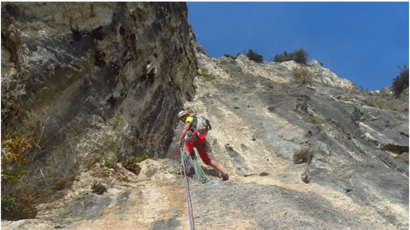
Sosta 4 e diedro della quinta lunghezza