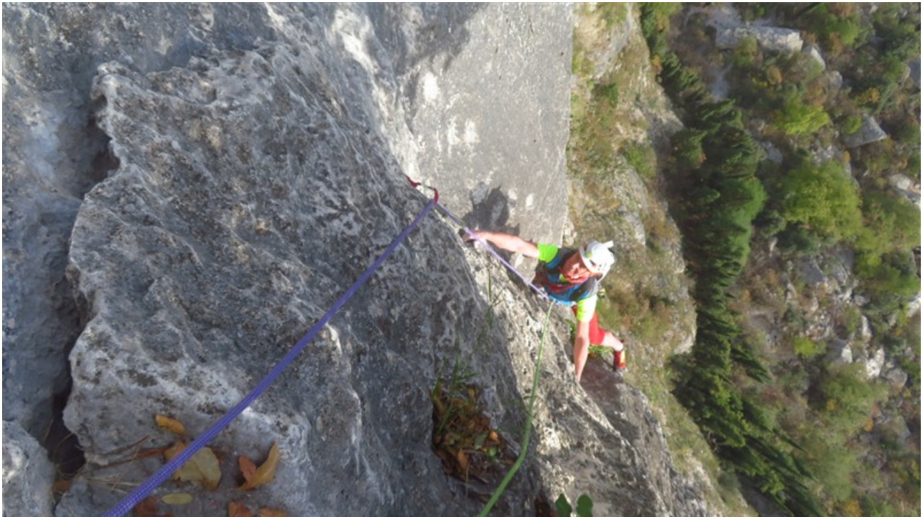
Lama della terza lunghezza