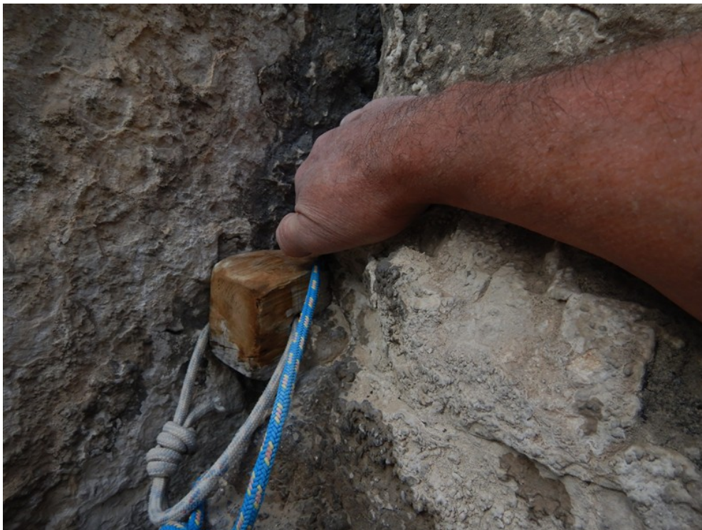
Cuneo della quinta lunghezza