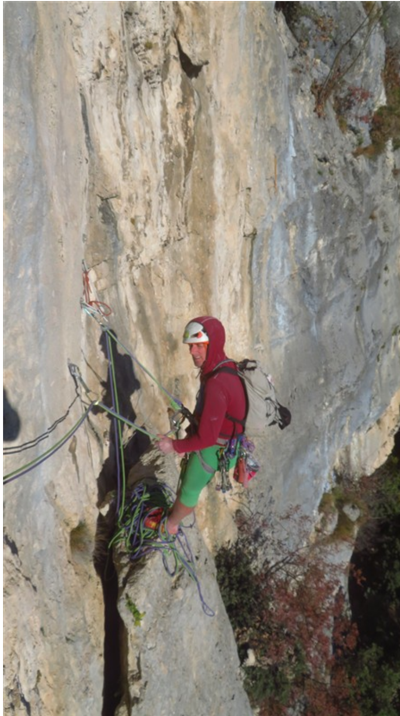
Sosta prima lunghezza