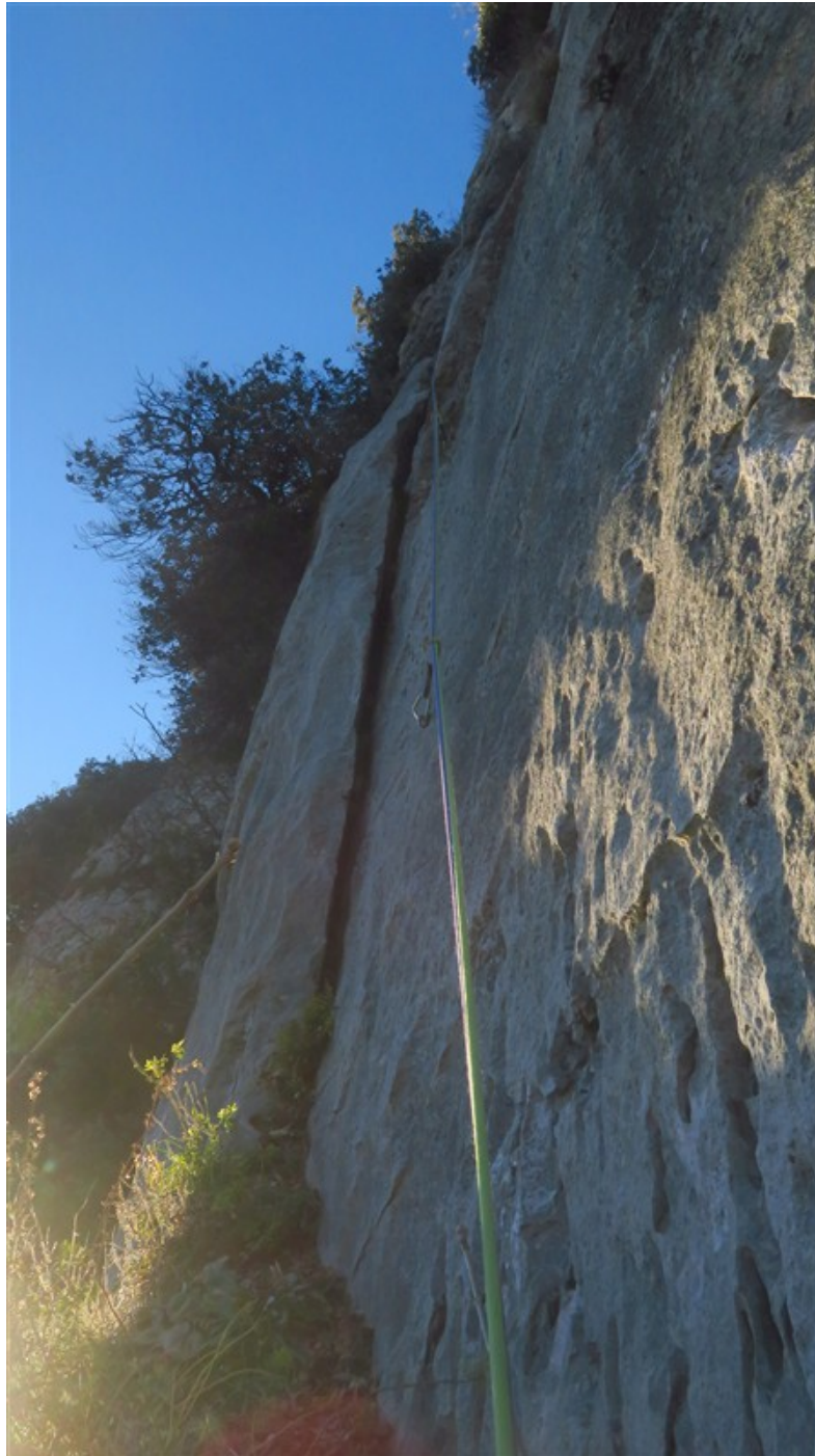
La bella lama della sesta lunghezza