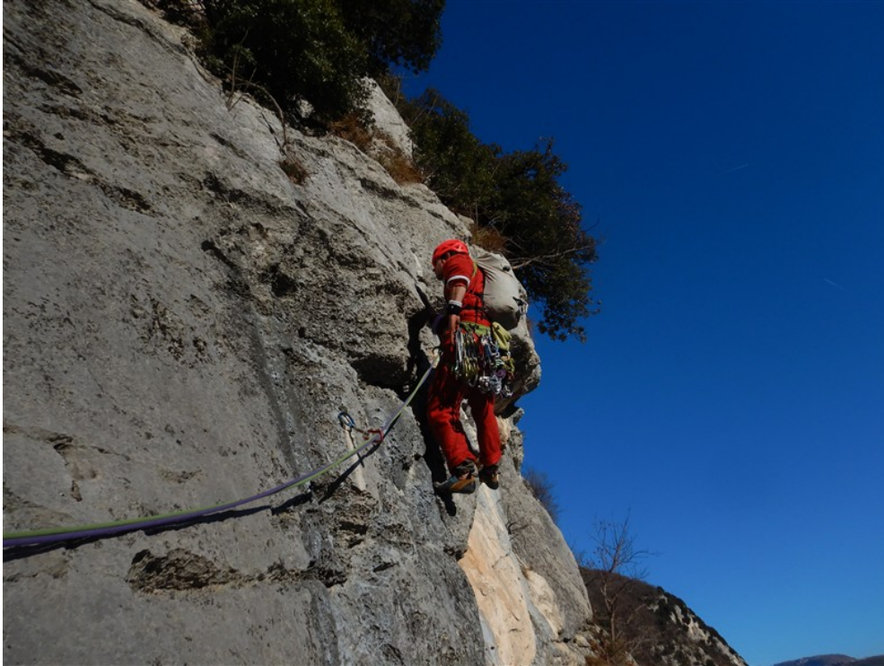
Parte iniziale settima lunghezza