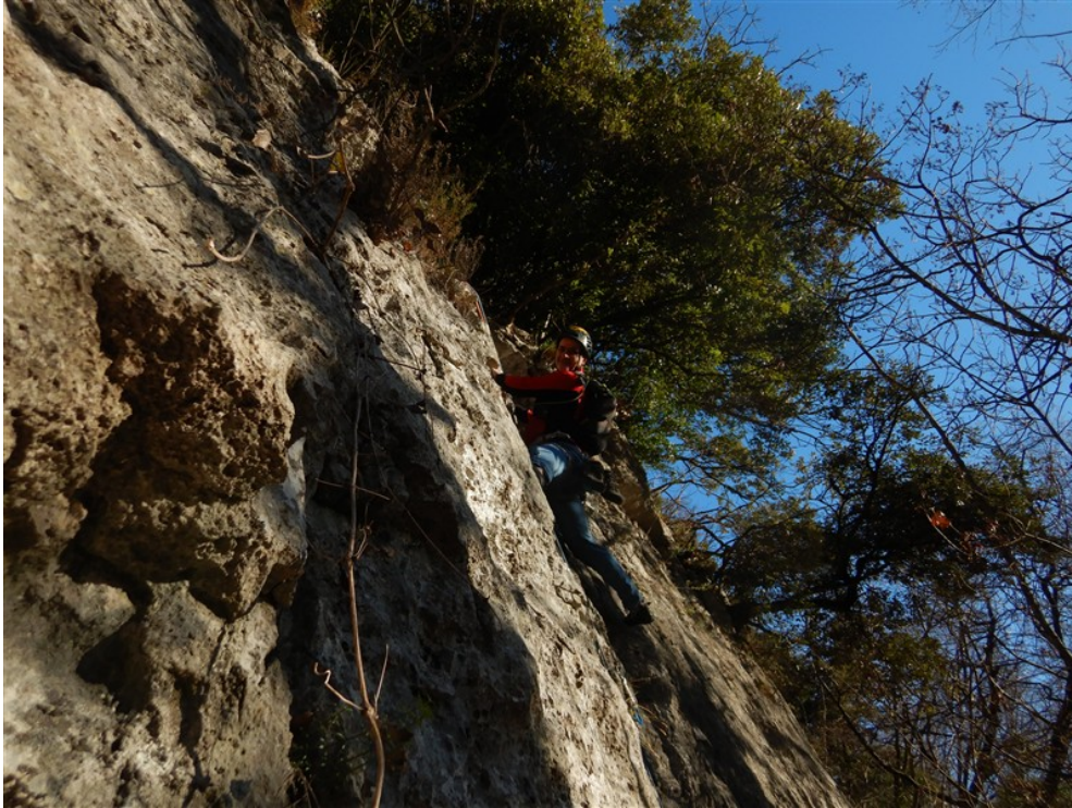
Partenza prima lunghezza