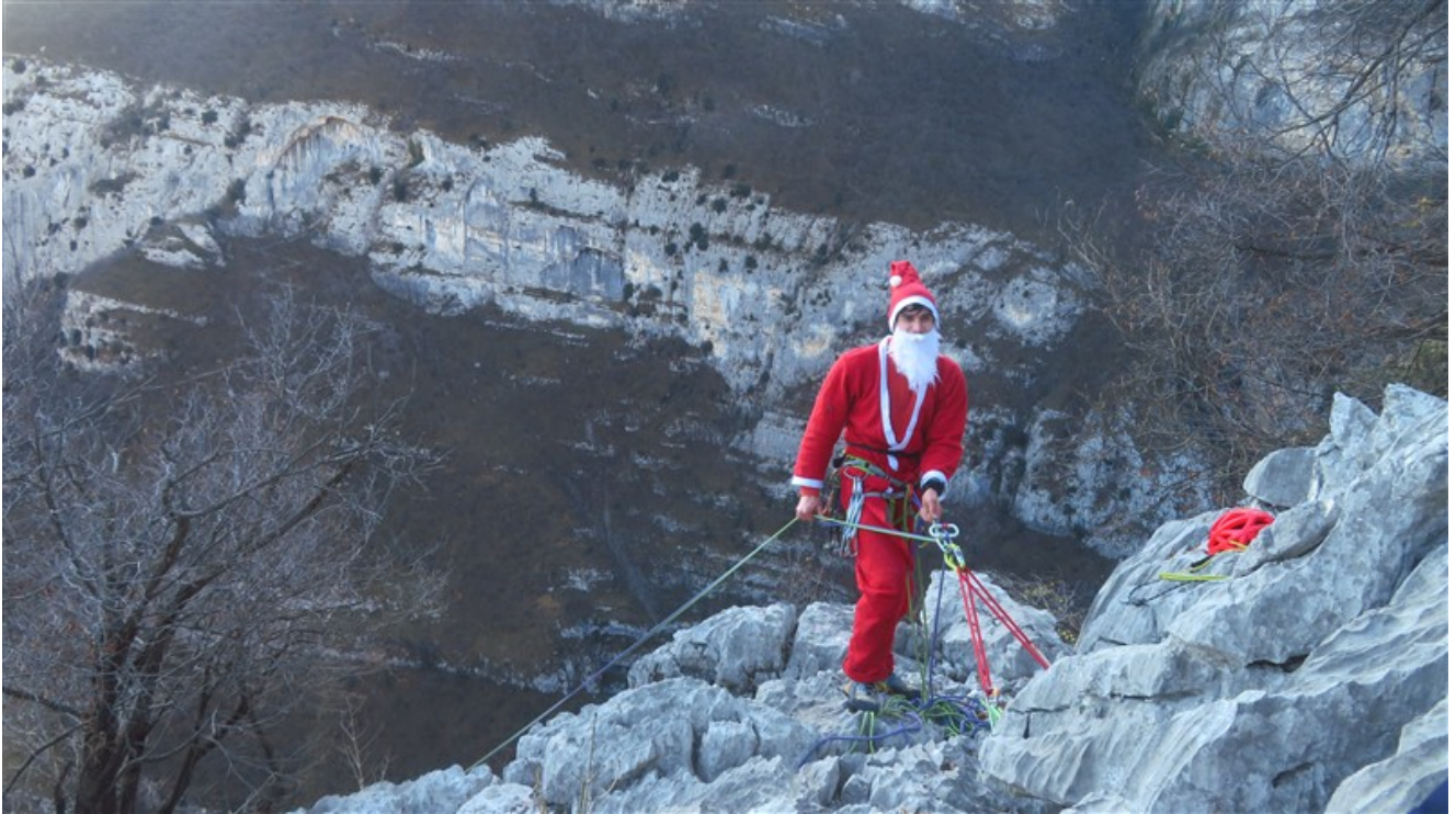
Babbo Natale in sosta al termine della via