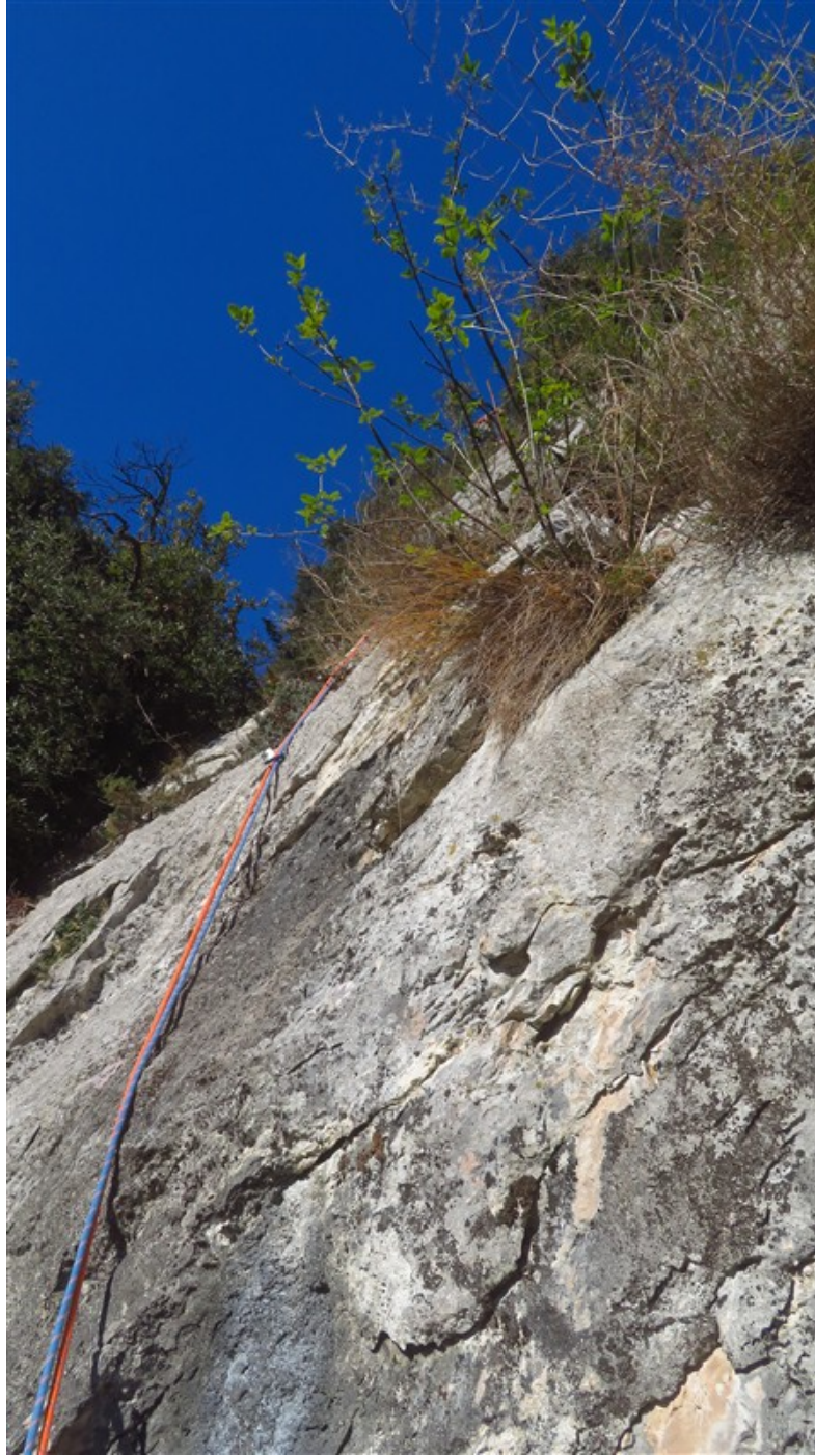
Parte iniziale terza lunghezza