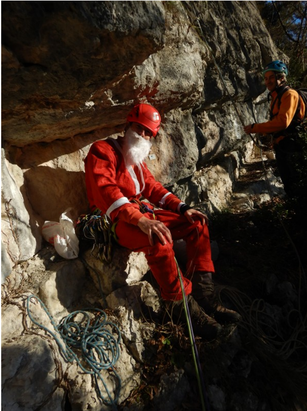
Attacco...con Babbo Natale