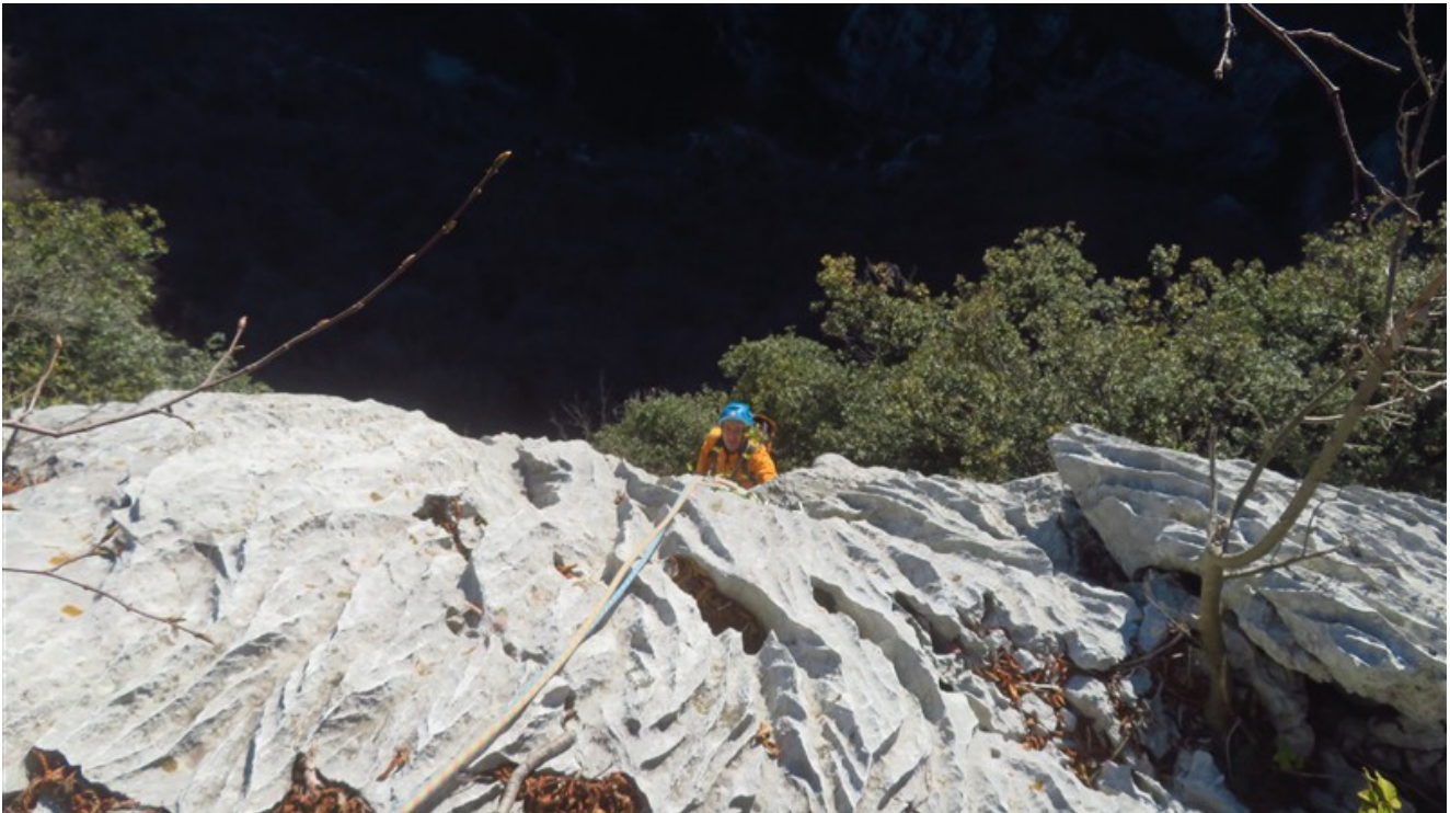
Ultimi metri prima della fine della via