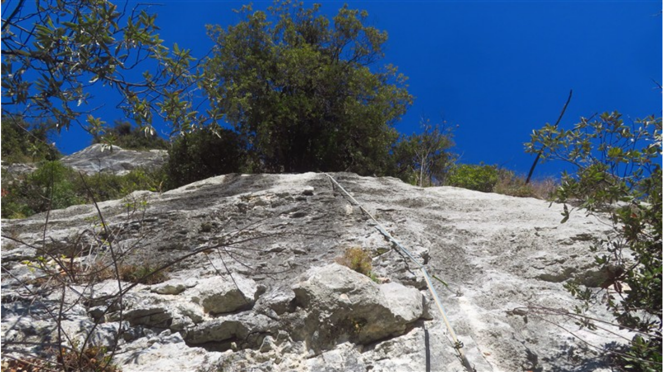
Il muro della quarta lunghezza