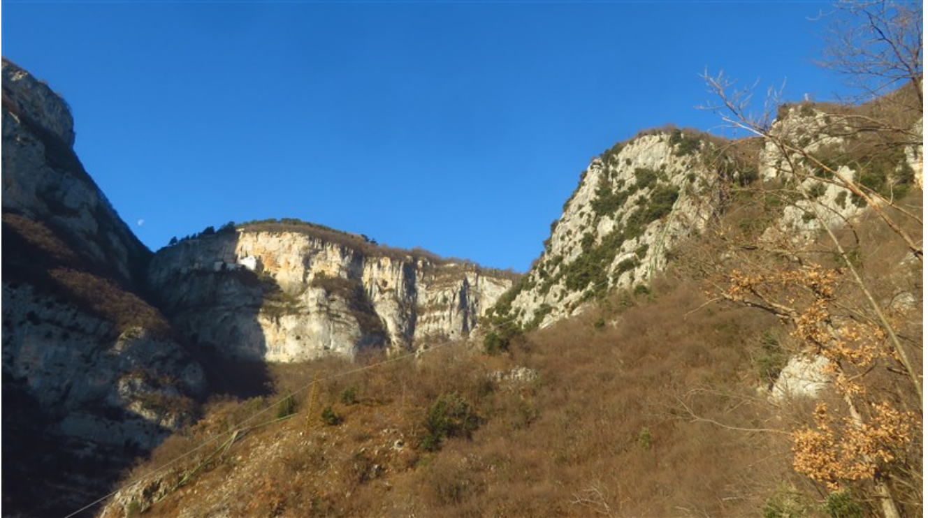
La conca dove si trova la parete, visibile a dx