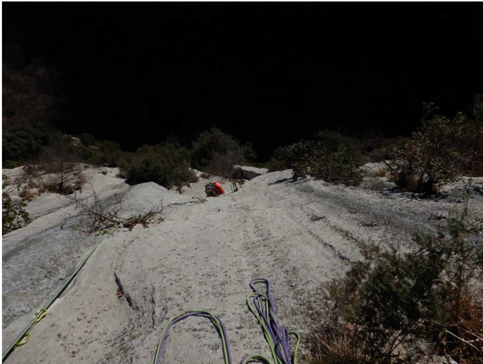
La placca finale della sesta lunghezza