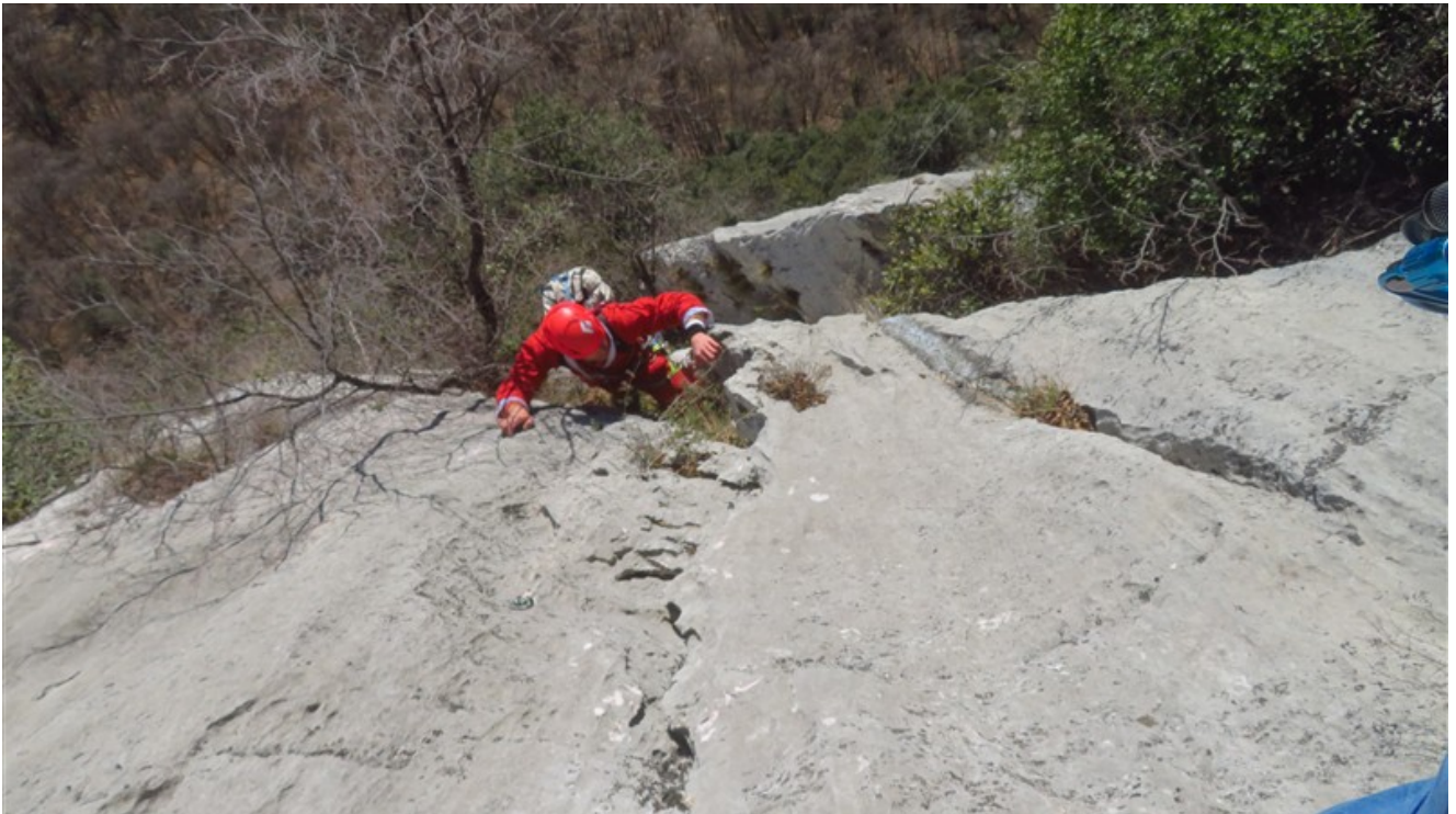
Uscita quinta lunghezza