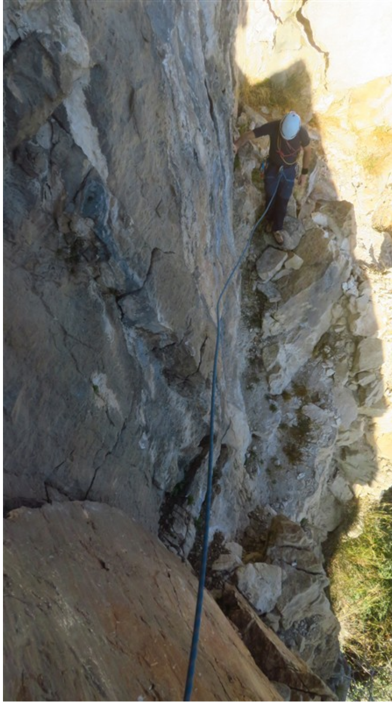
La piccola cengia dell'ottava lunghezza