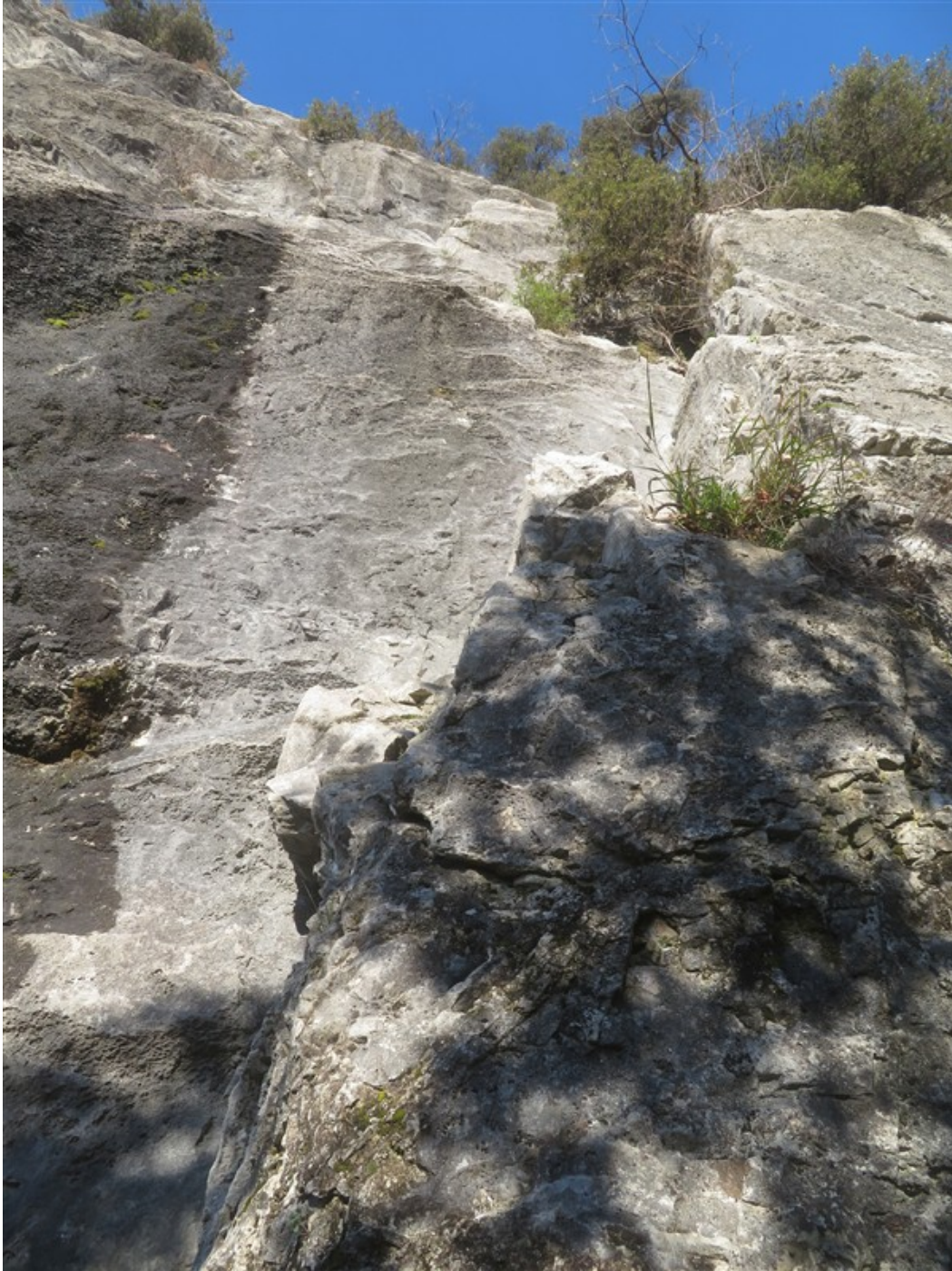
Partenza prima lunghezza