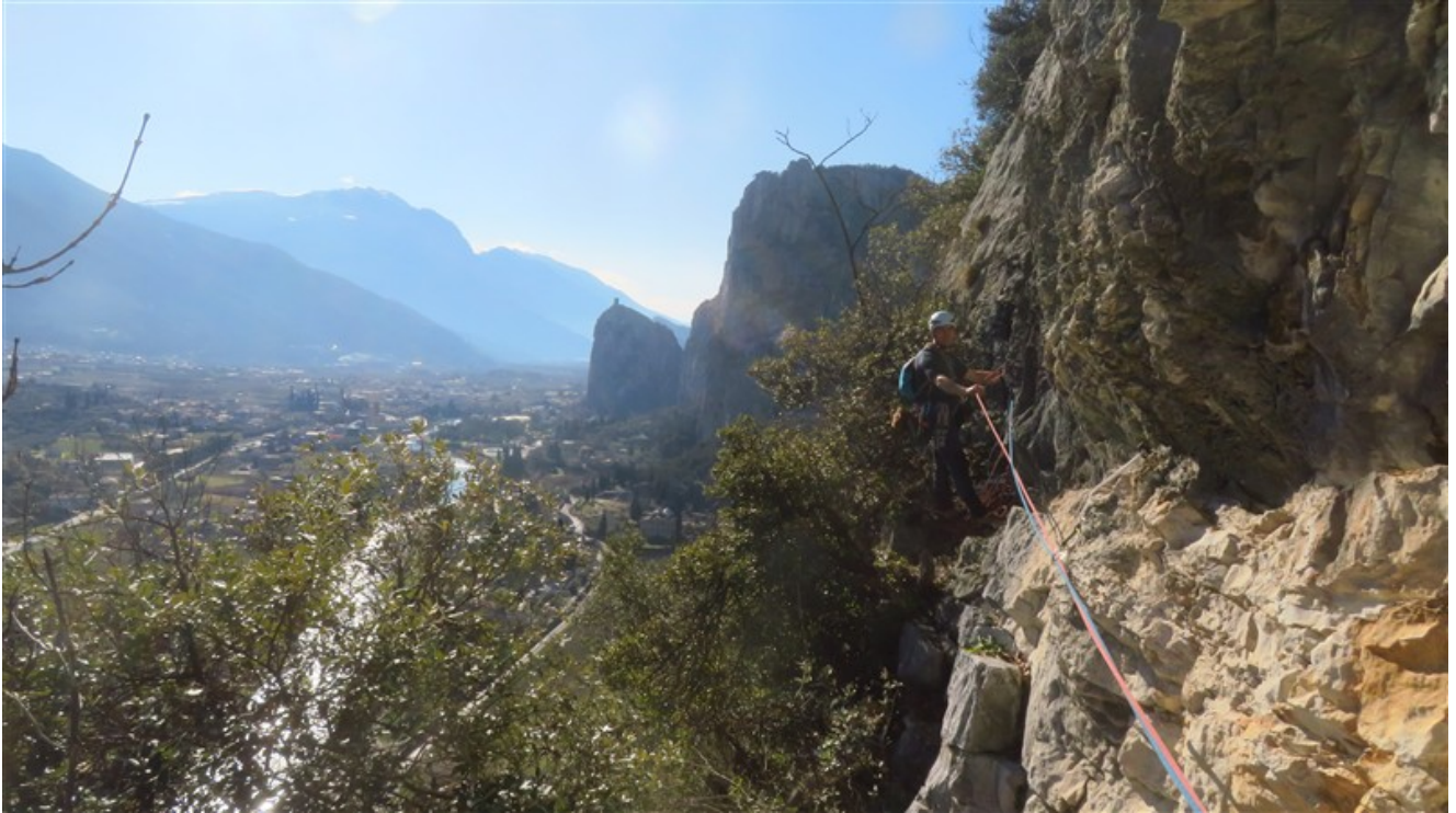
Sosta quarta lunghezza