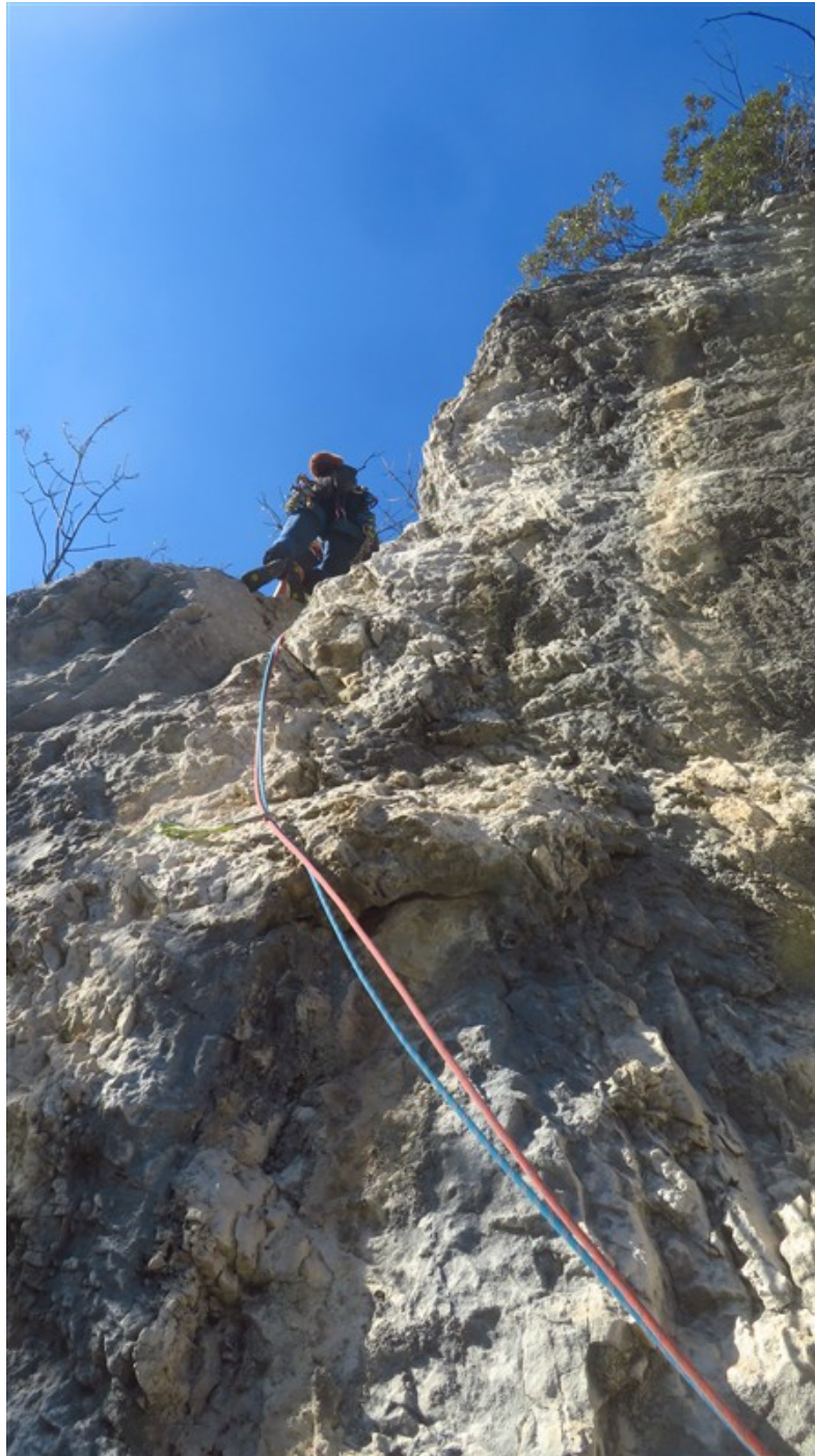
Partenza sesta lunghezza