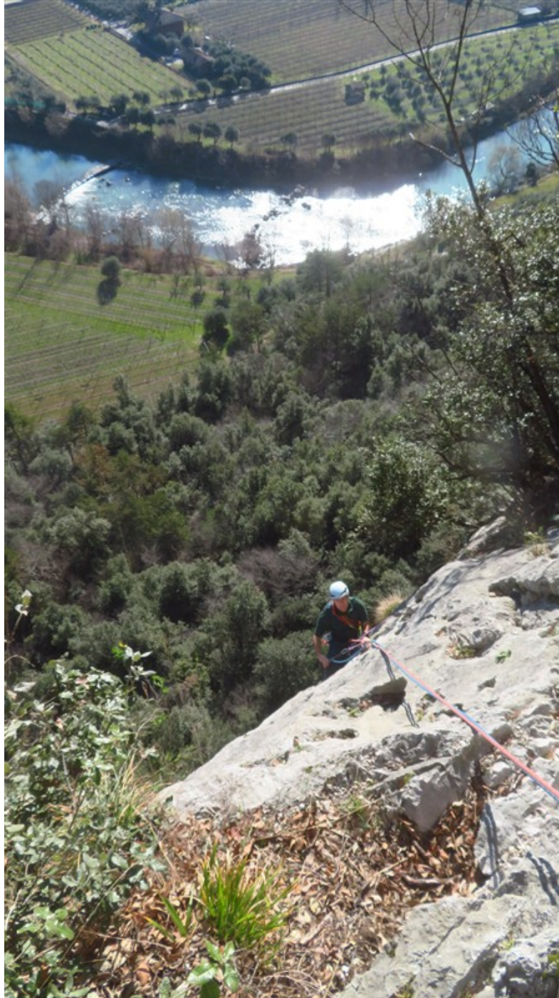
Uscita seconda lunghezza