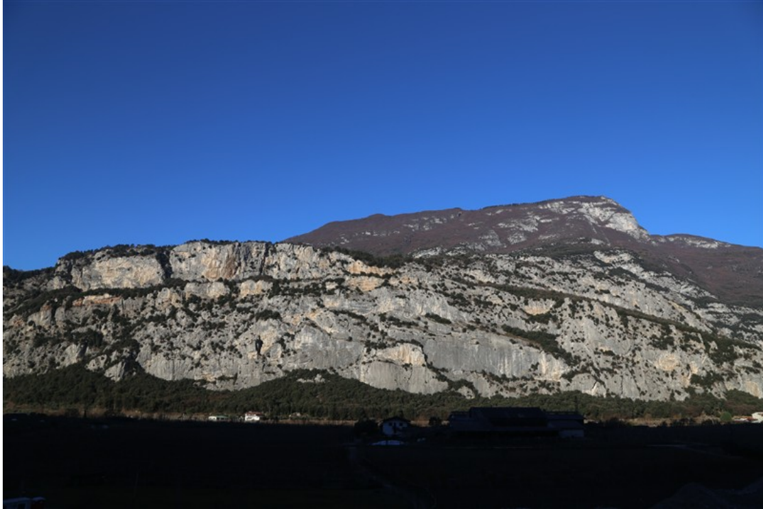
Parete di San Paolo