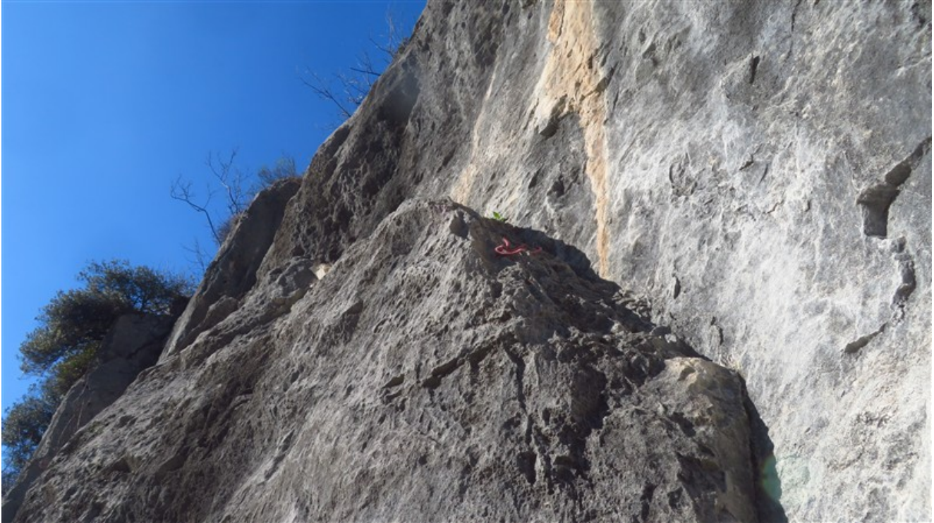
Partenza terza lunghezza