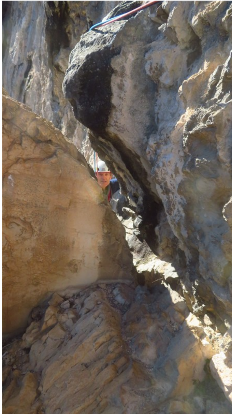
Partenza ottava lunghezza