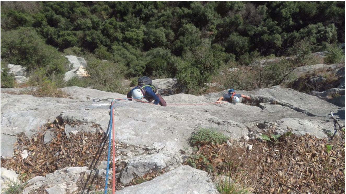
Il muro della terza lunghezza