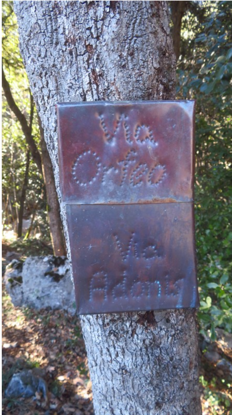
Libro di via