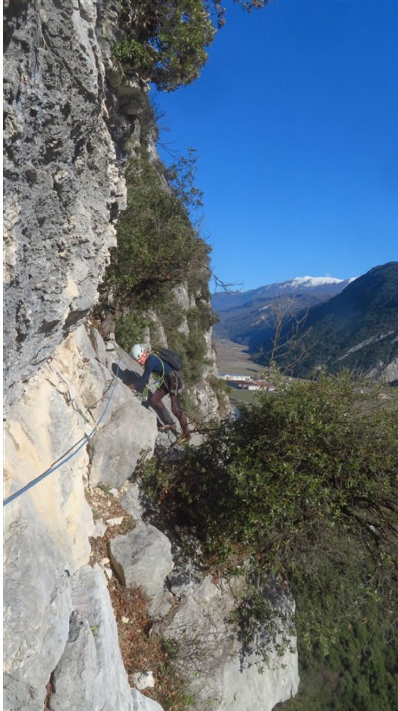
Il traverso della quarta lunghezza che porta in sosta