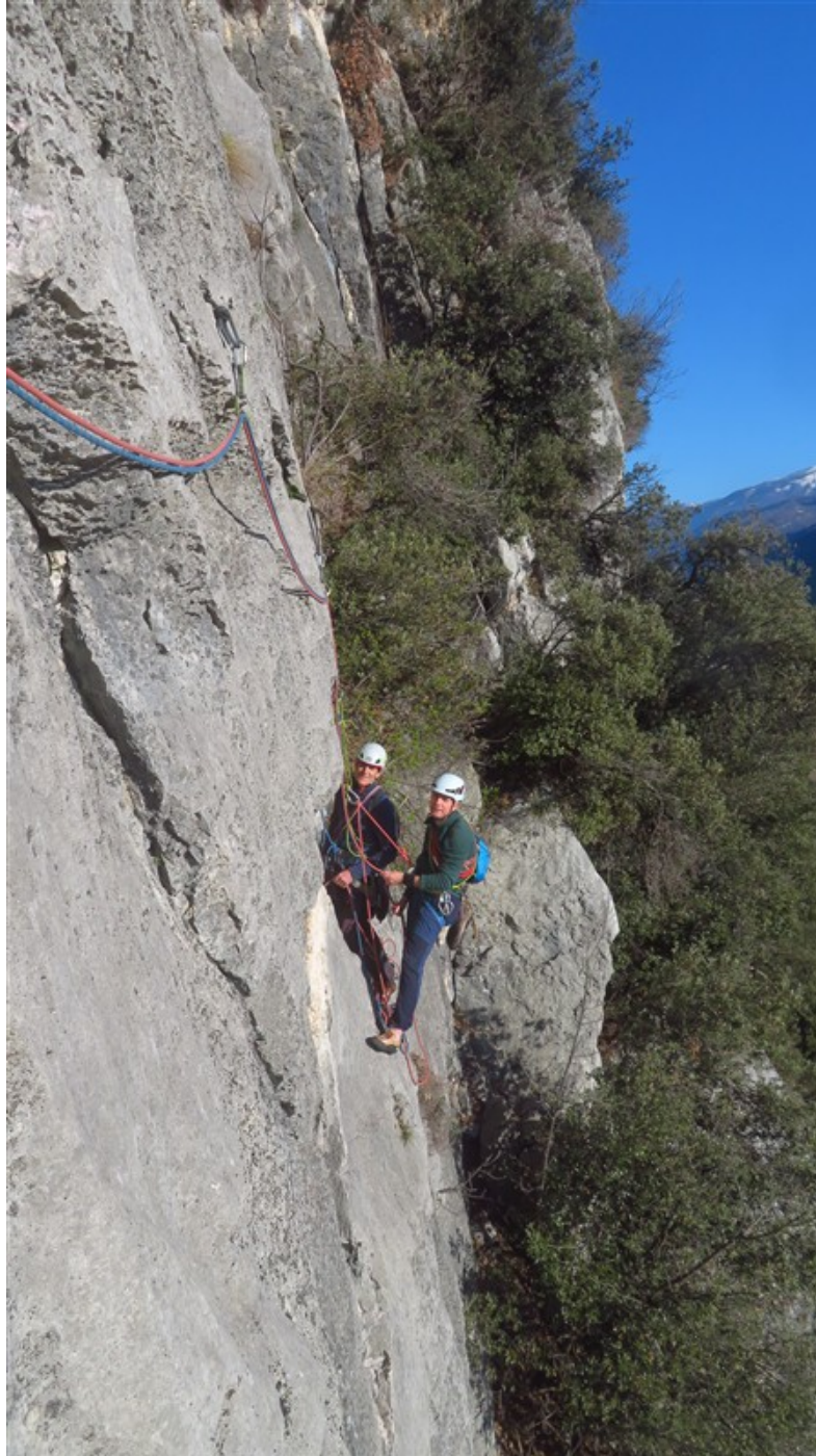
Primo tratto seconda lunghezza