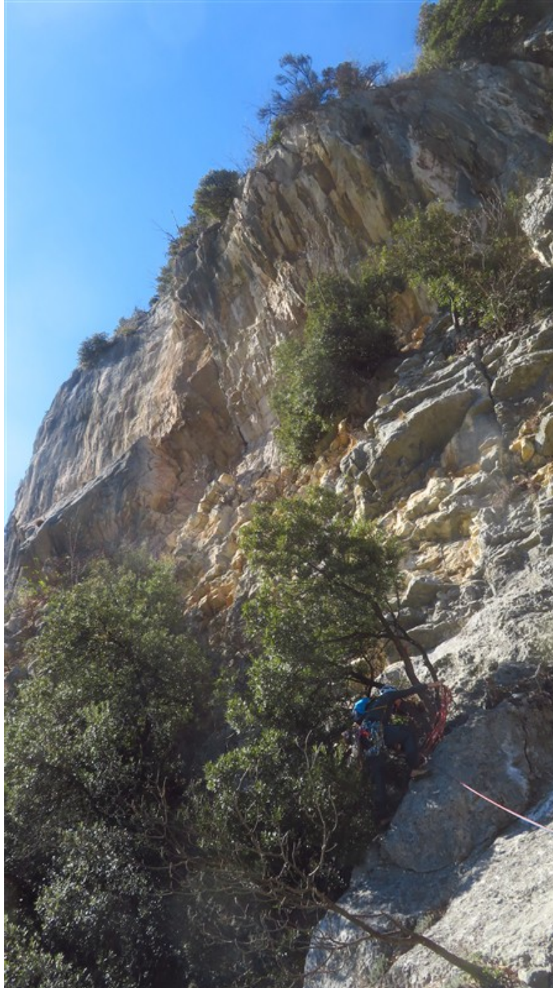
Sosta della sesta lunghezza