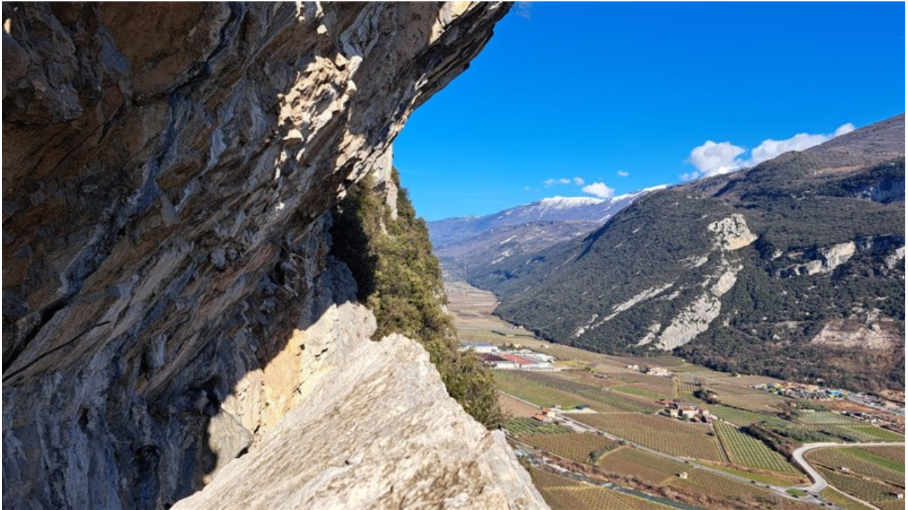
Panorama dall'ottava sosta