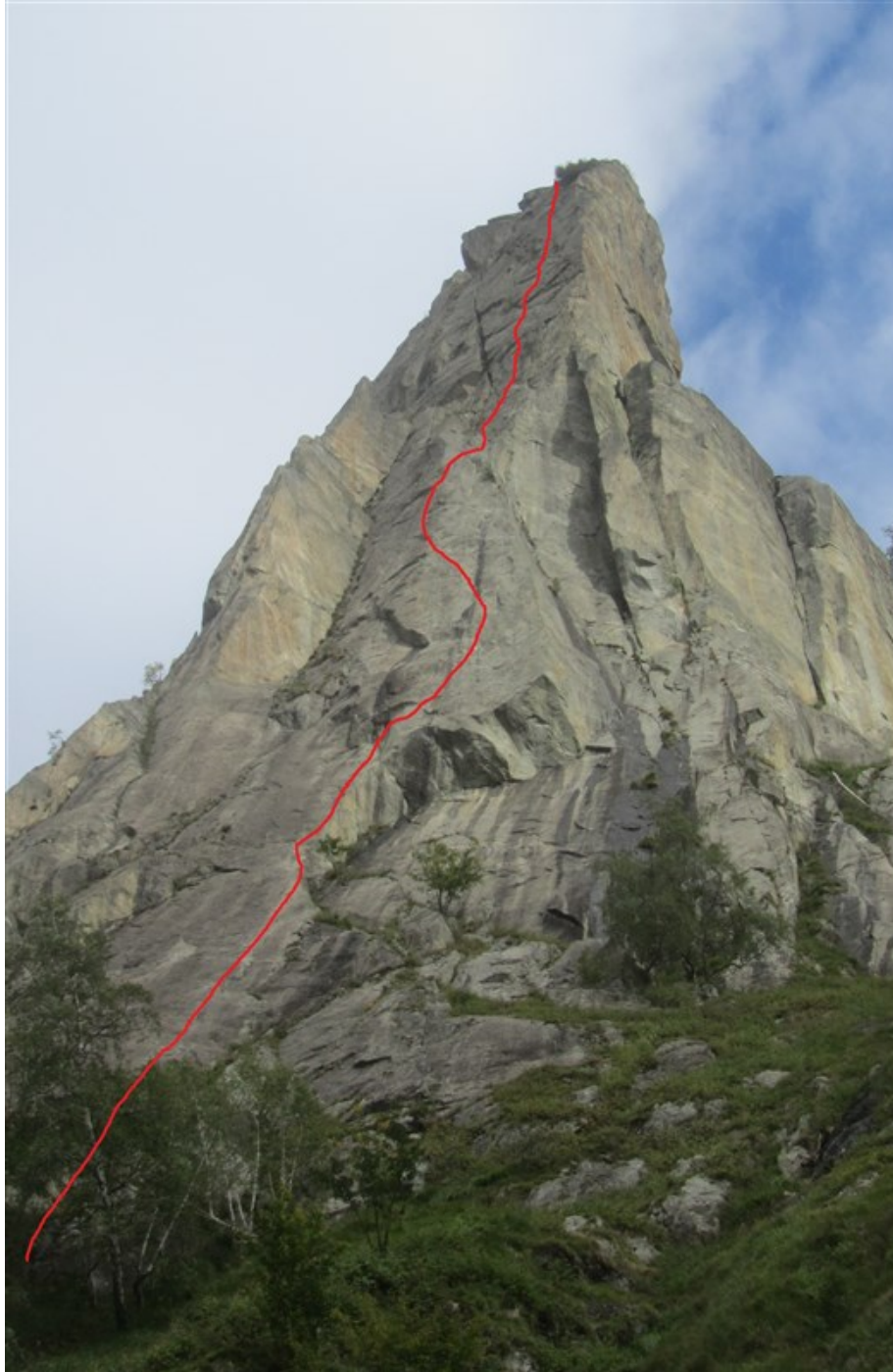
Tracciato indicativo Vento beffardo