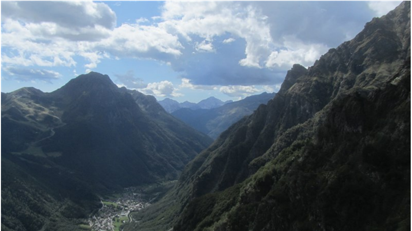
Panorama sulla valle