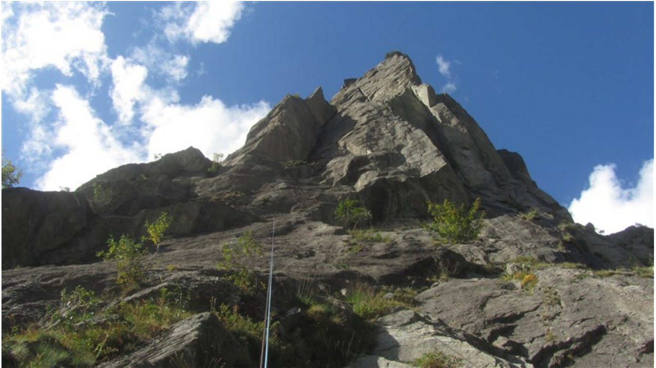
Il Pinnacolo al termine delle doppie.