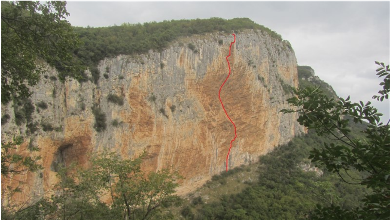
Tracciato indicativo via Baby Doc