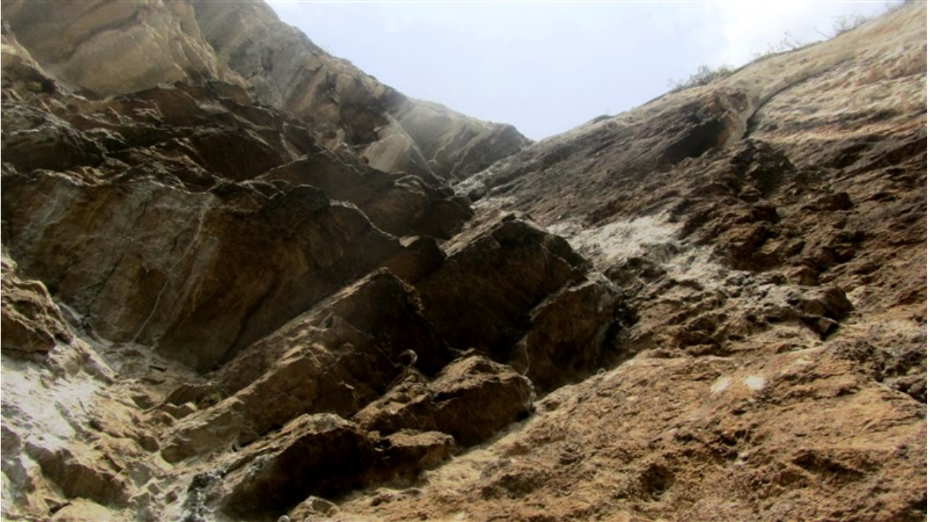
Quinta lunghezza dalla quarta sosta