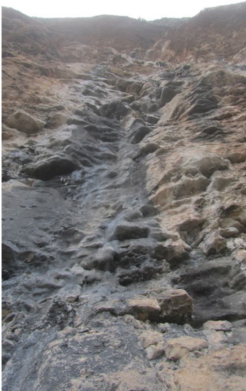
Prima lunghezza dall'attacco