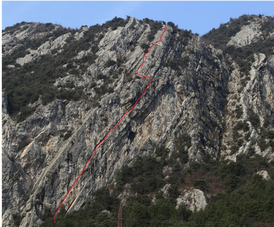
Tracciato indicativo via Rampa con pilastro