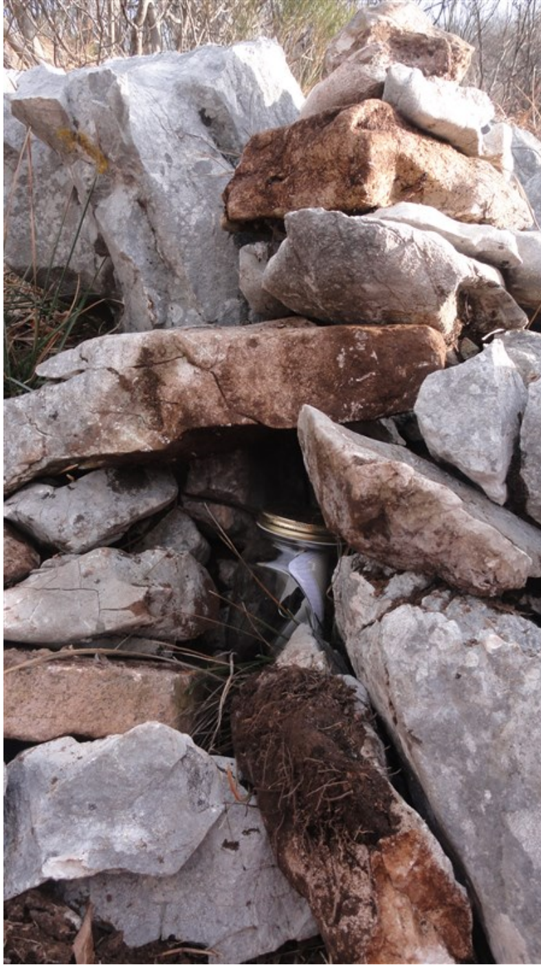
Ometto con libro di via