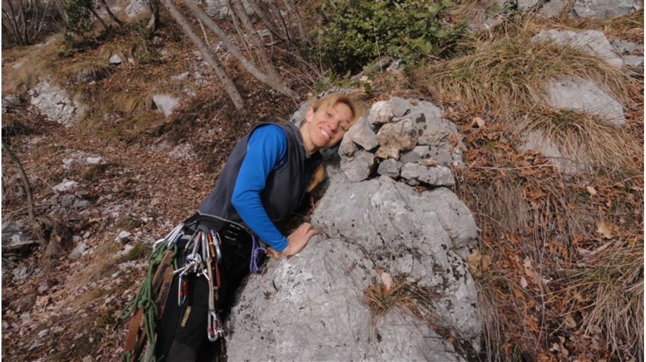
Ometto che indica dove salire verso la parete