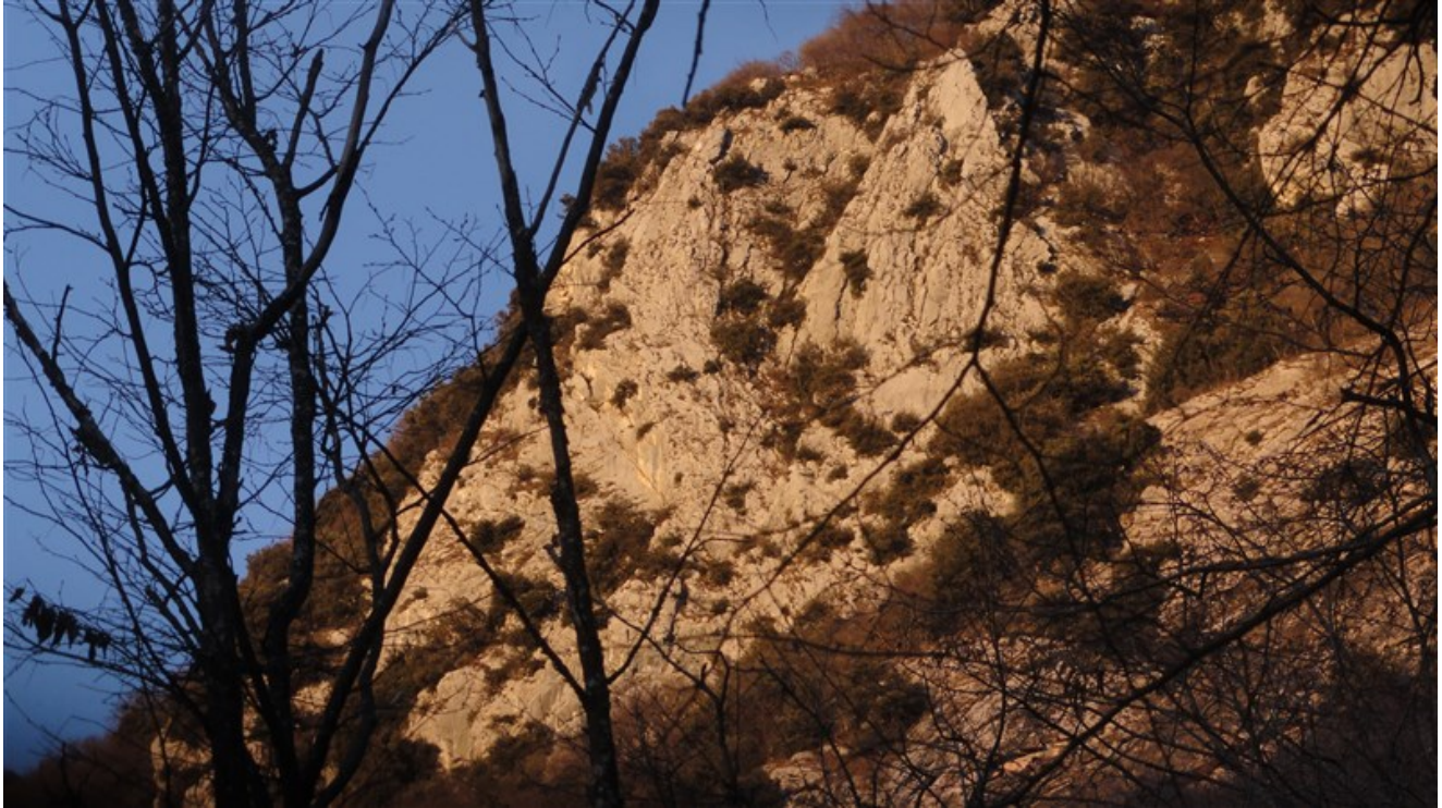
Parete di Pezol sud