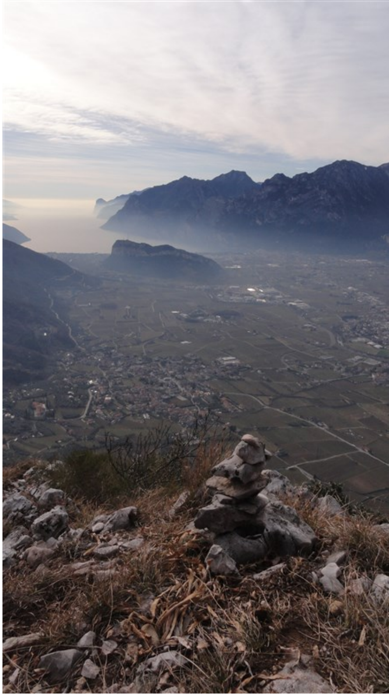
Panorama dalla cima