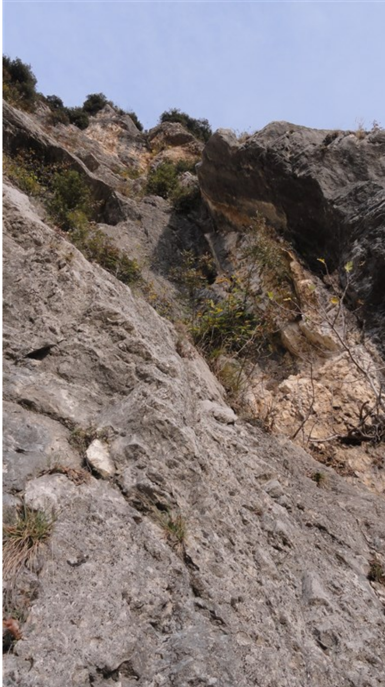
Primo tiro dall'attacco