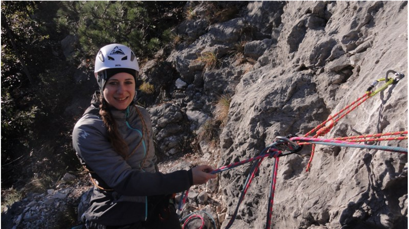
Manu alla prima sosta