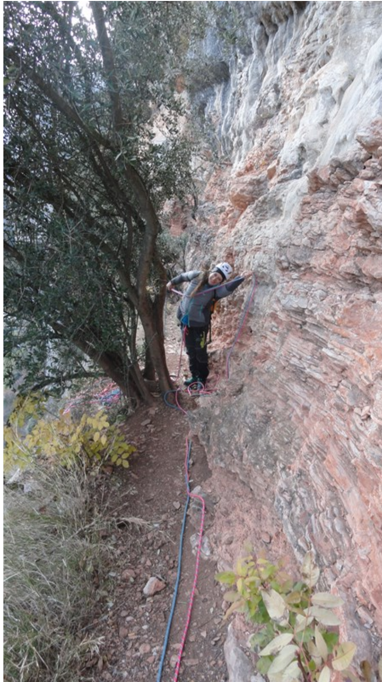
La cengia rossa