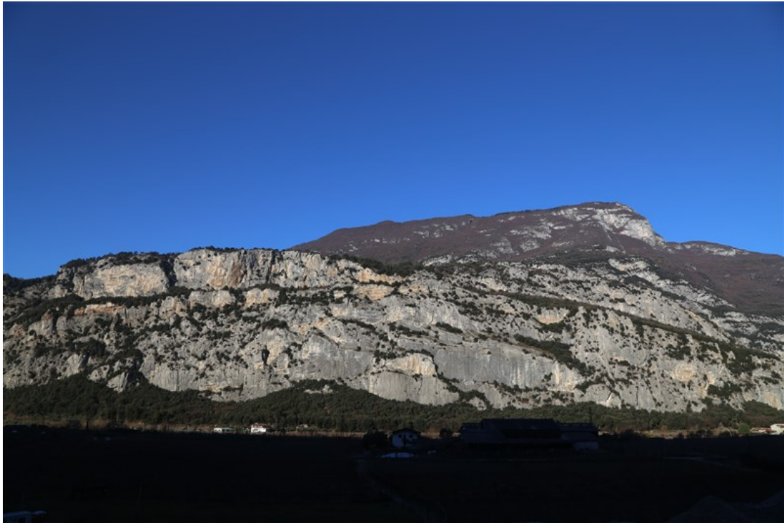
Parete di San Paolo