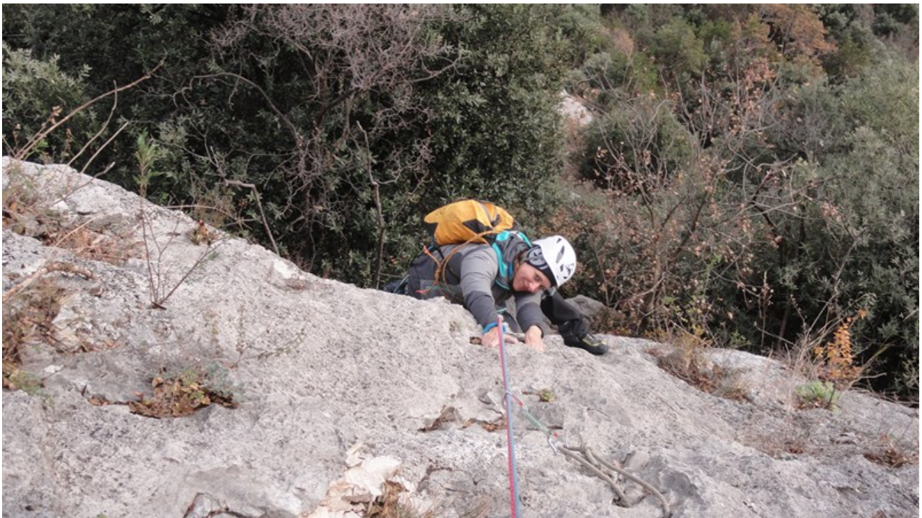
Uscita quarta lunghezza