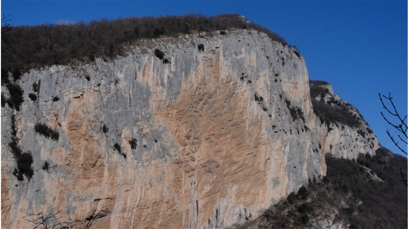
La parete di Castel Presina