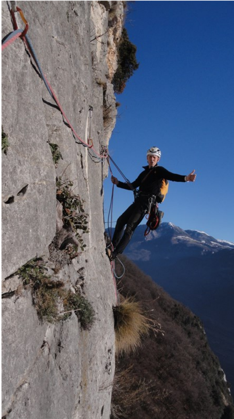
Traverso e sosta seconda lunghezza