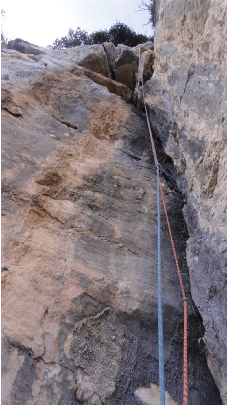
Diedro finale sesta lunghezza