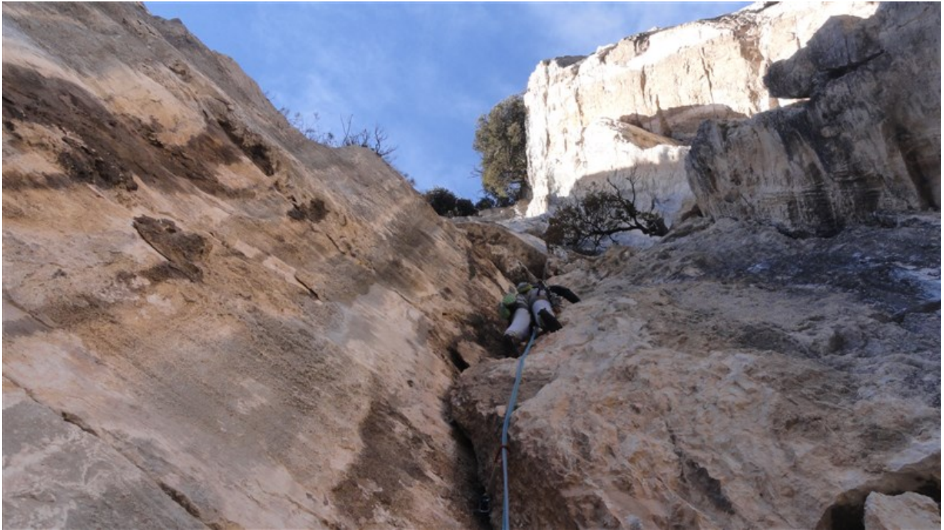
Parte iniziale sesta lunghezza