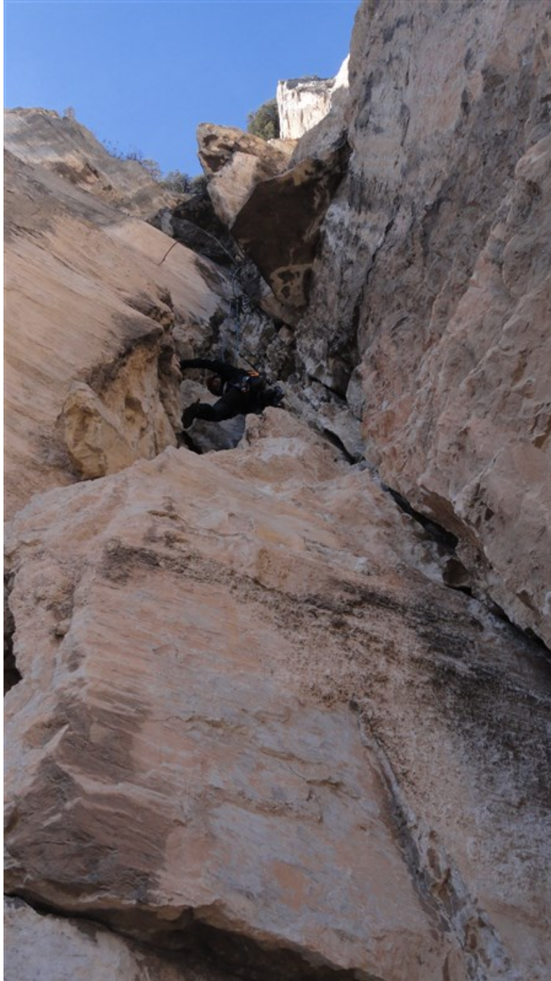
Parte finale quinta lunghezza