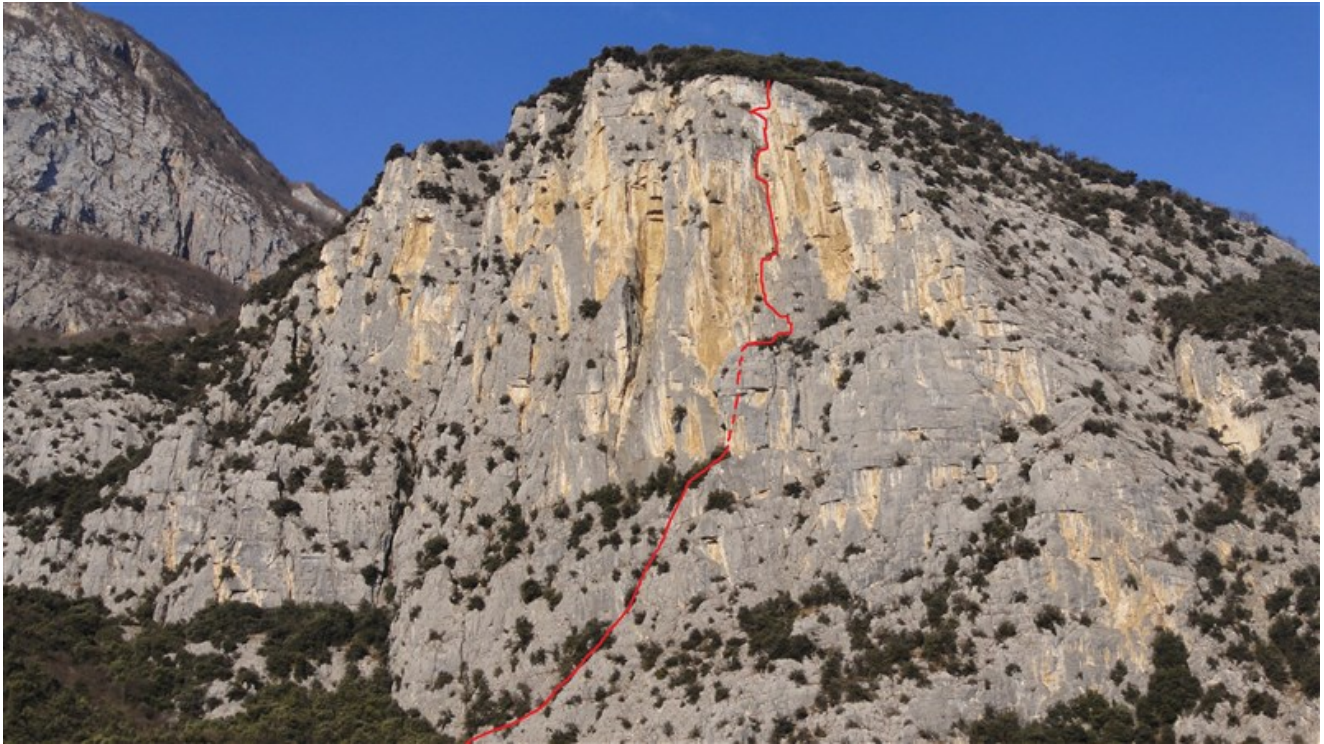
Tracciato indicativo via Factotum