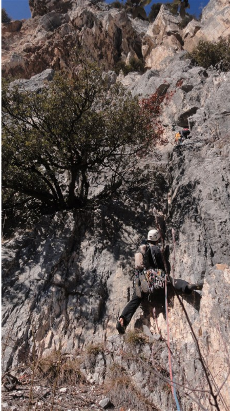
Partenza quarta lunghezza