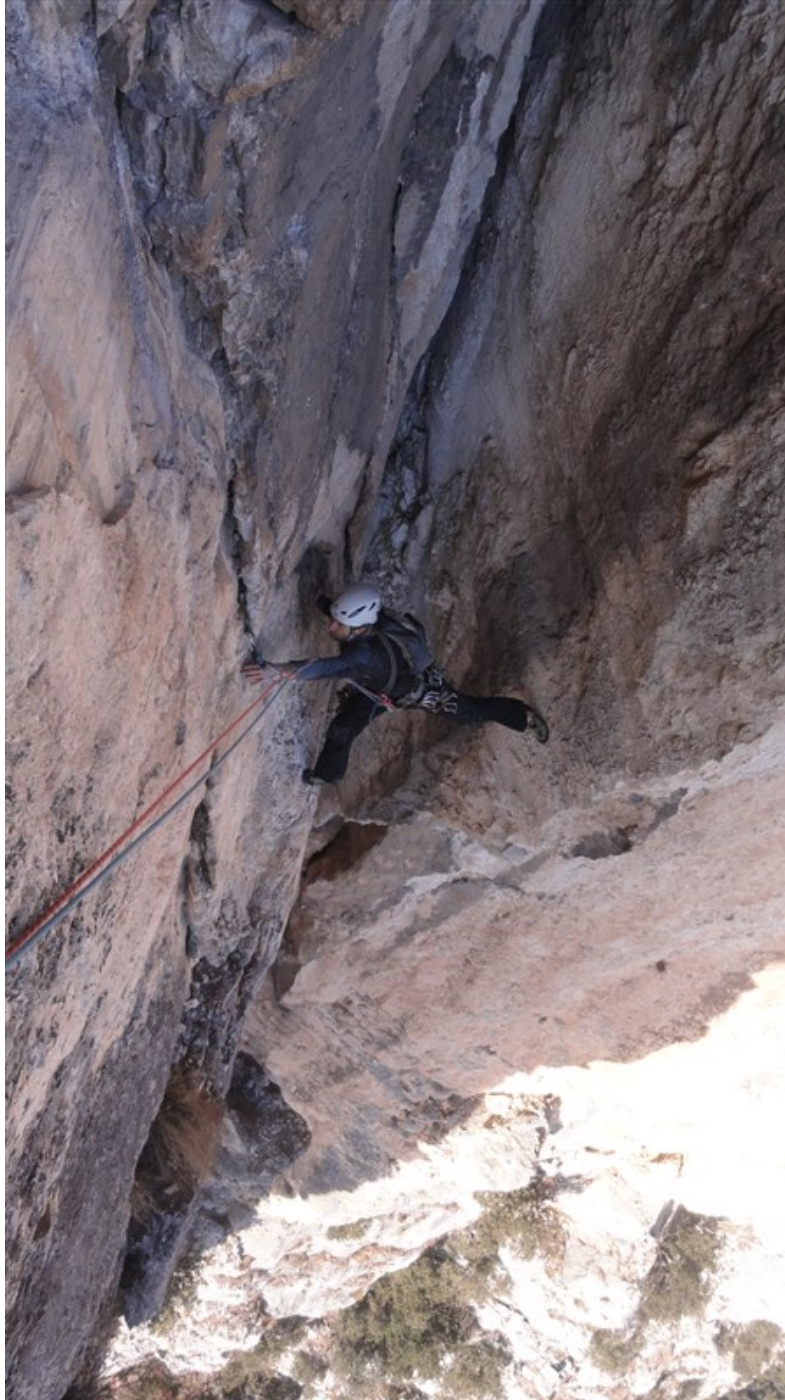
Uscita quinta lunghezza