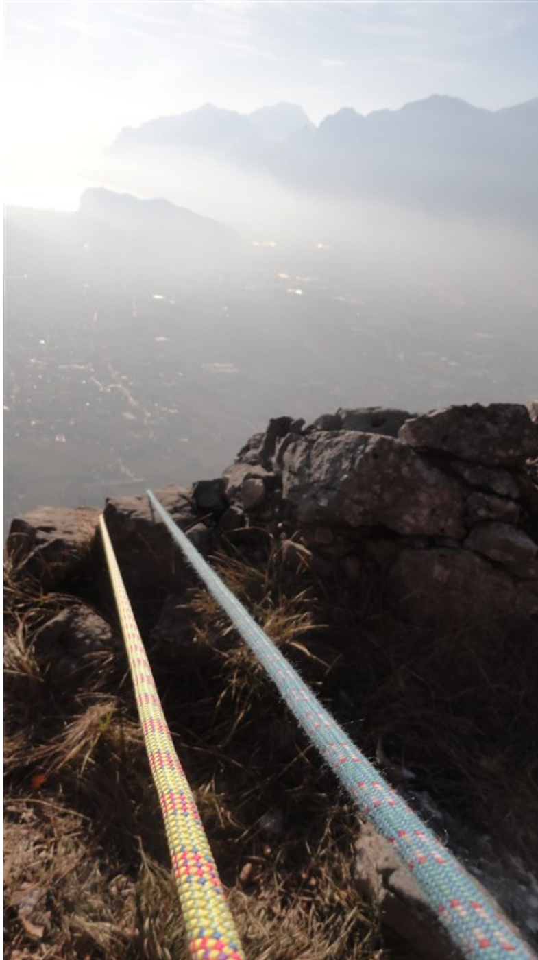
Nella trincea finale