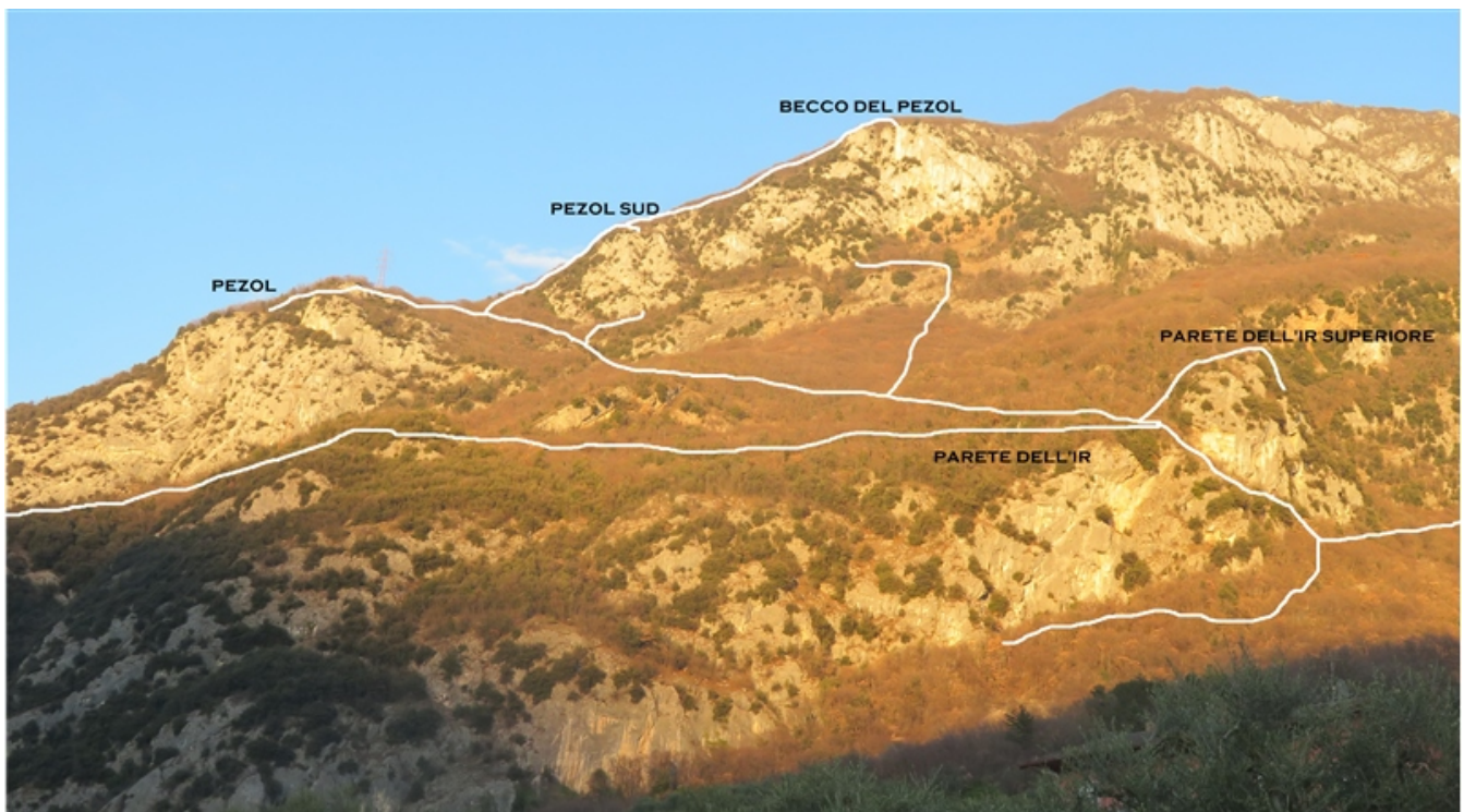
Veduta d'insieme Pezol e Parete dell'Ir