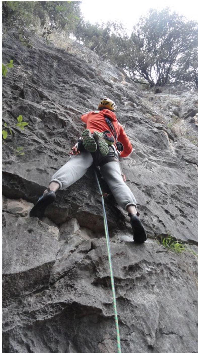
Inizio prima lunghezza