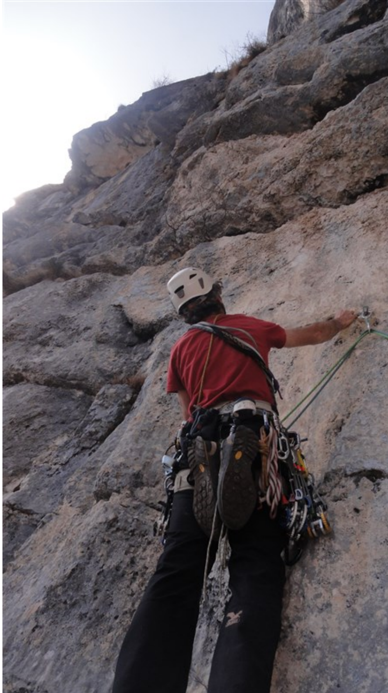
Partenza settima lunghezza