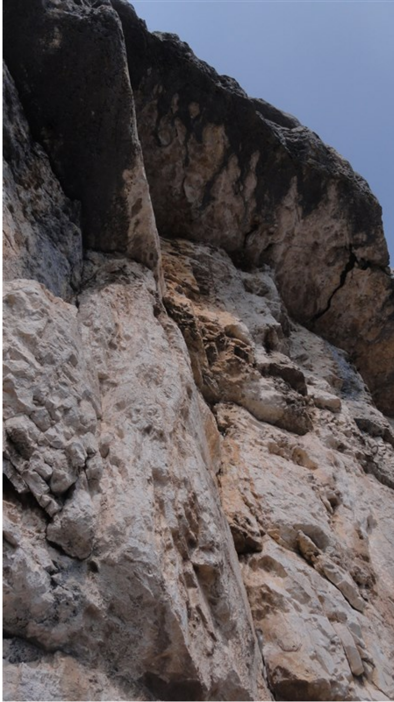
Partenza quinta lunghezza