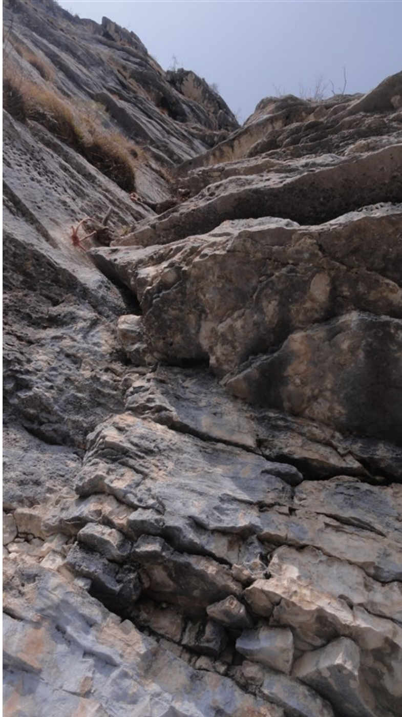
Partenza sesta lunghezza