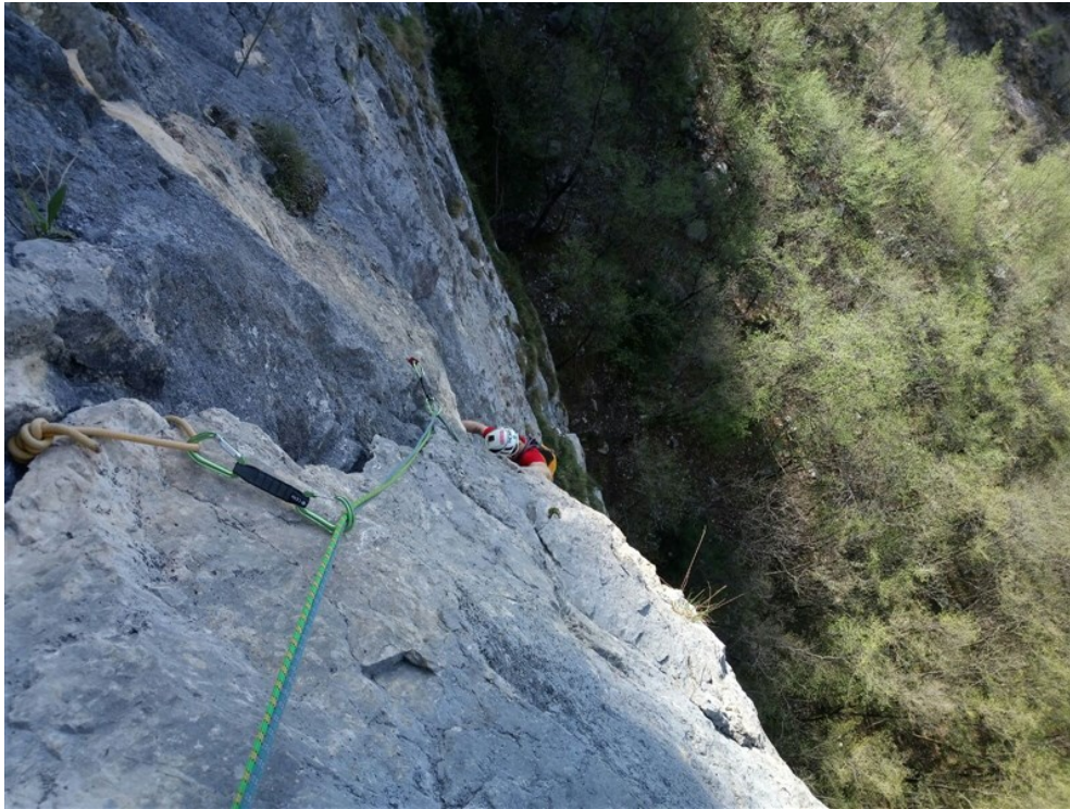
La bella lama finale della terza lunghezza