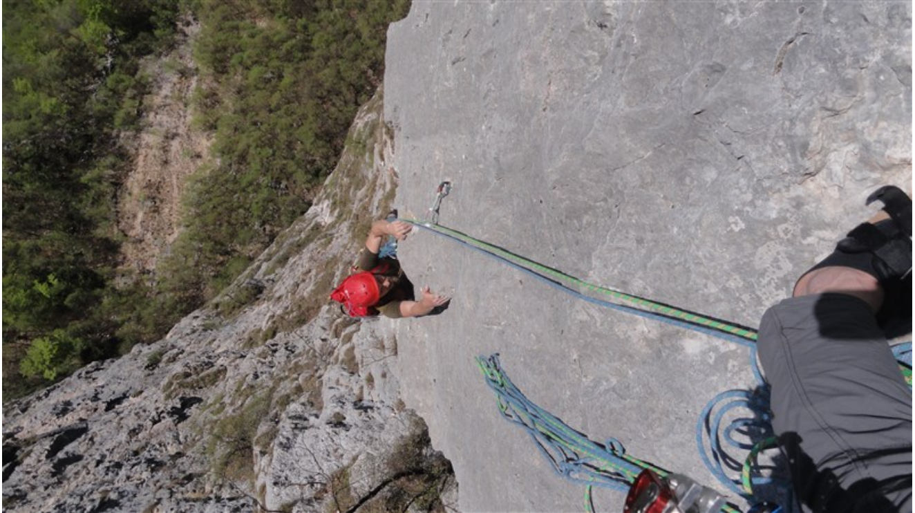
Tratto finale nona lunghezza