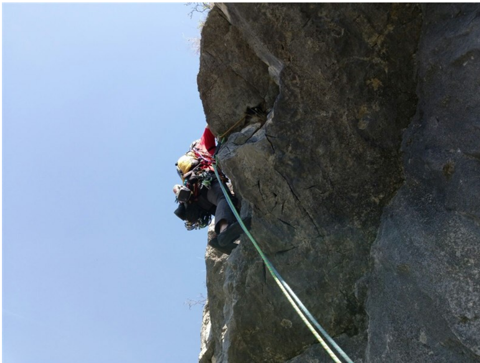
Lo strapiombino iniziale della quarta lunghezza