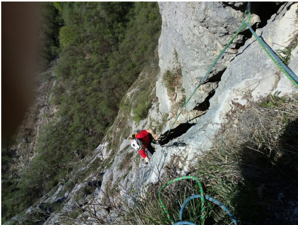
Tratto finale settima lunghezza