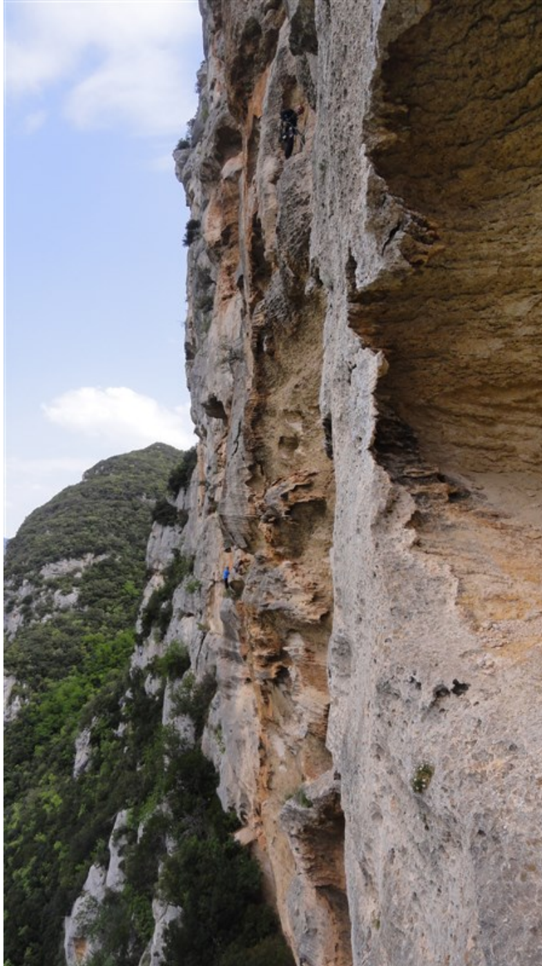
Ambiente Bric Pianarella