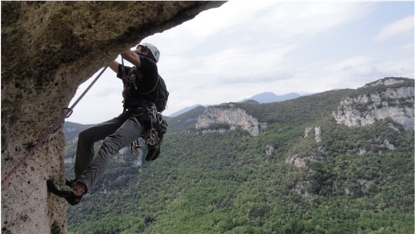
Inizio ottava lunghezza