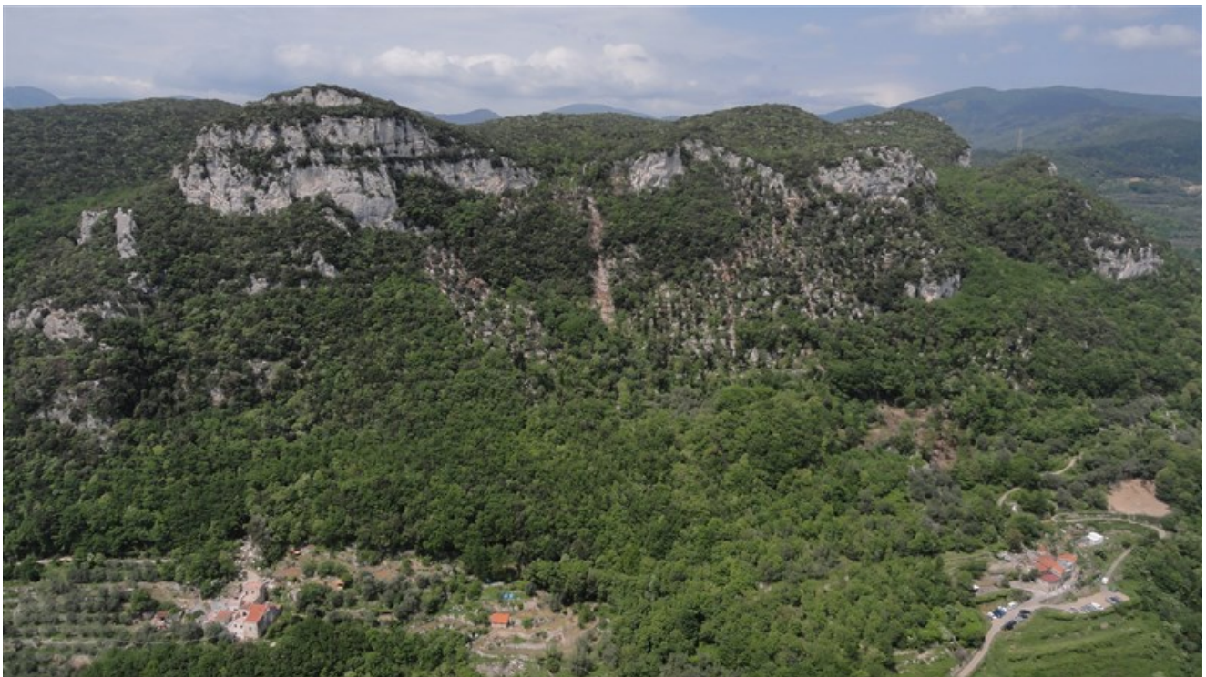
Panorama sulla valle