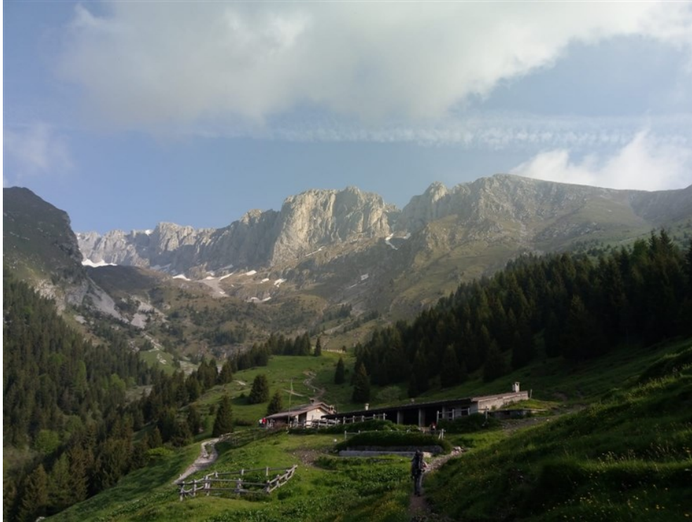
Presolana durante l'avvicinamento