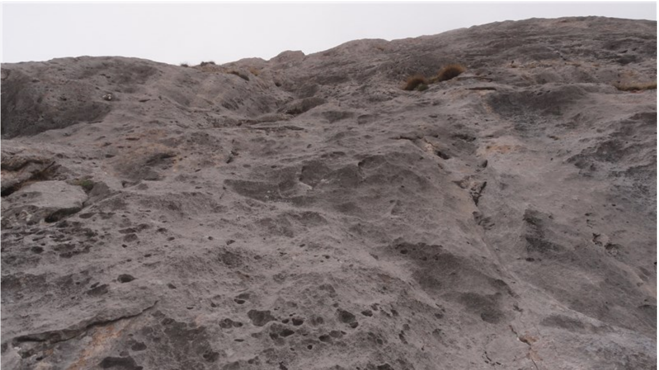
Partenza quarta lunghezza