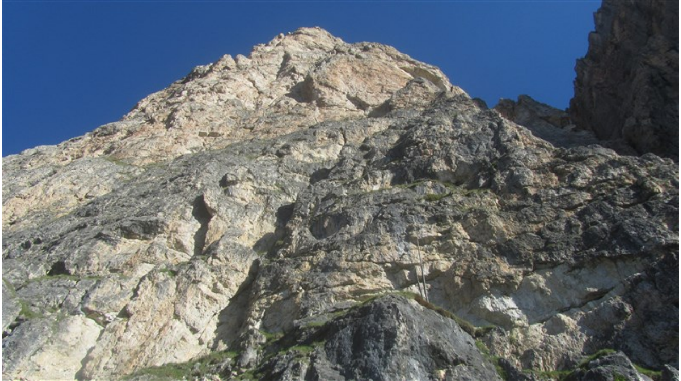
La parete dalla base