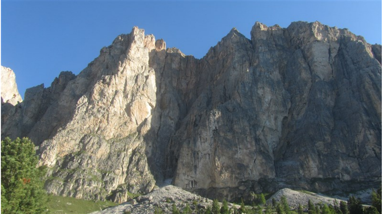
Sass da Ciampac