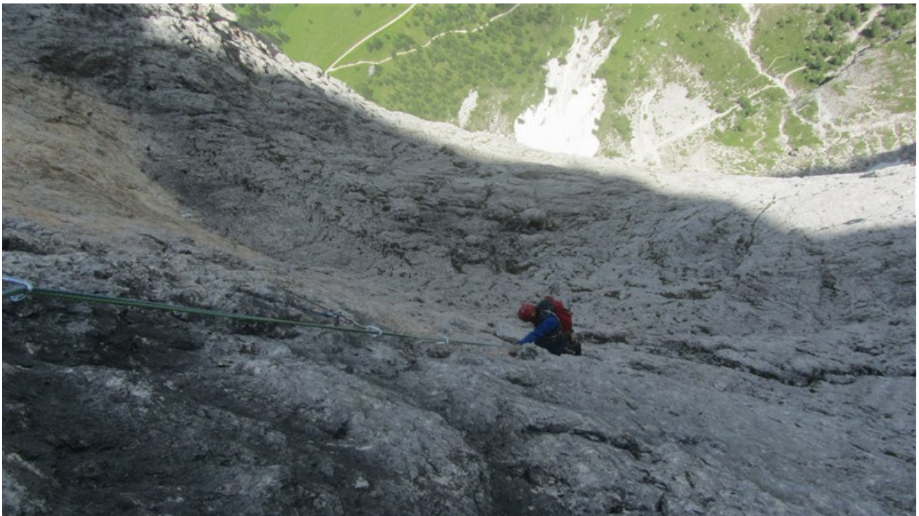
Tredicesima lunghezza: il muro nero