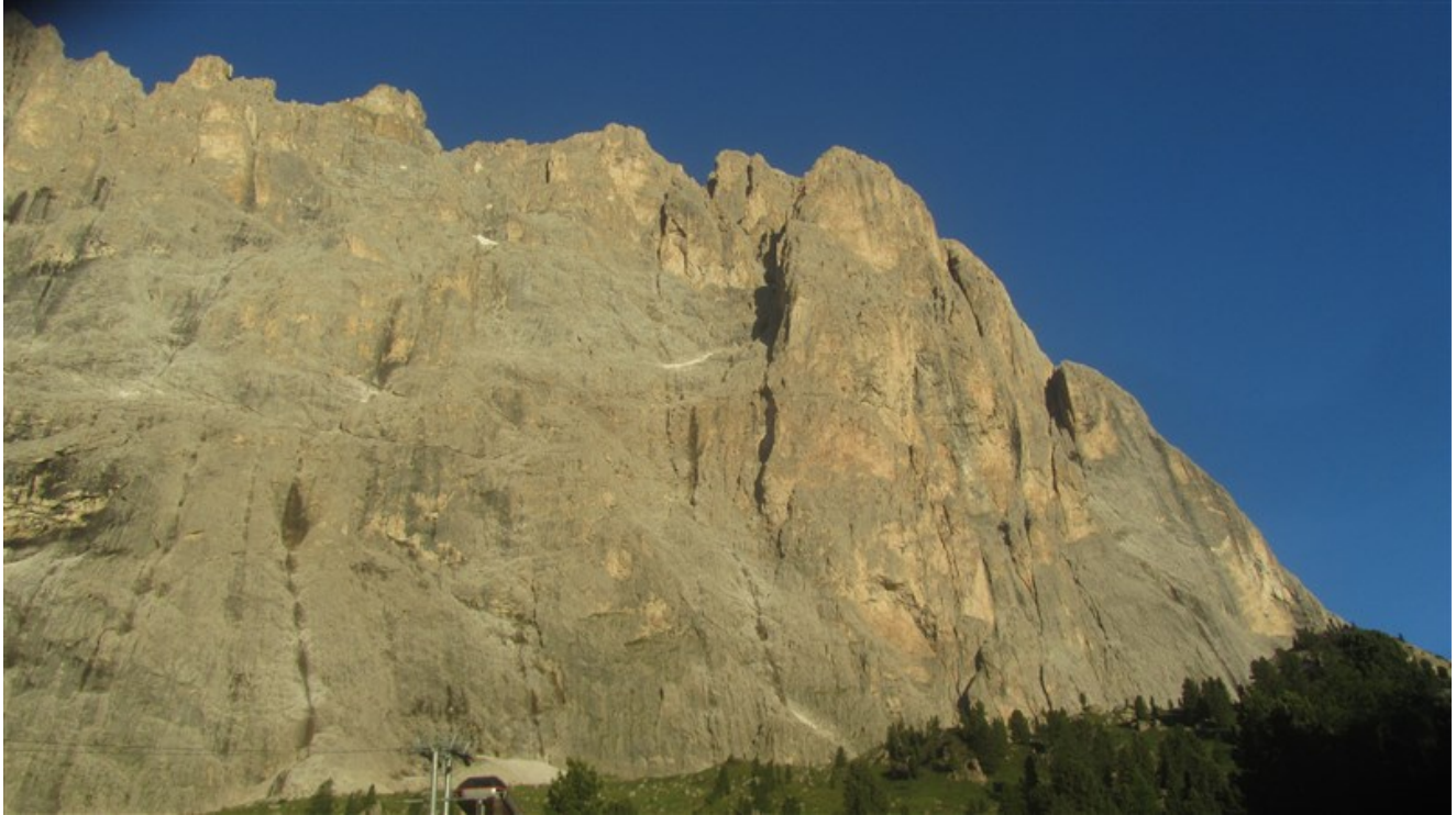
Parete nord-est del Sassolungo: all'estrema destra il Pilastro nord