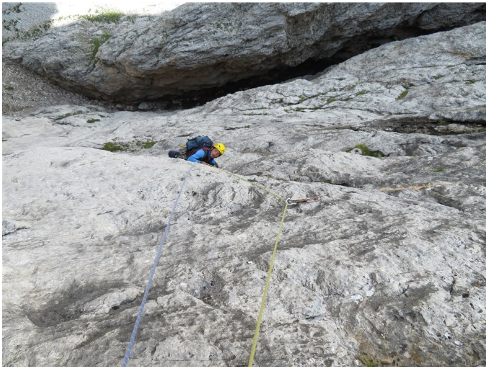
Parte finale della quinta lunghezza