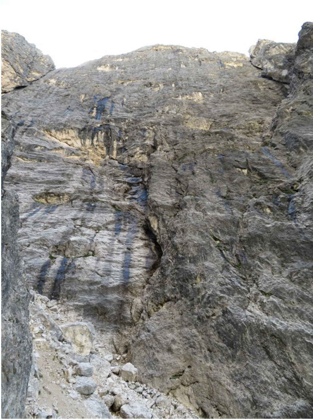
La parete dalla base