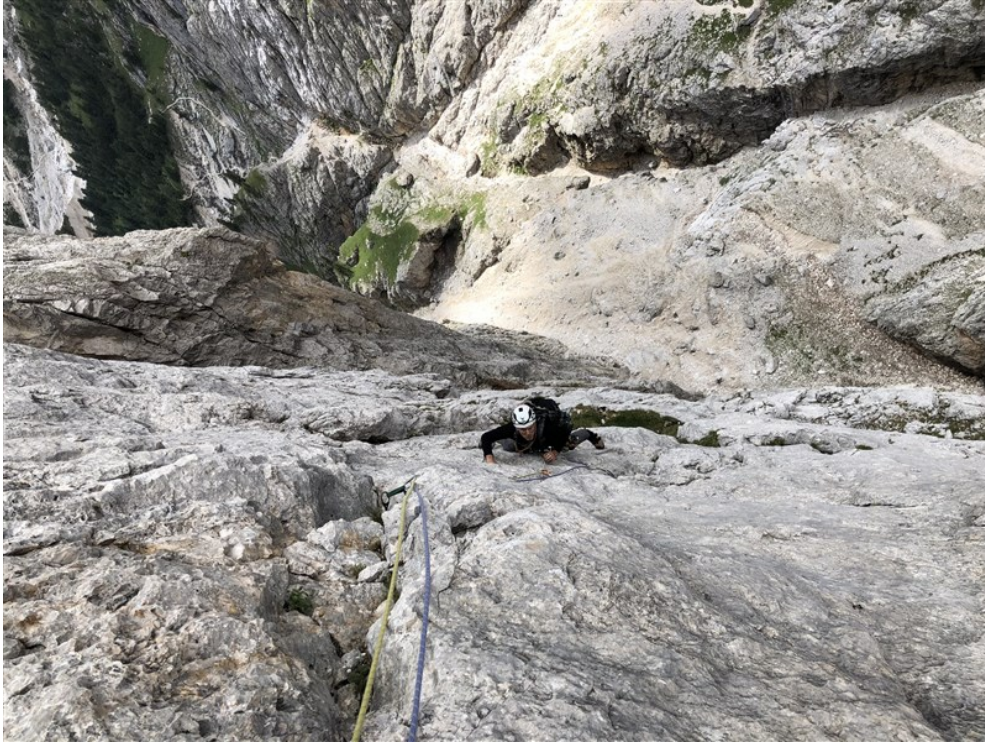
Parte finale ottava lunghezza