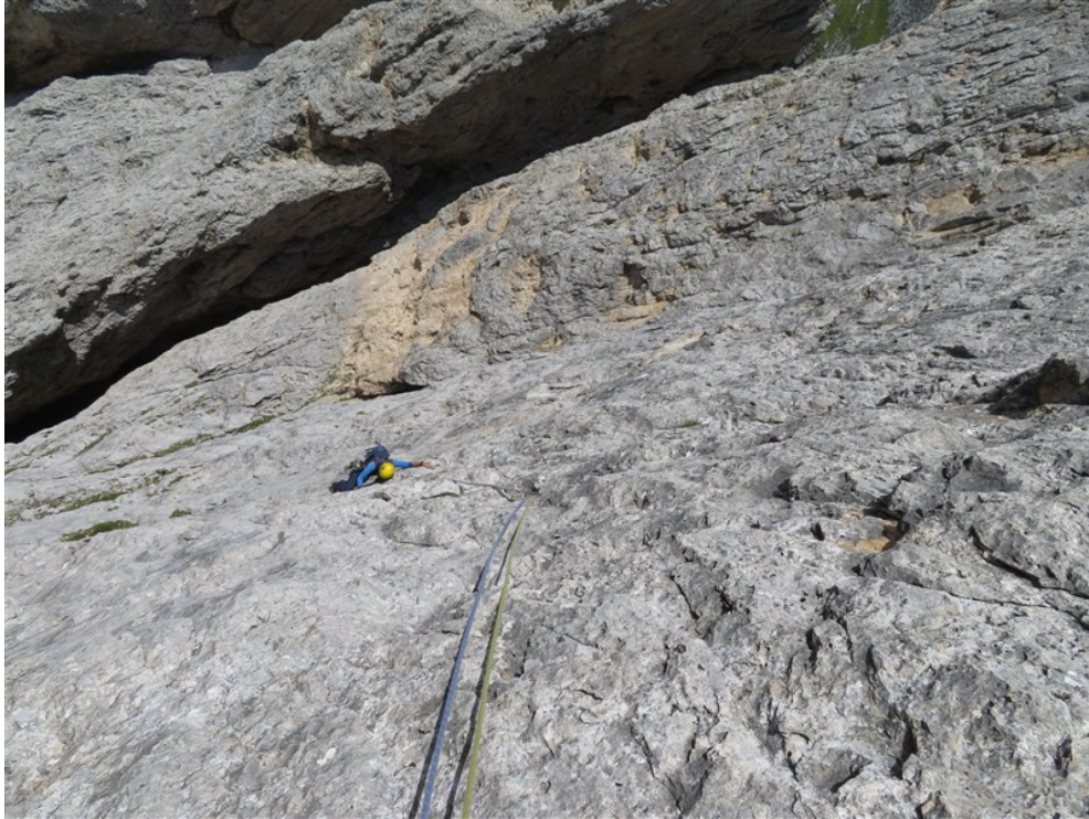
Parte finale nona lunghezza