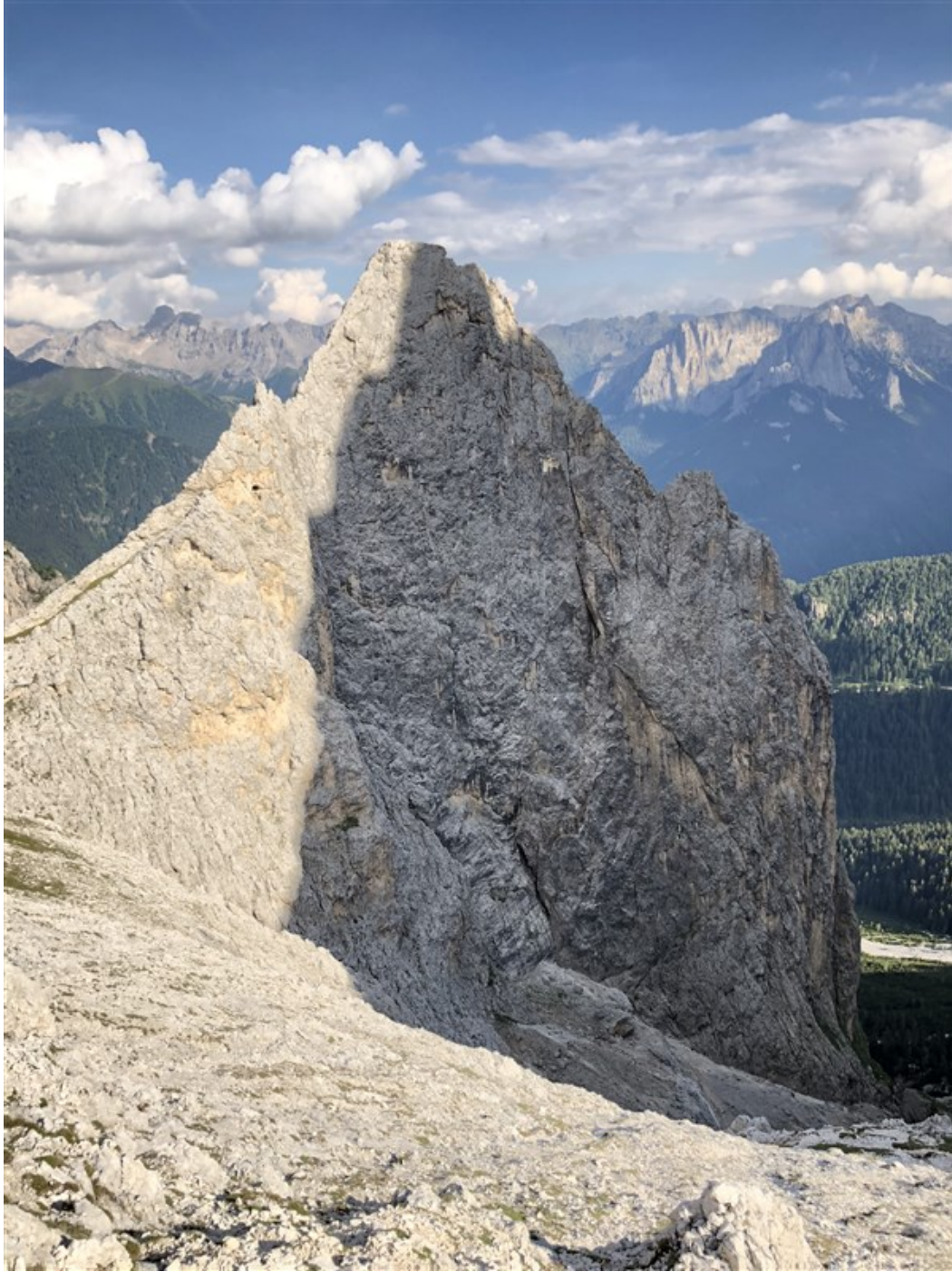
La Pala di profilo