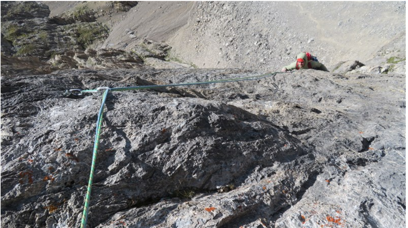
Parte finale quinta lunghezza