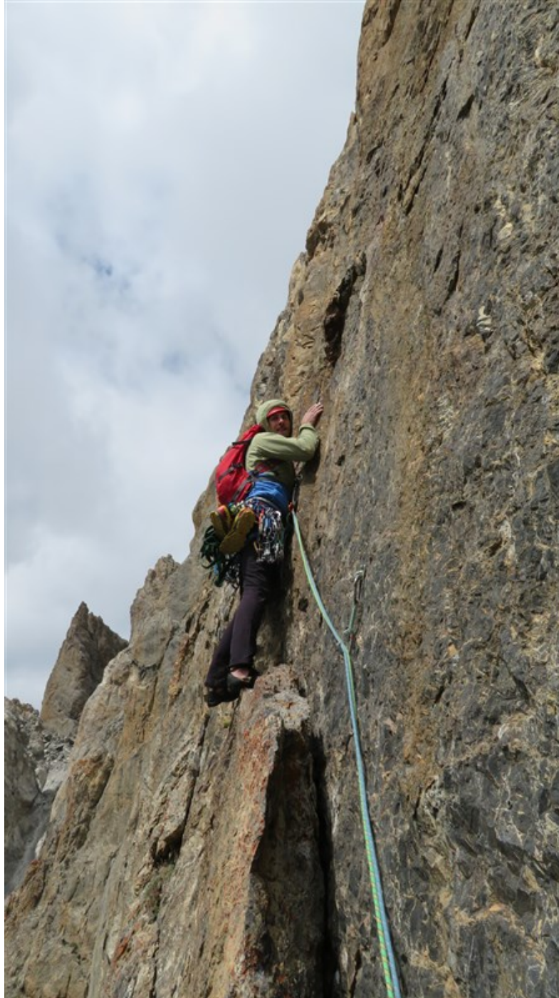
Partenza ottava lunghezza