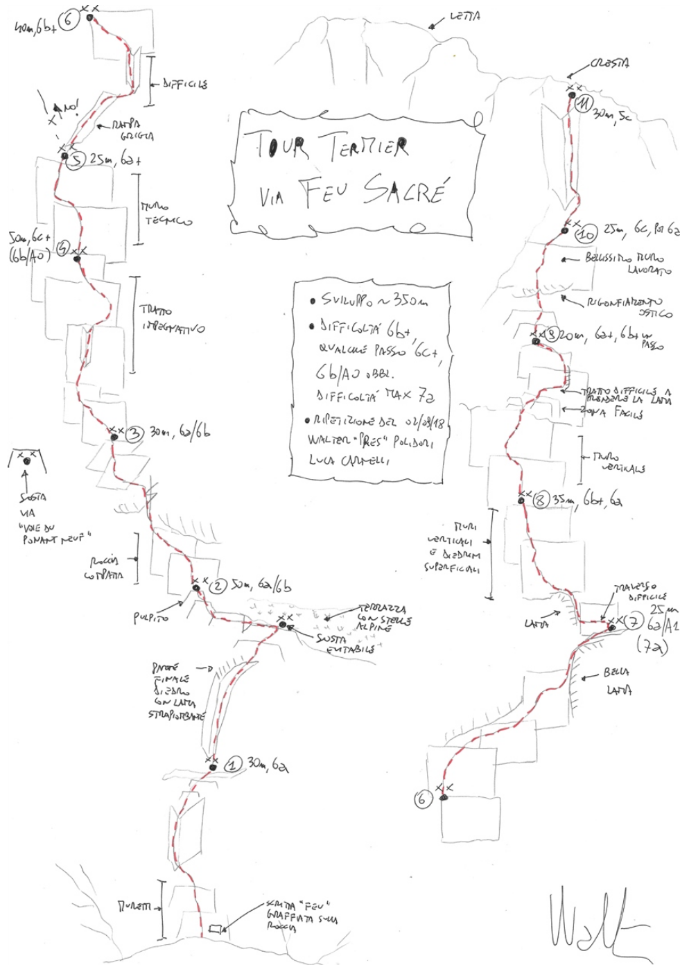
Schizzo della via