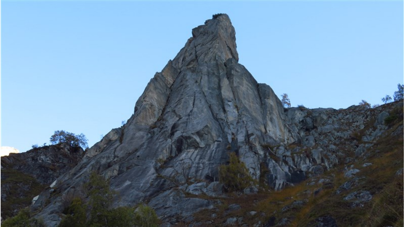
Pinnacolo di Maslana