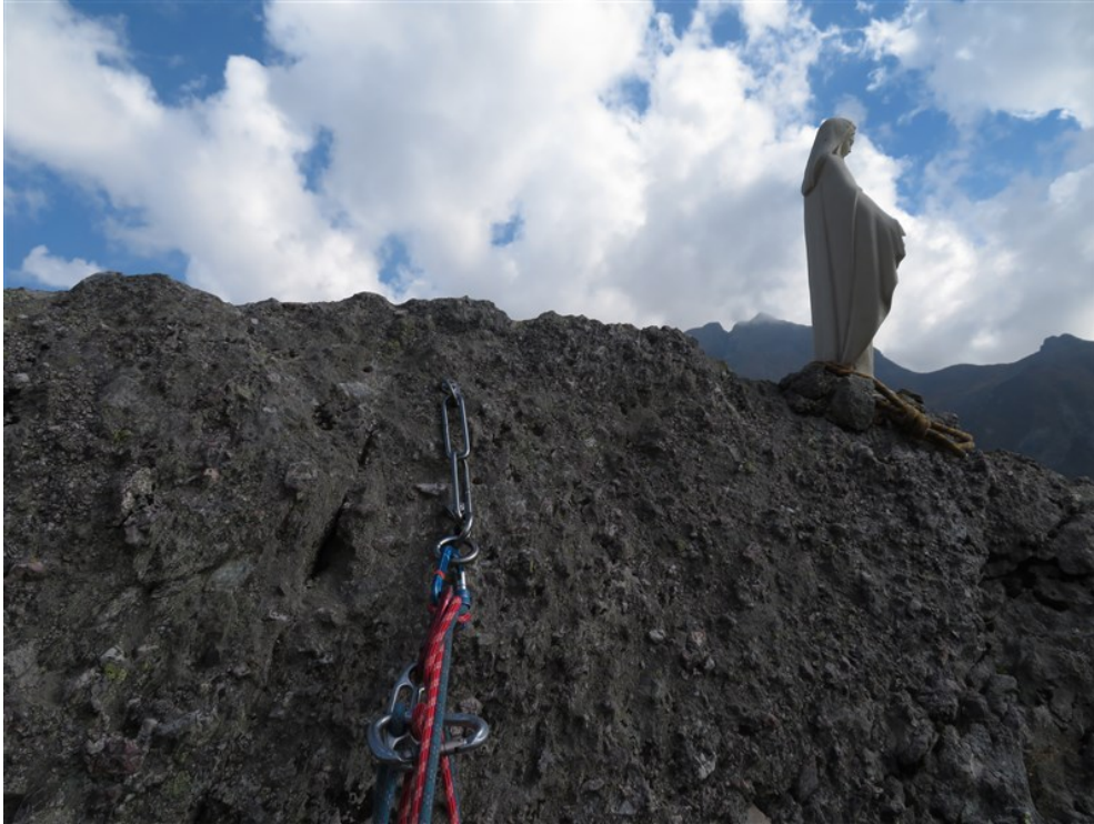
Madonnina di vetta