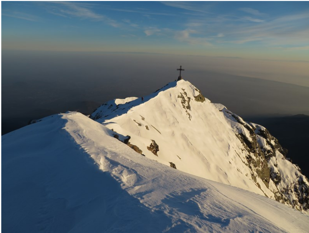
L'anticima dove esce la via, vista dalla cima principale