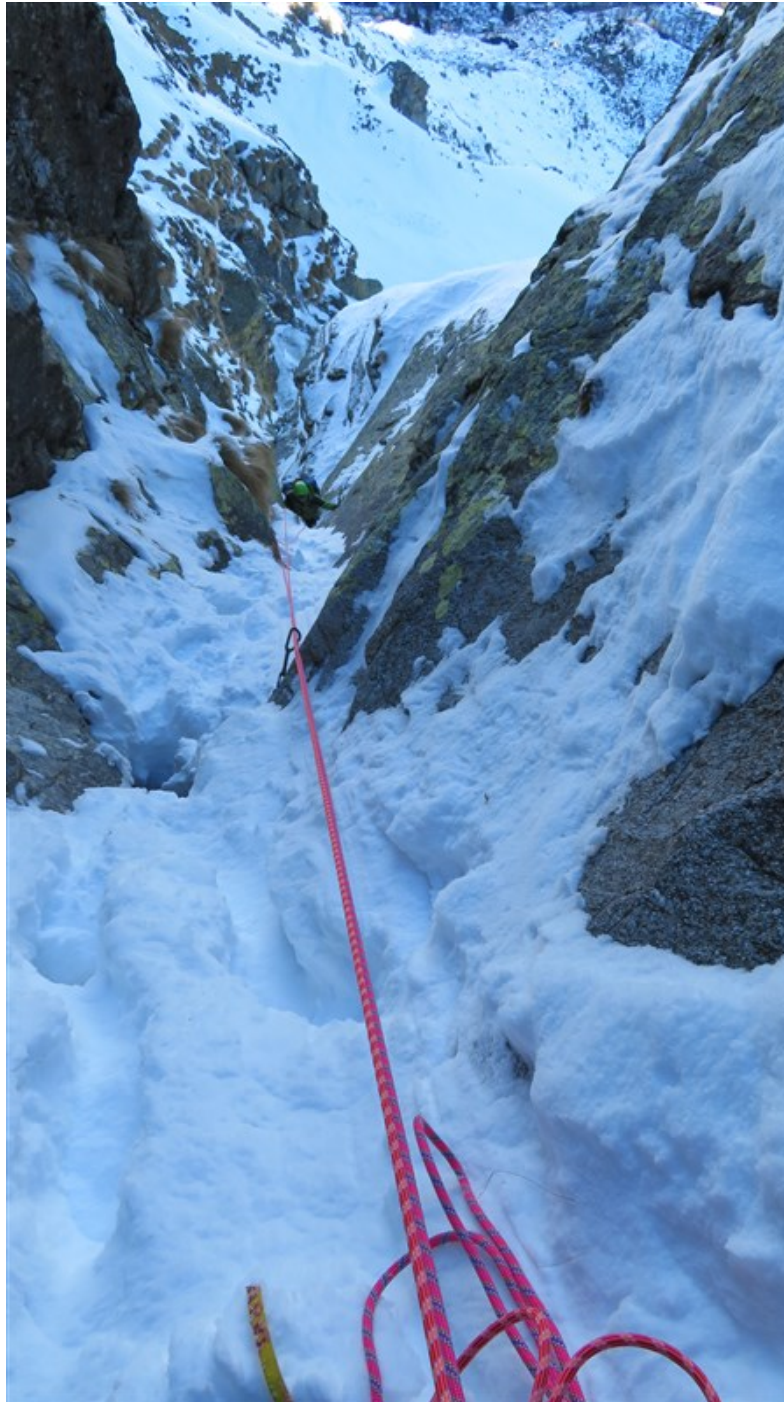
Quarta lunghezza, il canale finale