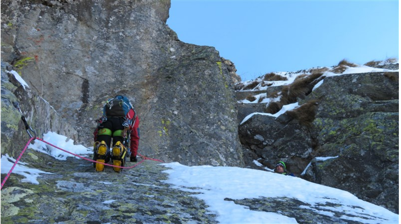
Terza lunghezza, la placca finale