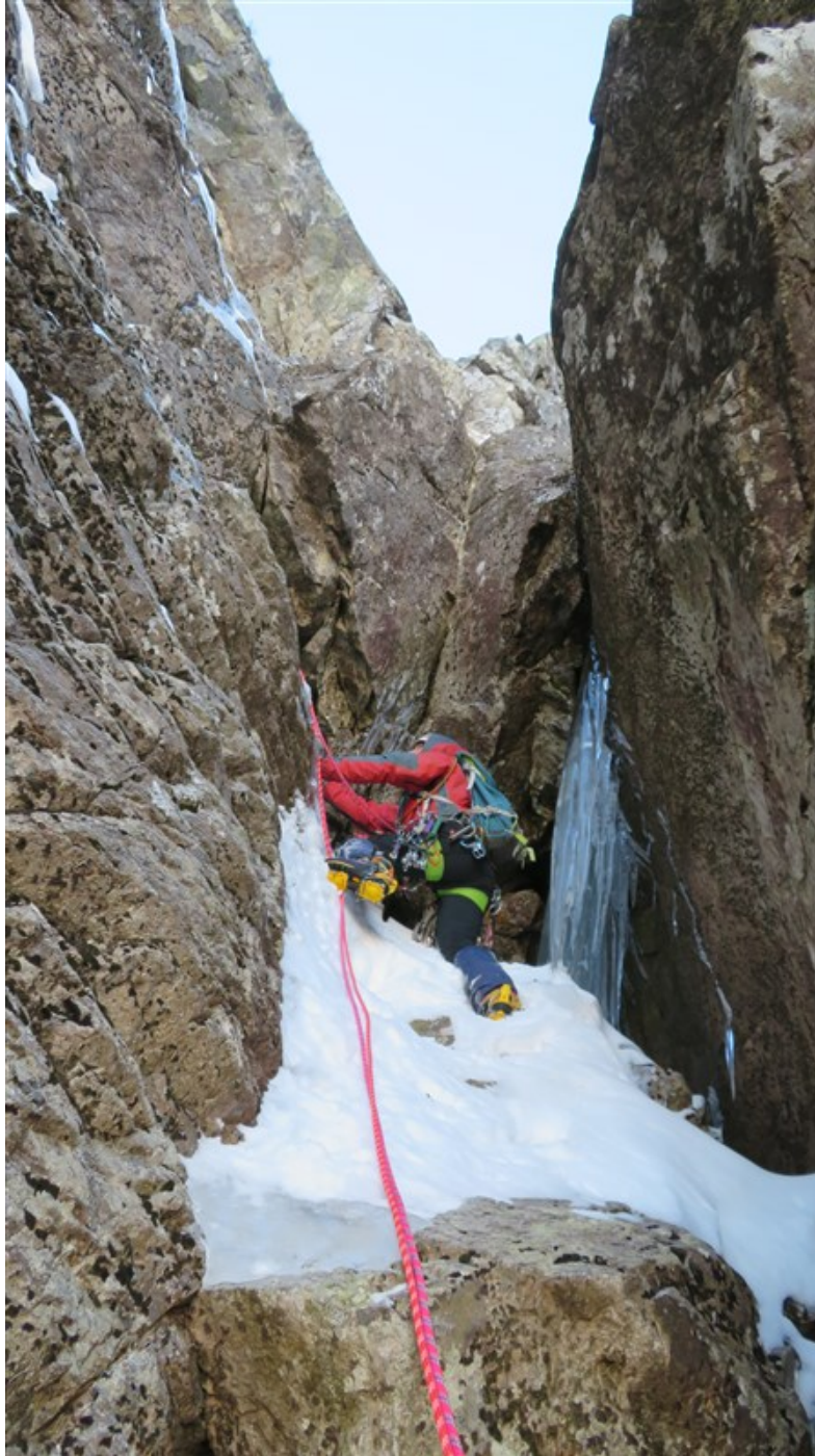
Partenza sesta lunghezza