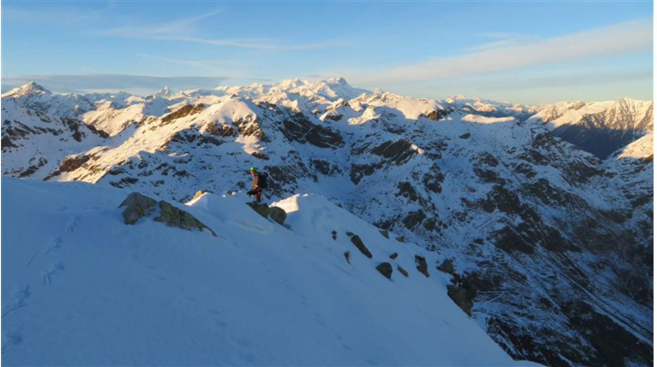
Inizia la discesa