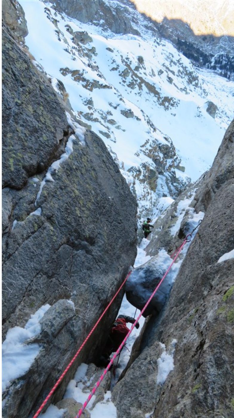
Quinta lunghezza, parte finale