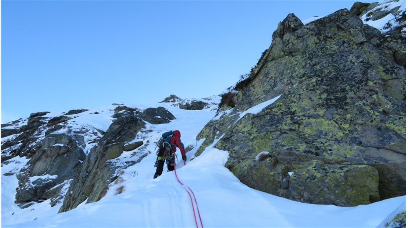
Verso la cima