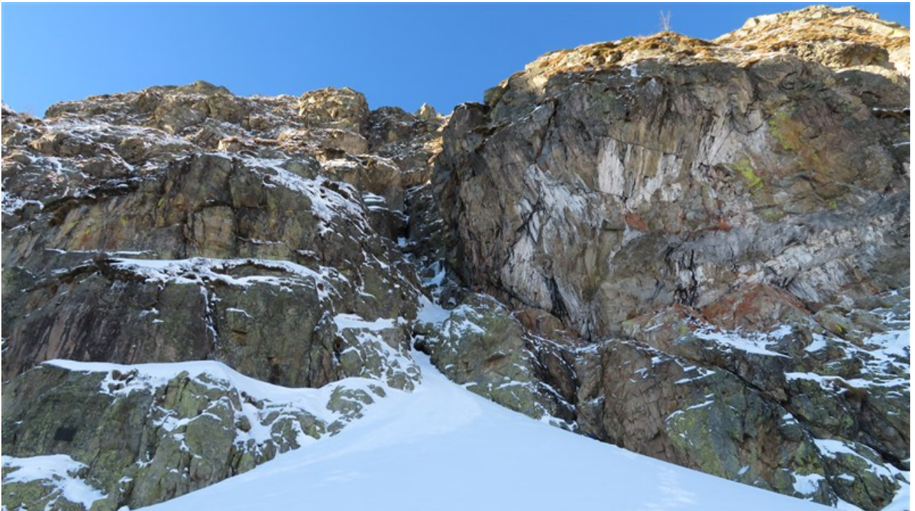
Il conoide di neve ed il canale