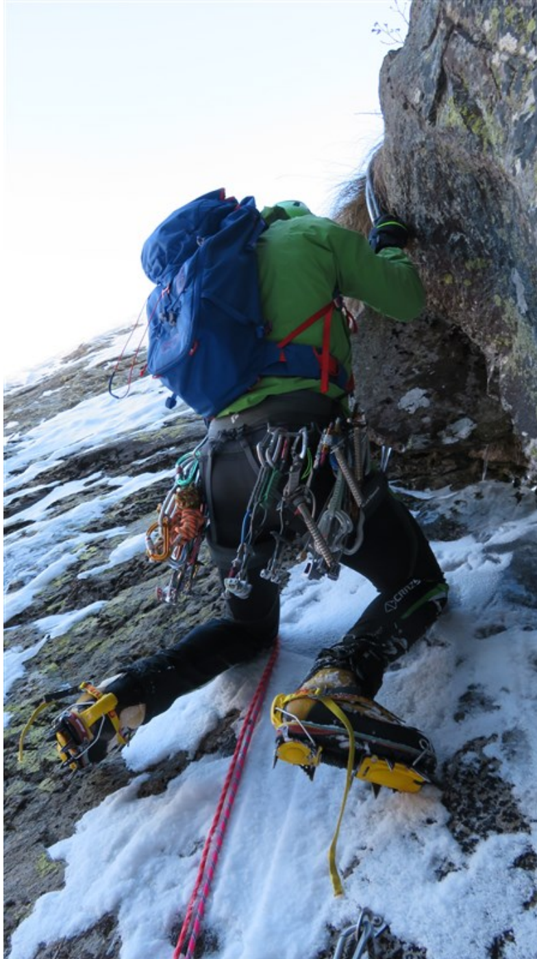
Partenza terza lunghezza