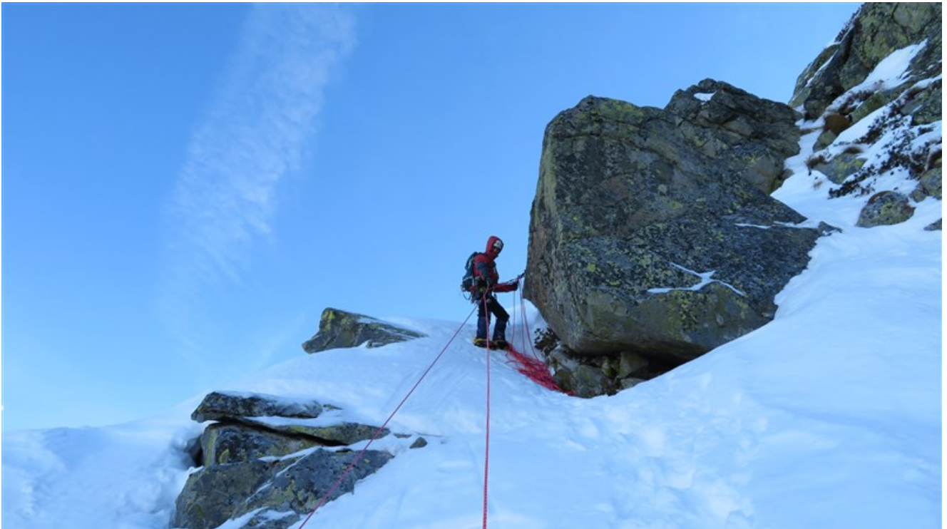
Sosta settima lunghezza