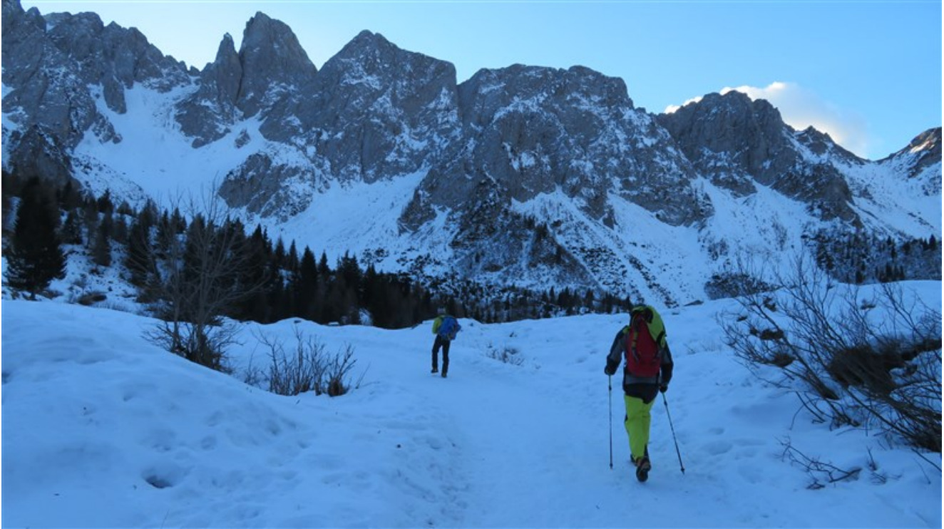
Avvicinamento: la Cima di Crap è in centro