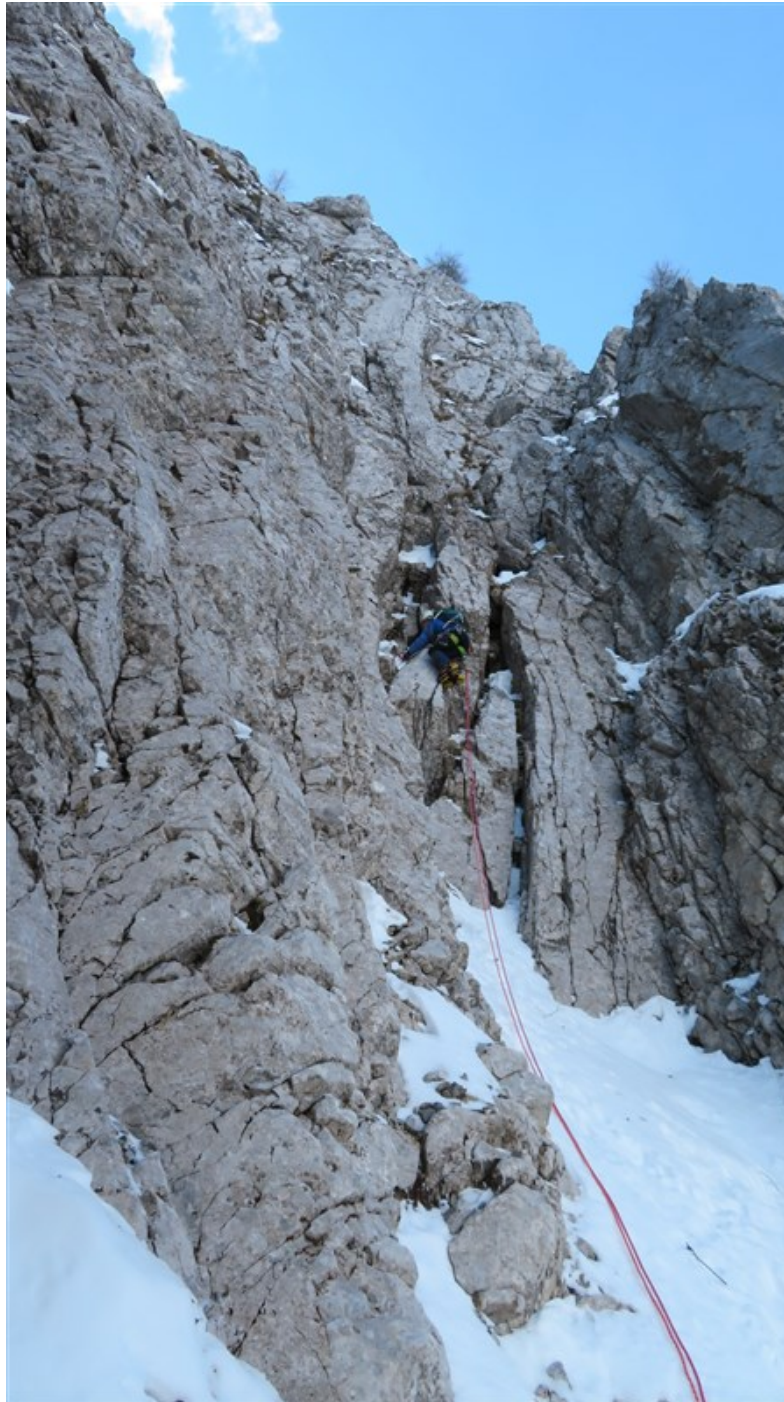
Inizio prima lunghezza