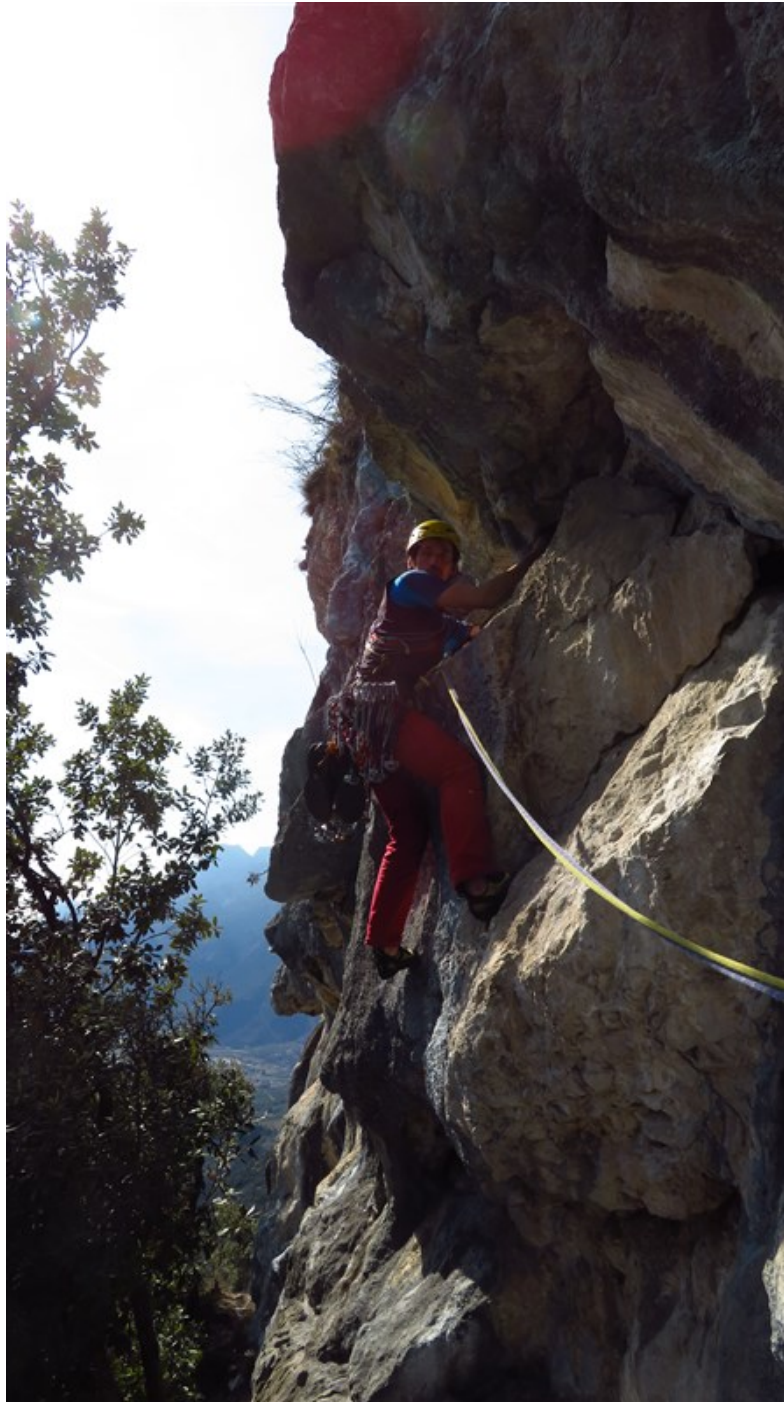
Partenza nona lunghezza