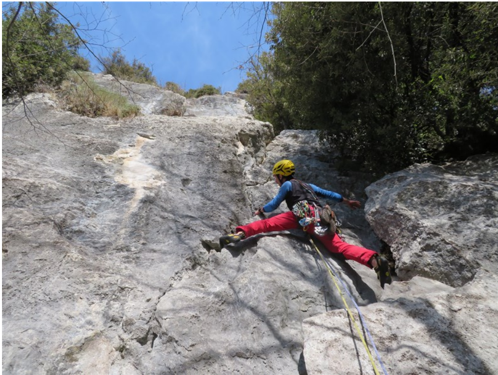
Inizio prima lunghezza