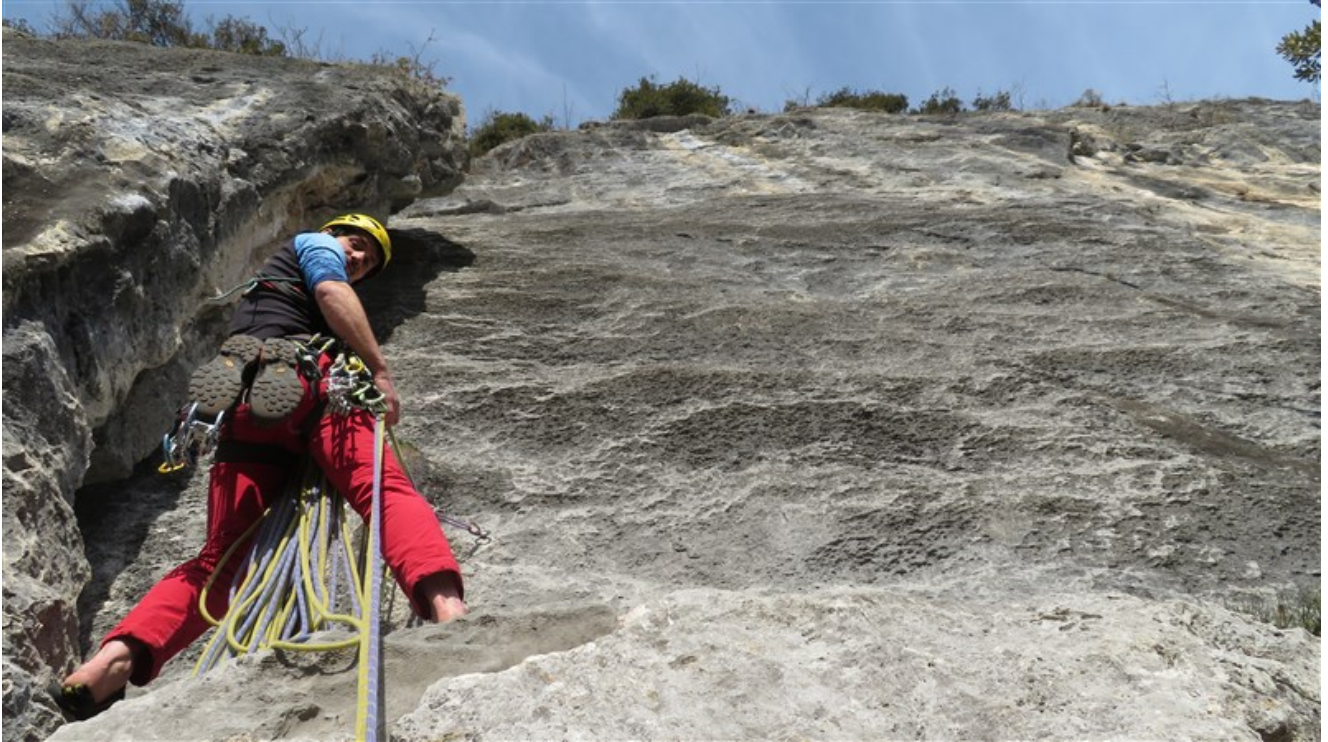
Sosta alla base della seconda lunghezza