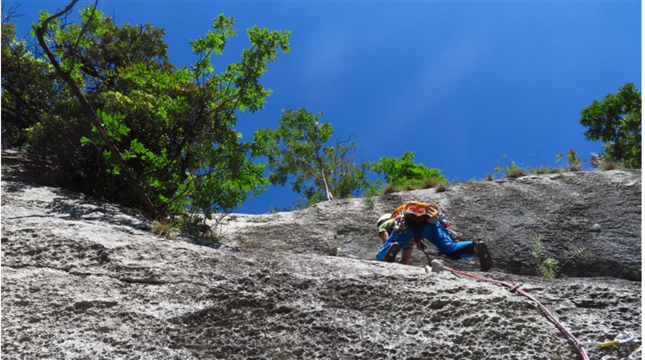
Inizio sesta lunghezza