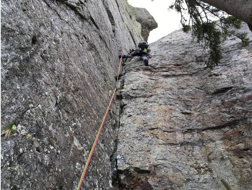
Lunghezza del diedro