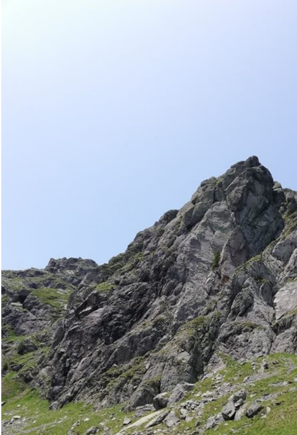
Cima Piazzotti dal sentiero