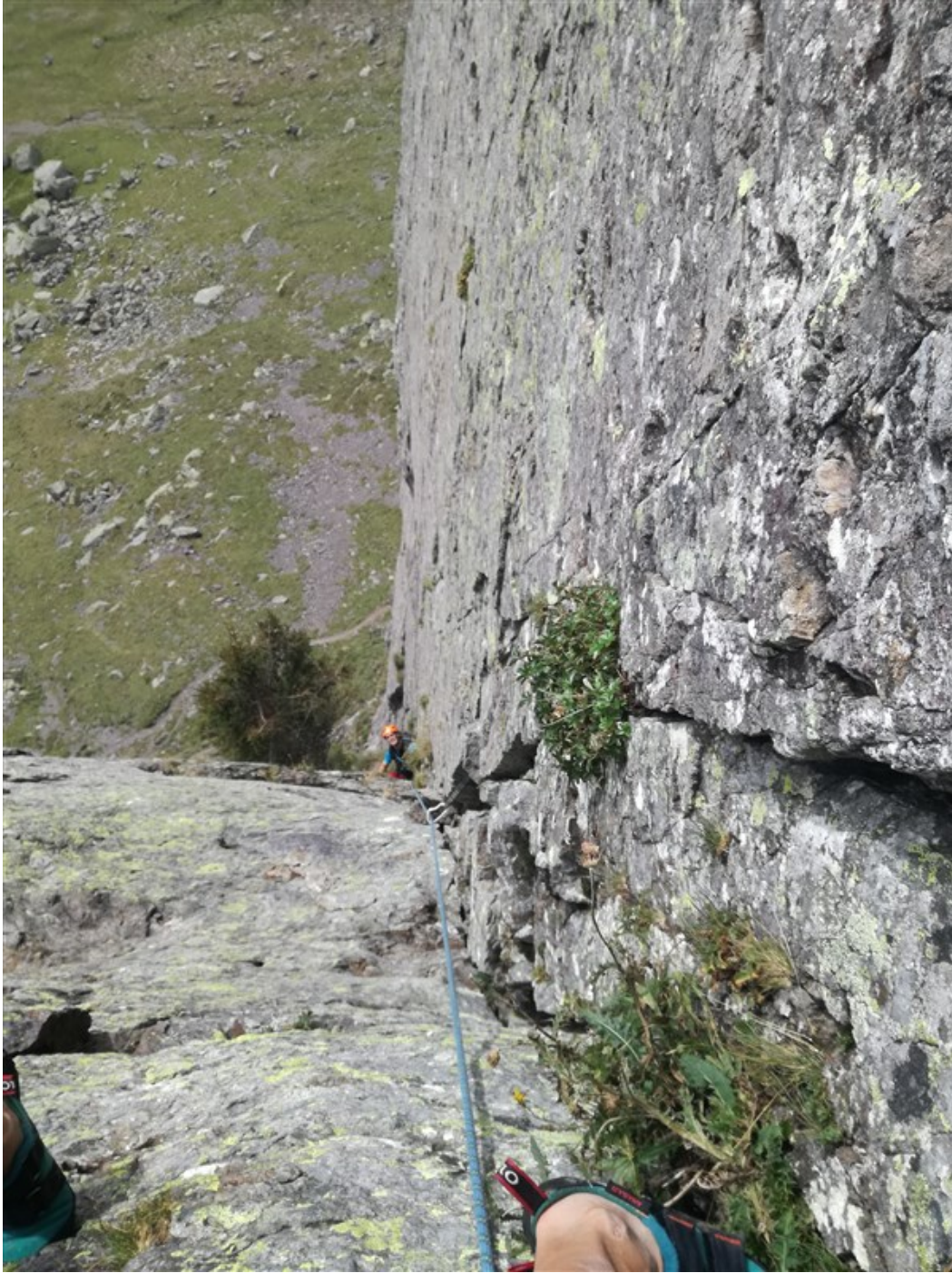
Il diedro visto dall'alto