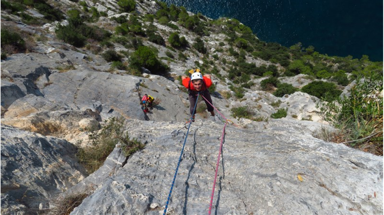
Fine quinta lunghezza