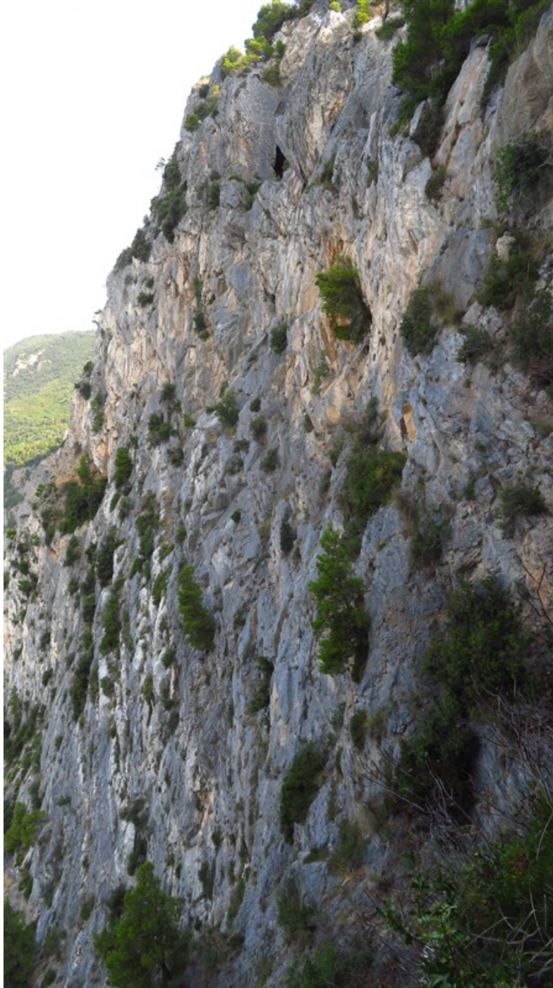
La Parete Striata vista dal sentiero di avvicinamento