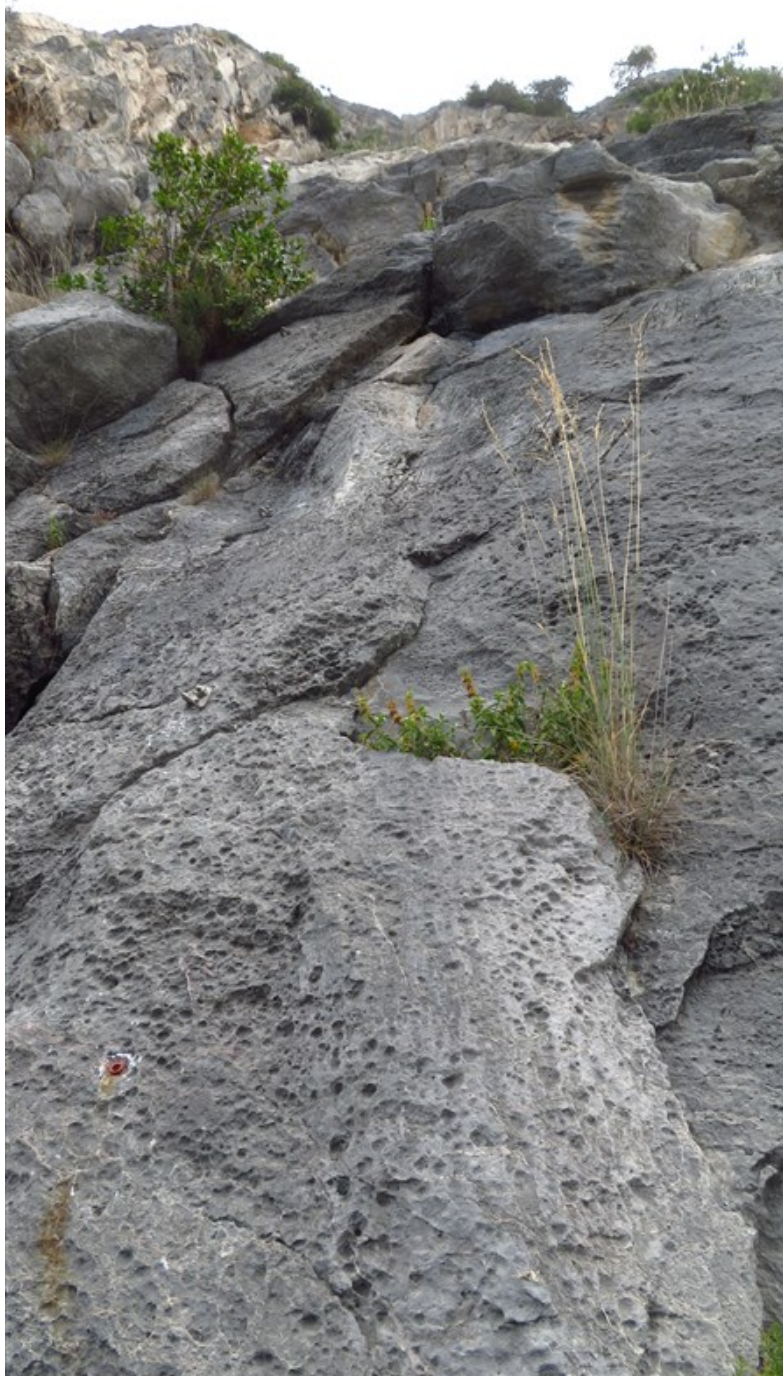
Partenza terza lunghezza