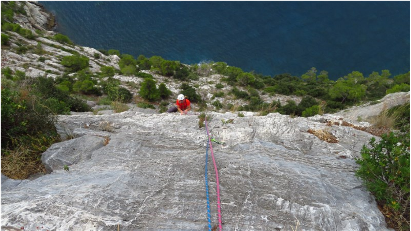
Fine terza lunghezza