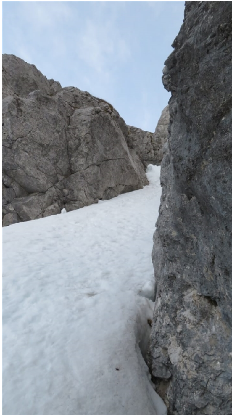
Base del primo canalino