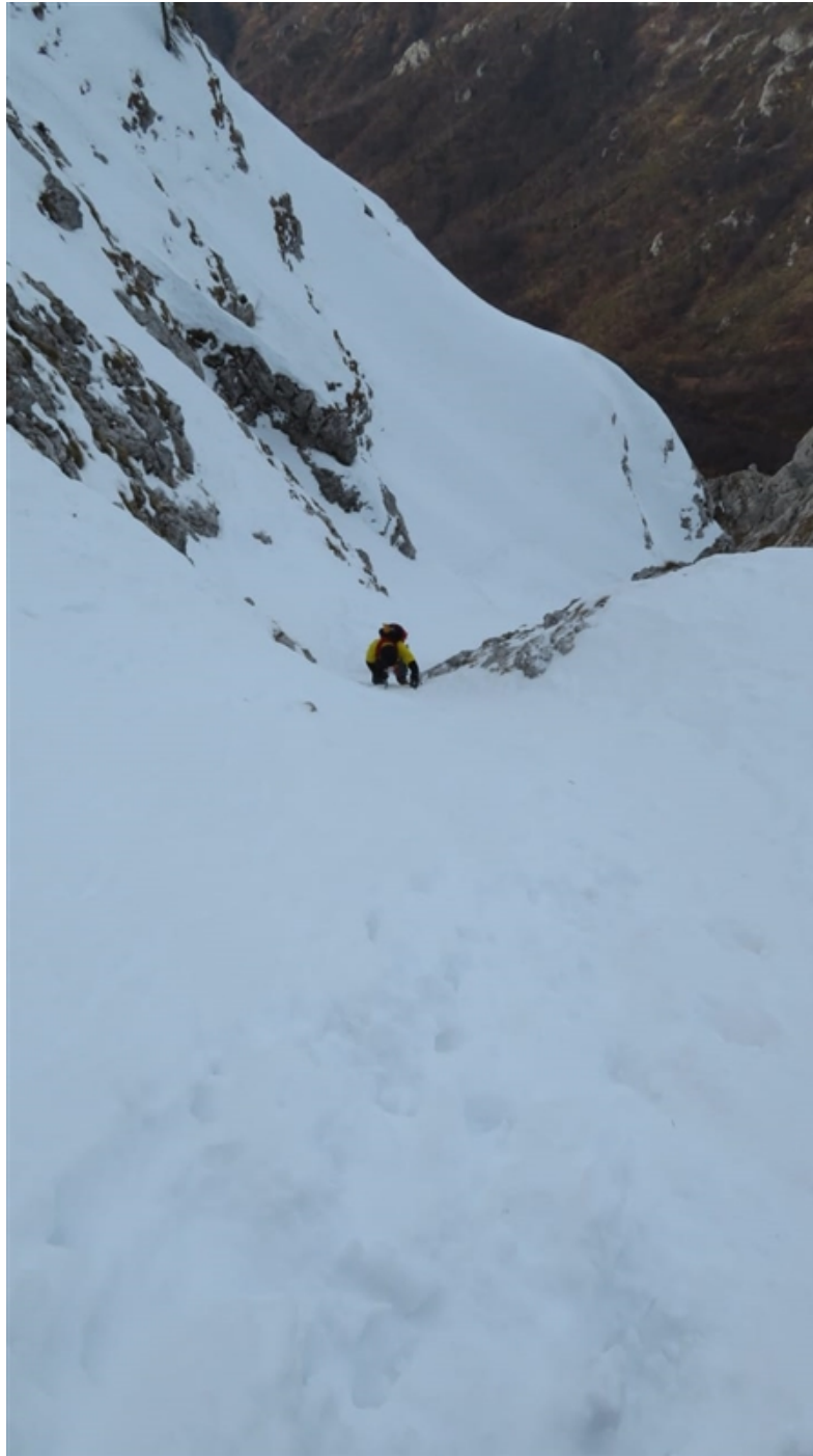
Giorgio in uscita dal tratto da 70°