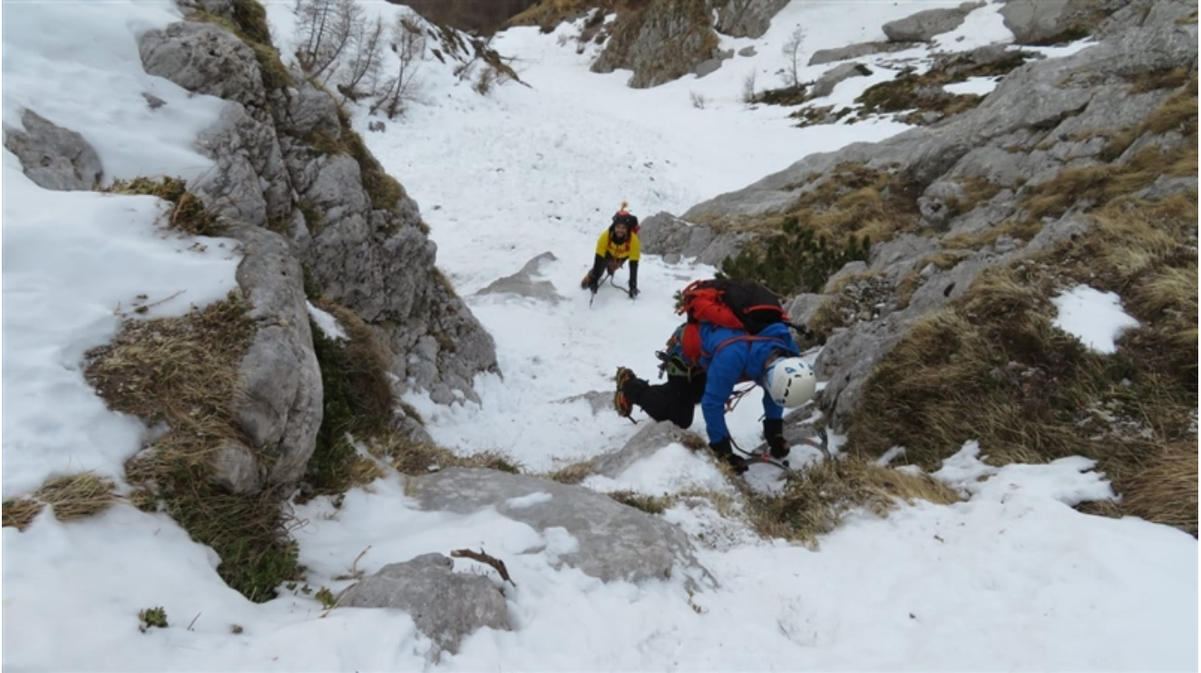
Tratto di misto