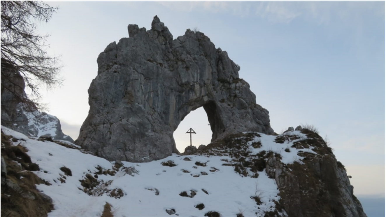
Avvicinamento alla bocchetta di Prada