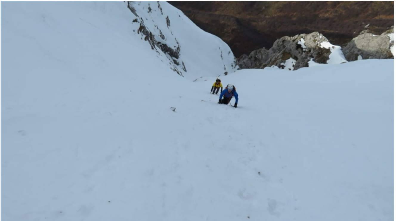
Attacco primo tratto da 70°