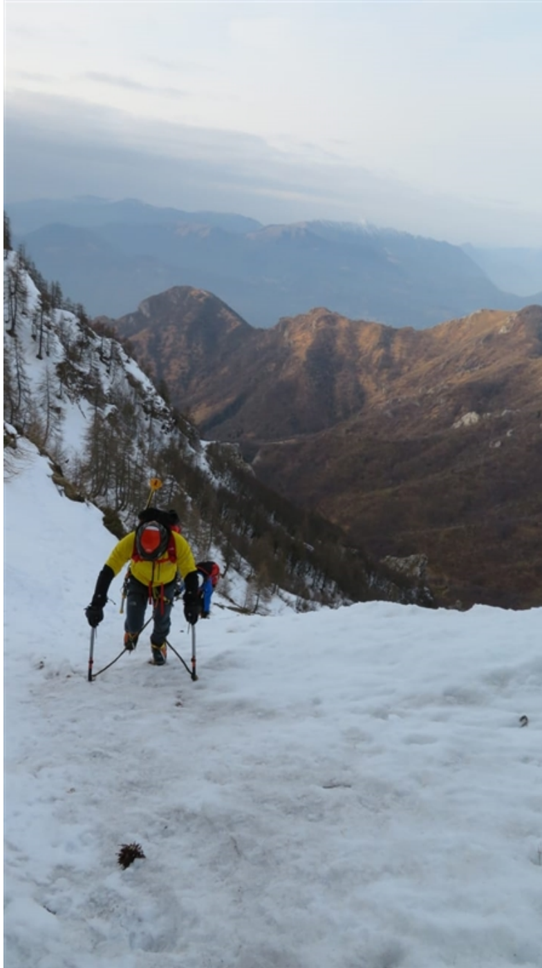
Primi metri su pendio