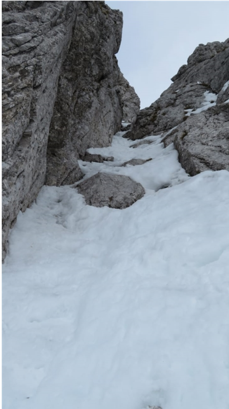
Attacco ultimo canale (neve e ghiaccio 70°)