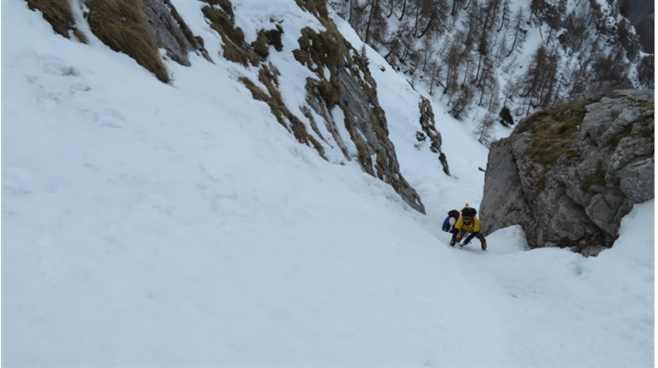
Primo canale (neve 60°)