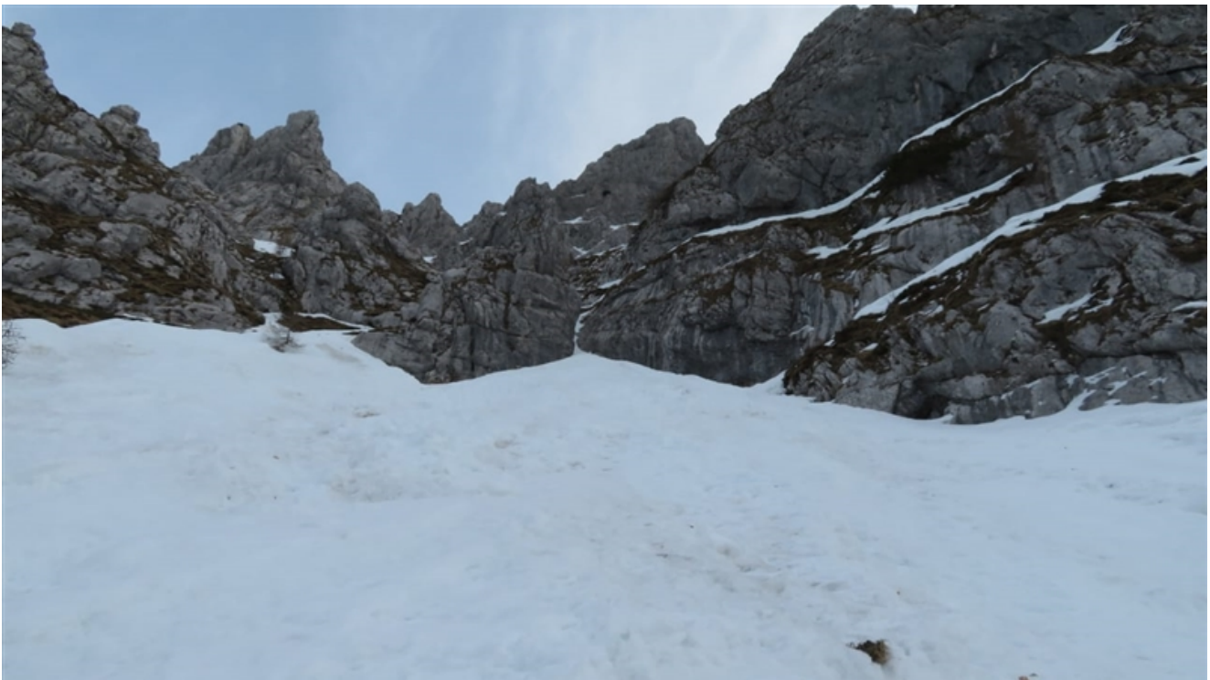
Attacco della via