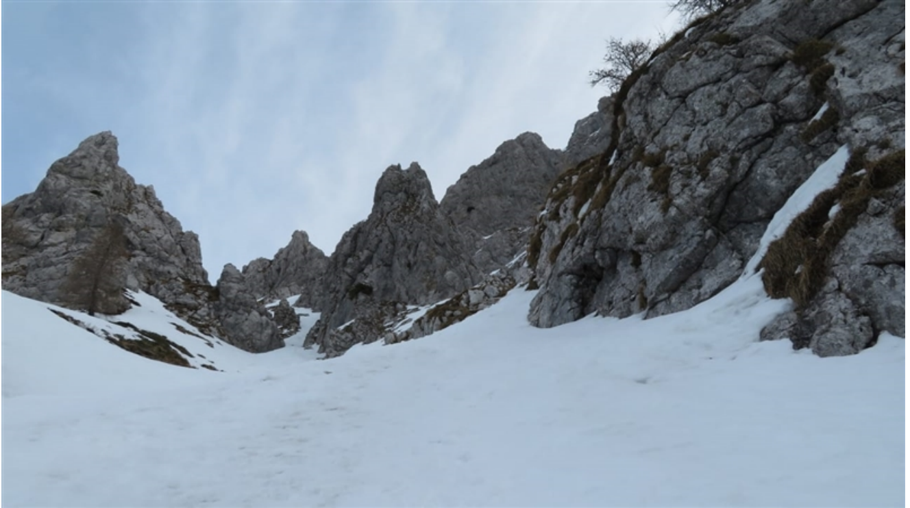
Uscita dal primo canale (neve 50°-55°)