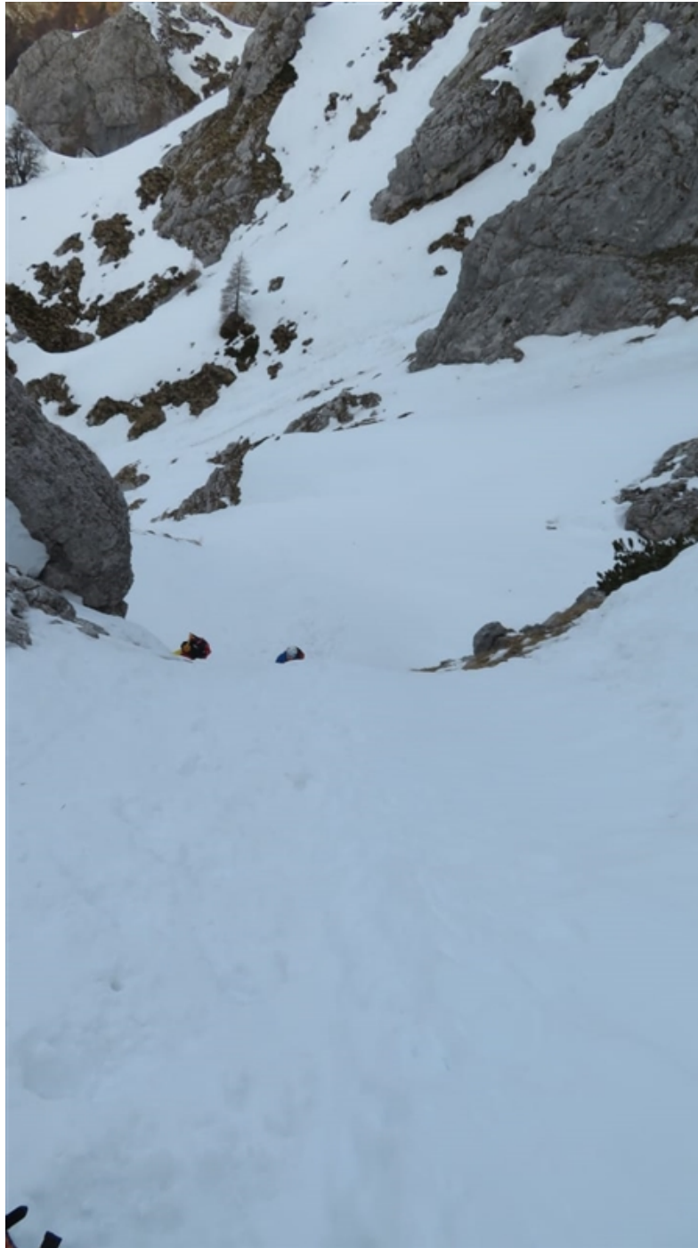
Nel primo tratto ripido da 70°