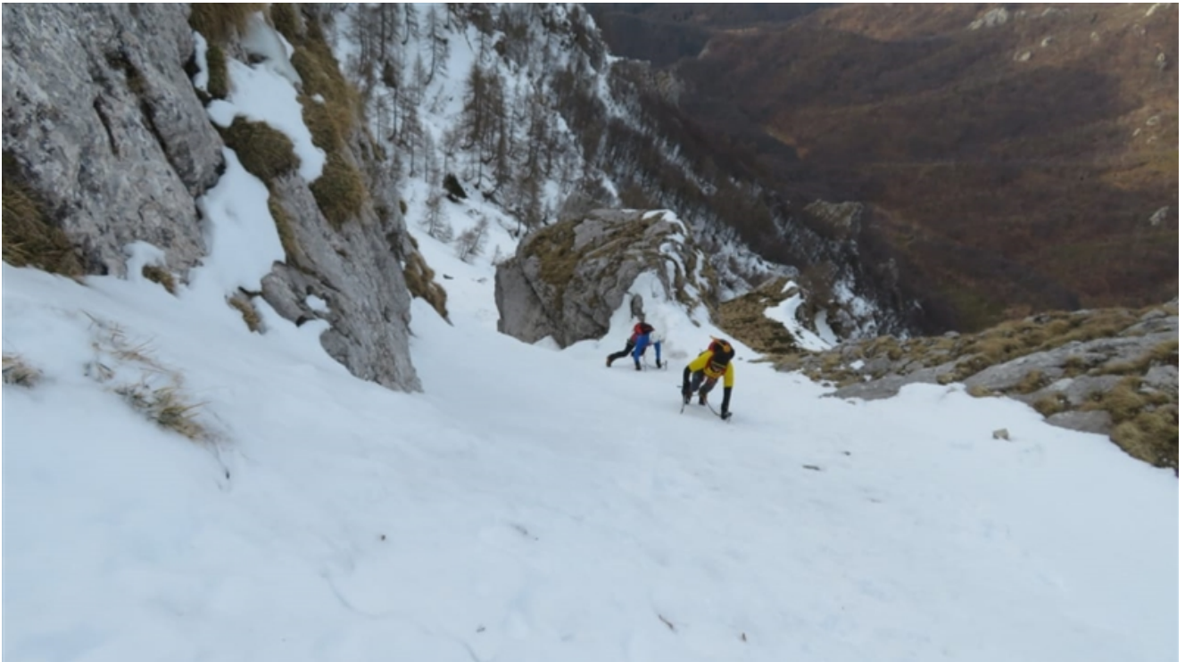
Uscita dal primo canale (neve 60°)