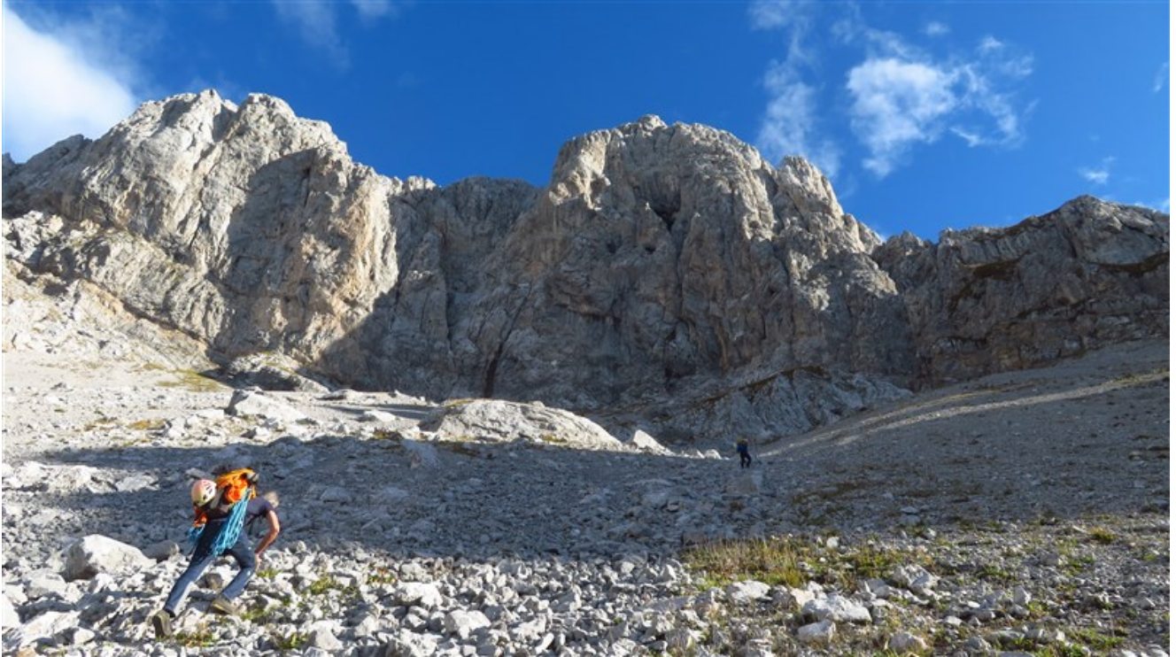
Avvicinamento alla parete