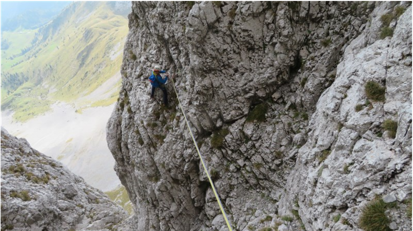
Traverso terza doppia