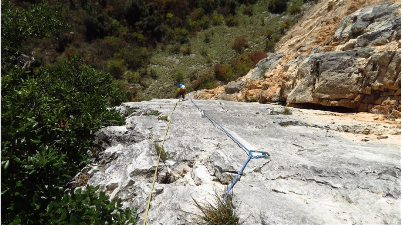
Il muro finale della quinta lunghezza