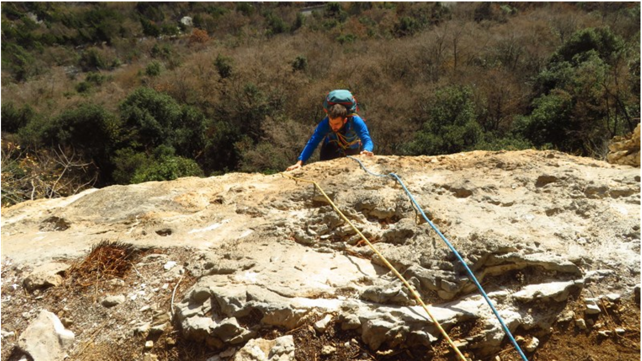
Fine prima lunghezza