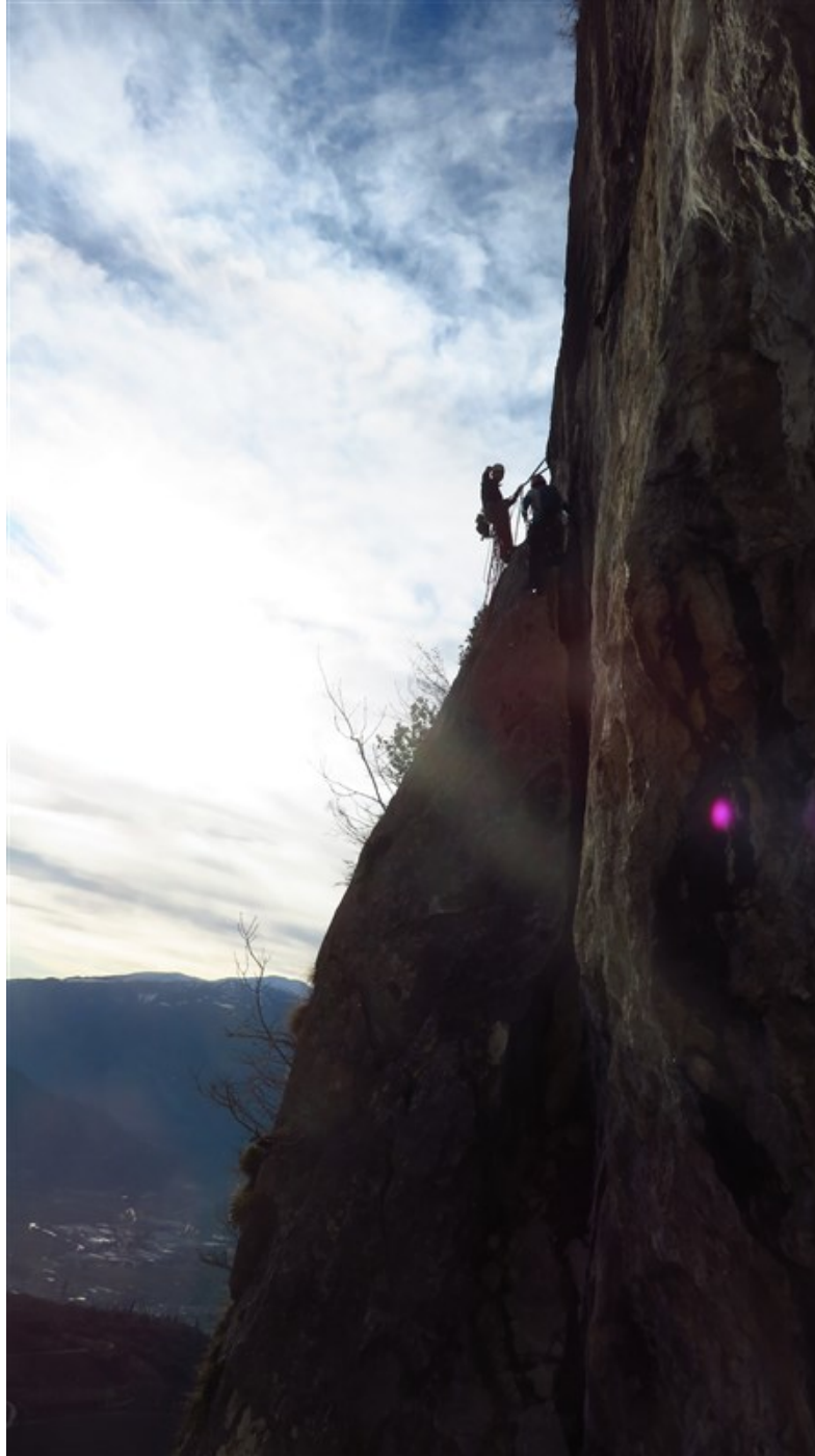
Parte finale terza lunghezza