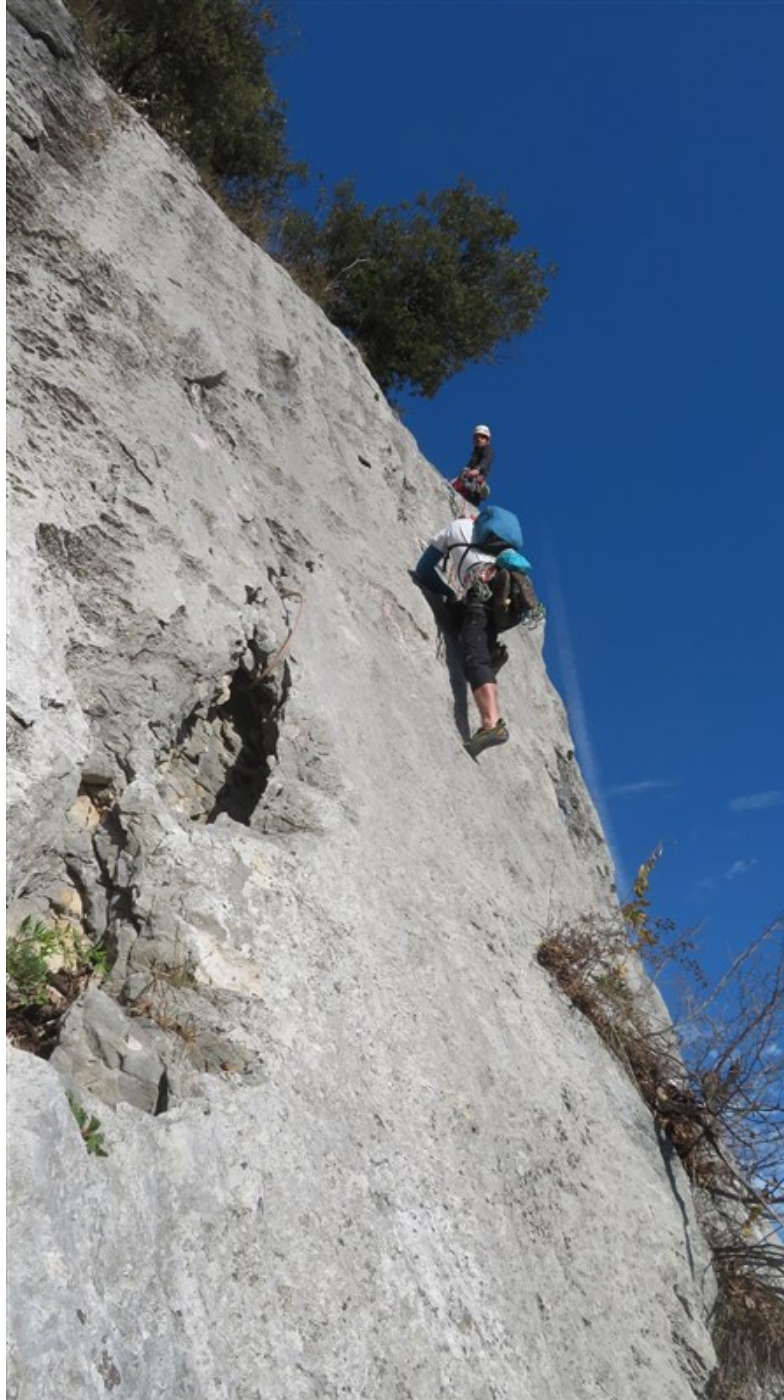
La bella placca finale della quinta lunghezza