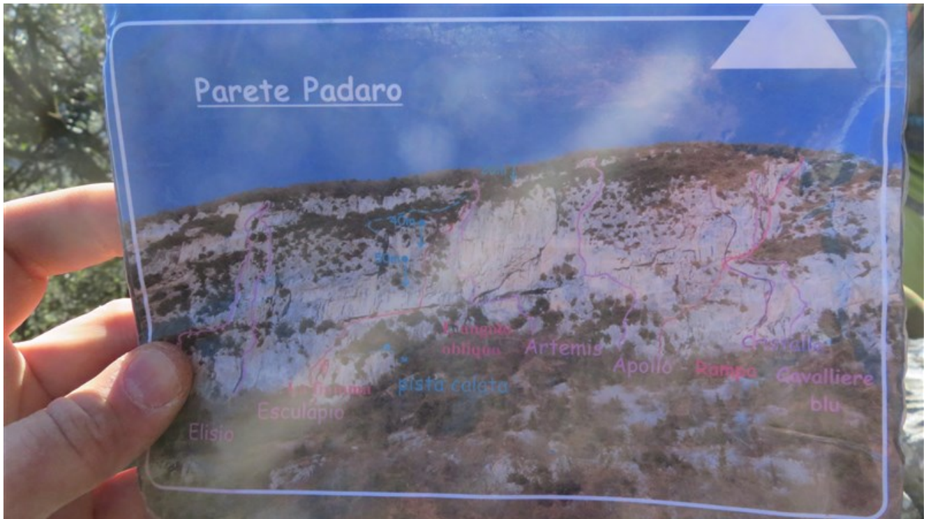
Libro di via