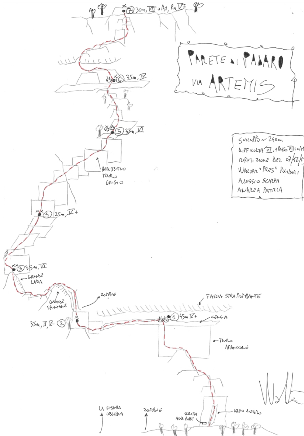
Schizzo della via