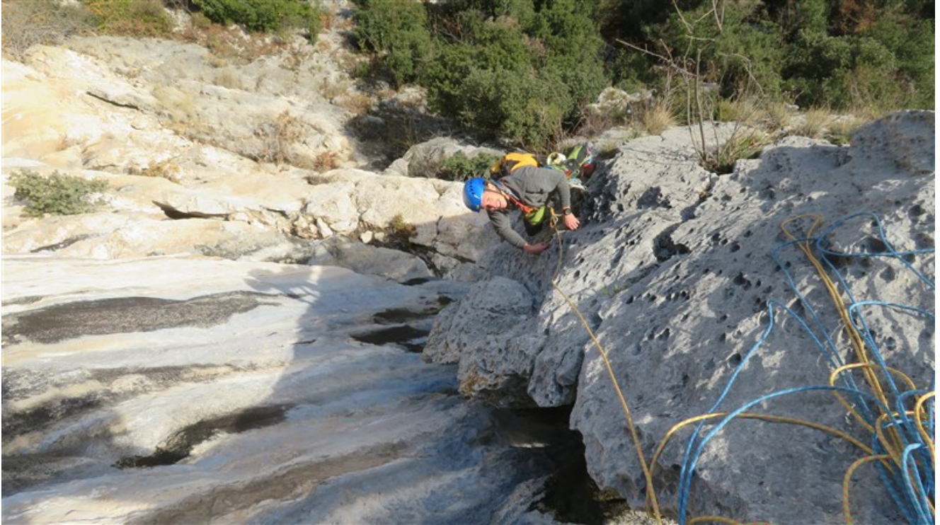
Parte finale terza lunghezza dalla sosta