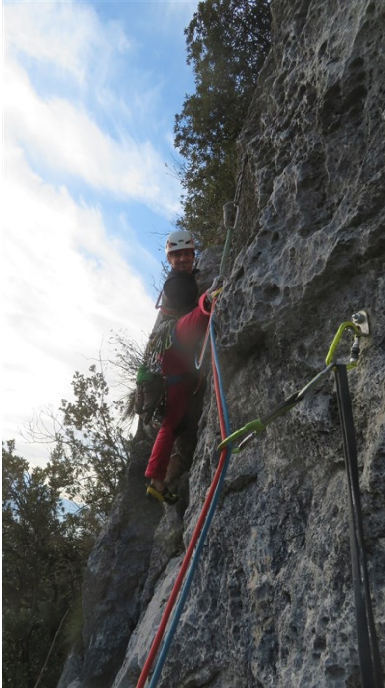
Inizio quarta lunghezza