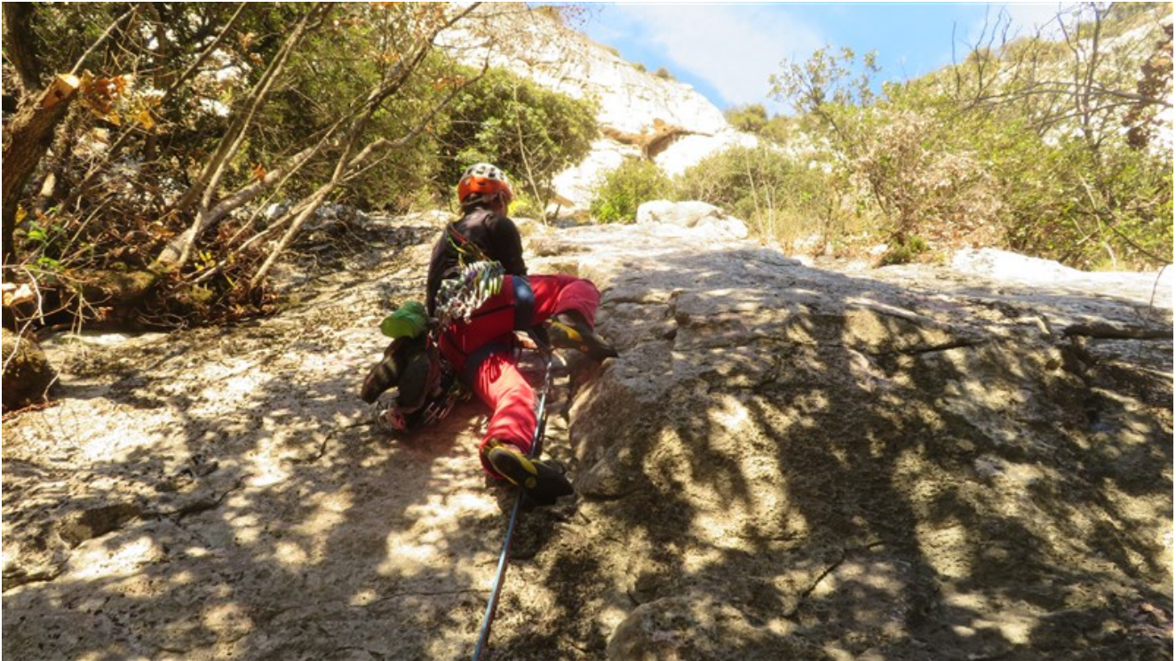
Inizio prima lunghezza