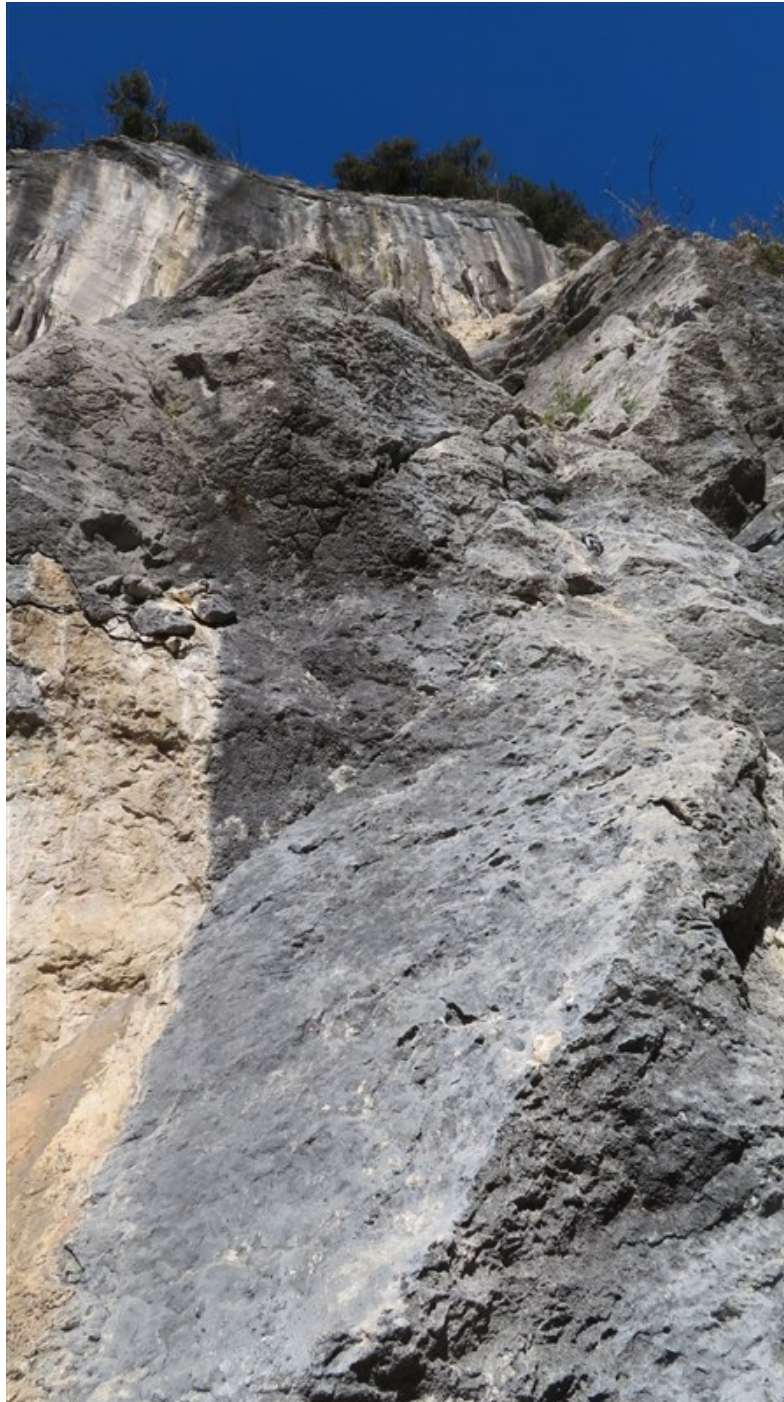
Attacco parte superiore