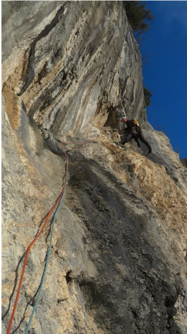
Prima lunghezza, parte superiore