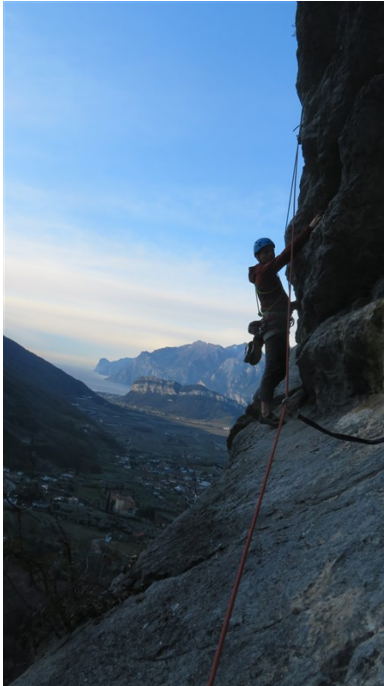
Terza lunghezza, il traverso su cornice