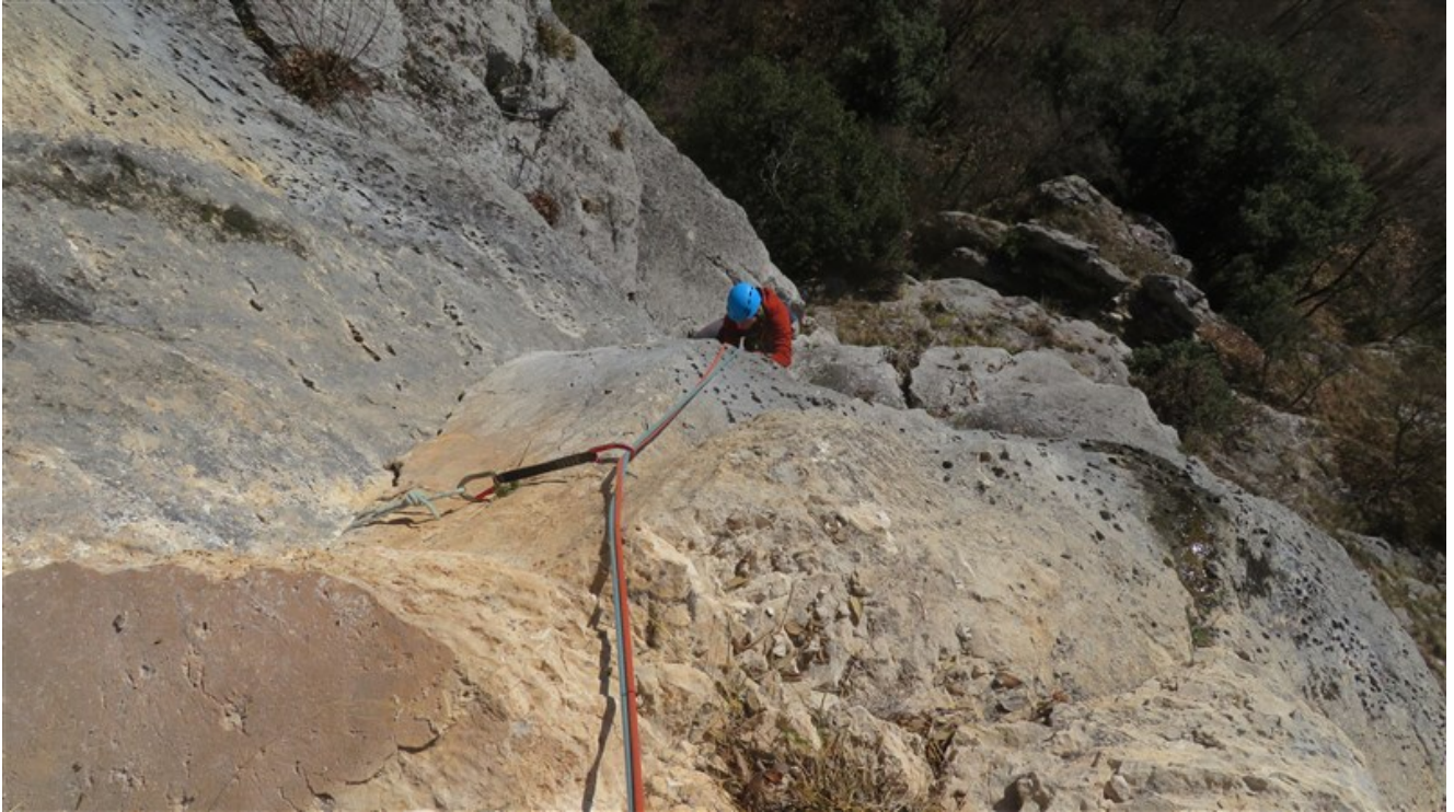
Prima lunghezza, parte superiore