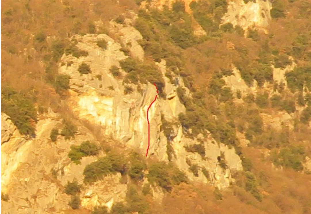
Tracciato indicativo Variante Gufetto superiore