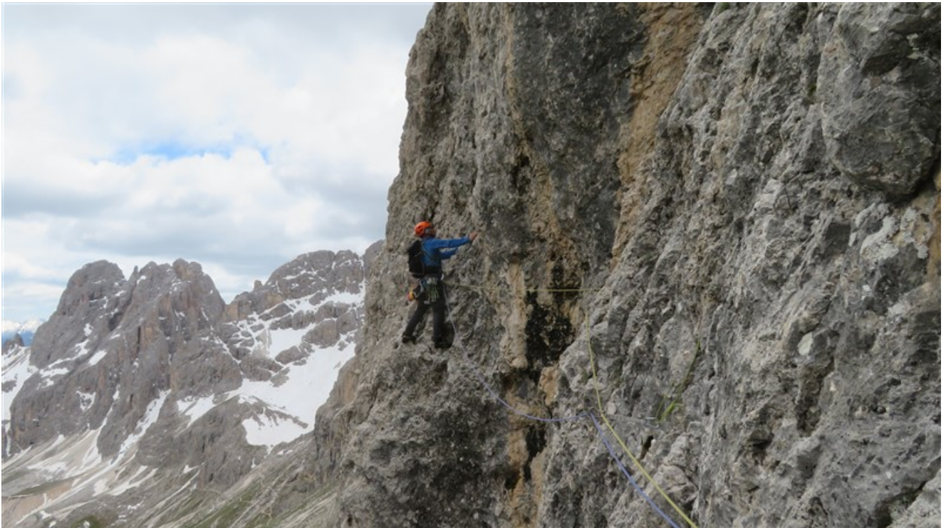
Parte iniziale sesta lunghezza