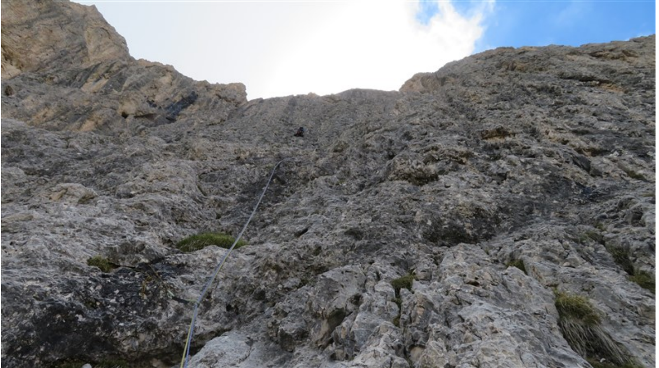
Parte iniziale ottava lunghezza