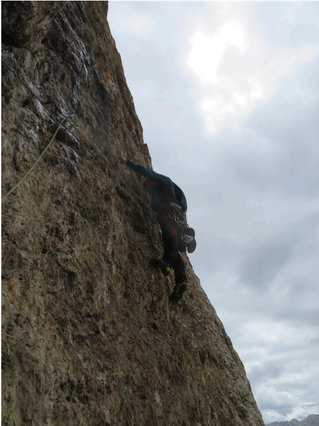
Partenza sesta lunghezza