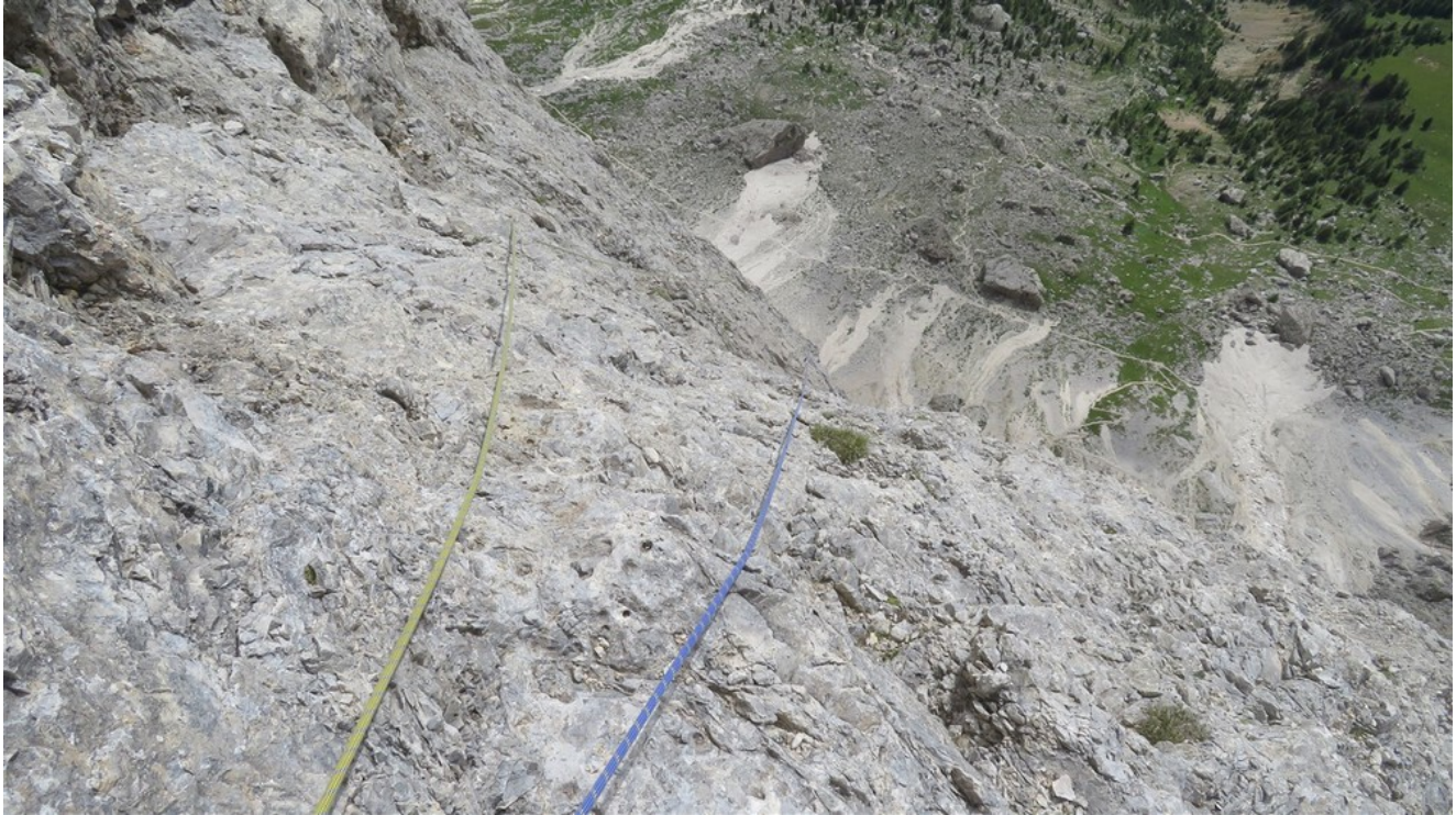
Fine nona lunghezza