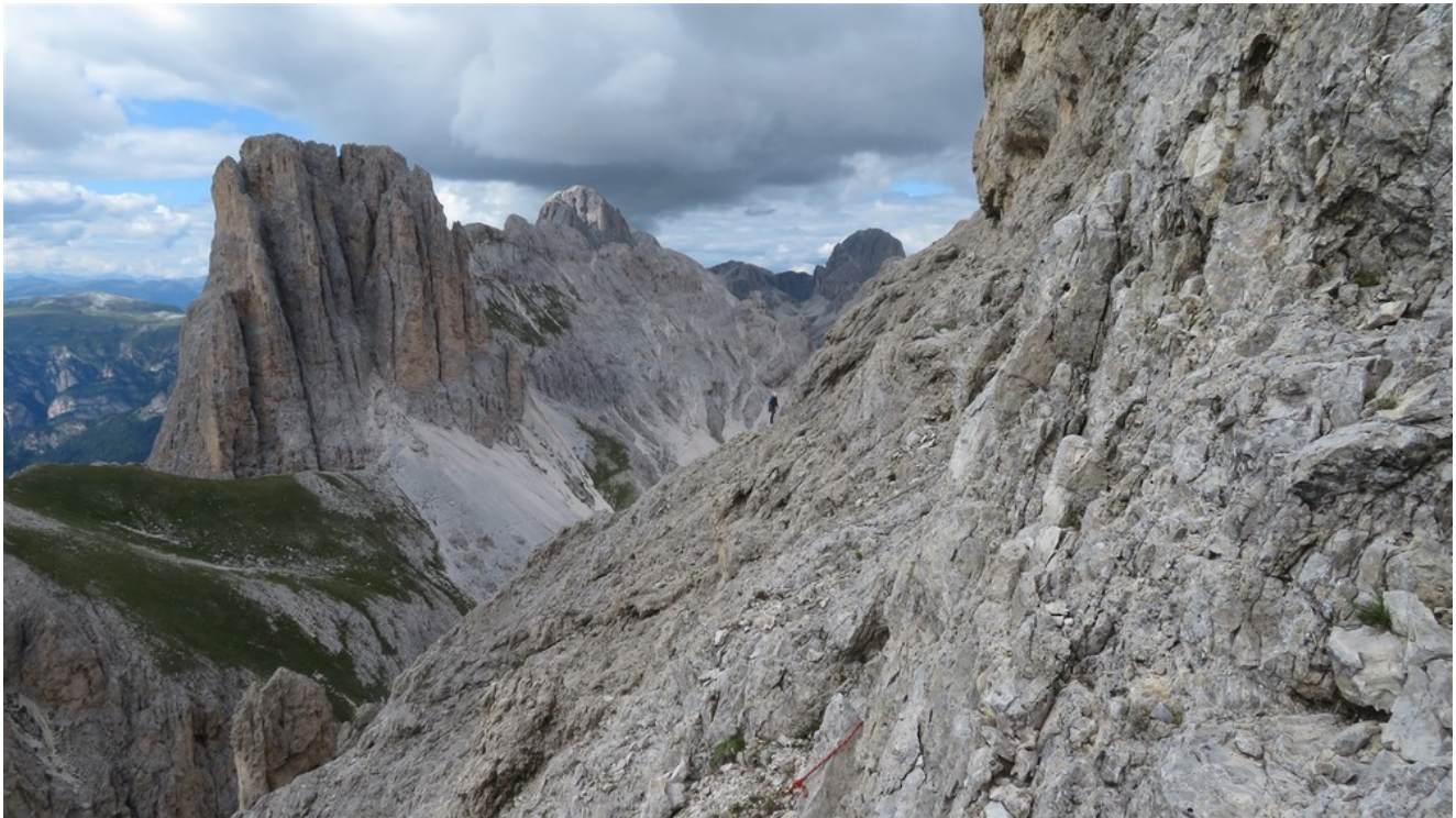
La cengia per raggiungere la Cresta Nord