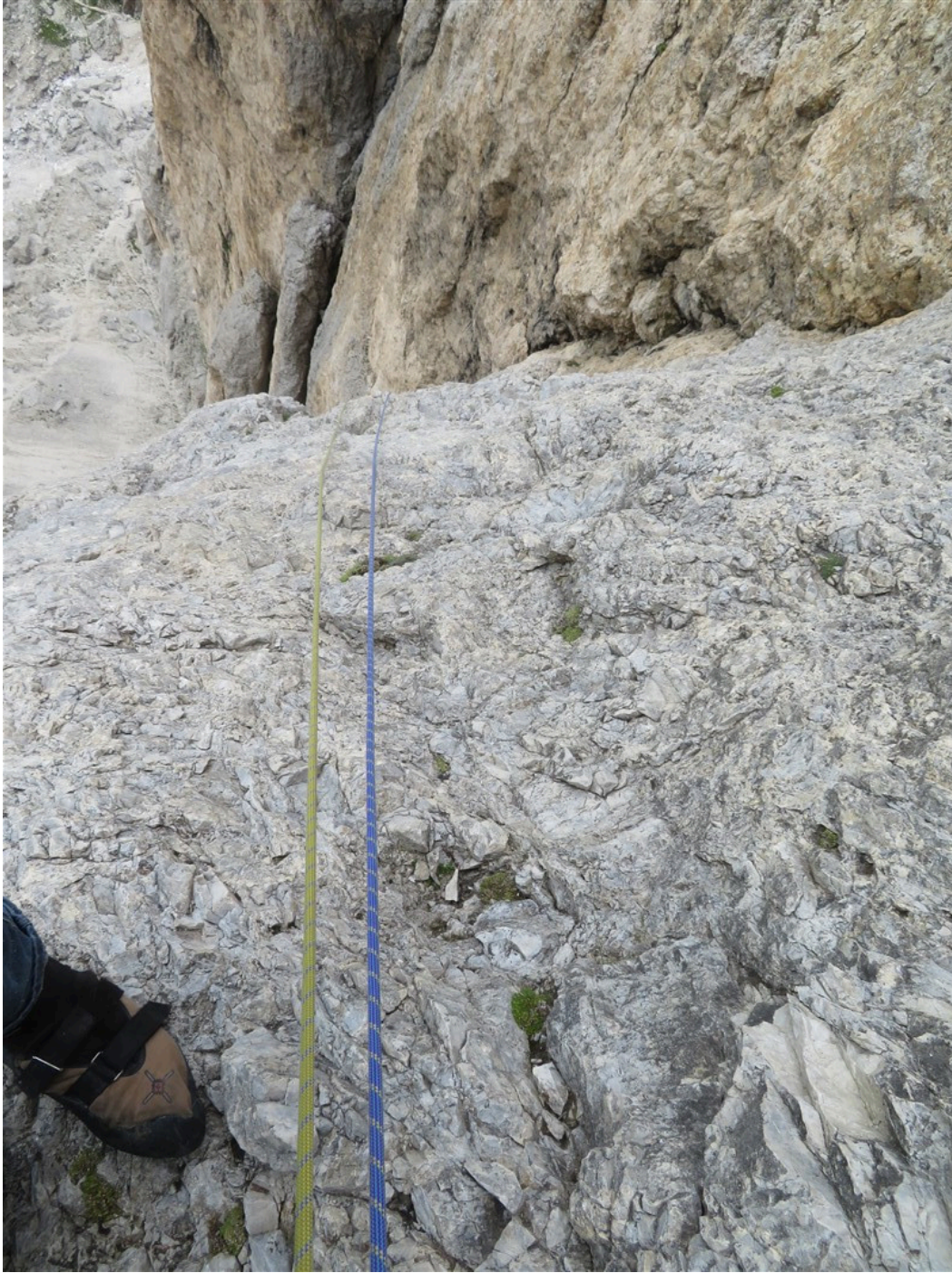
Fine settimana lunghezza