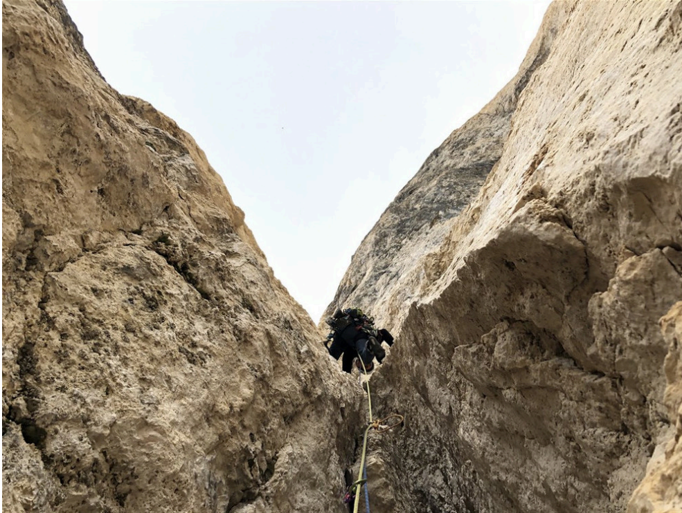
Partenza terza lunghezza