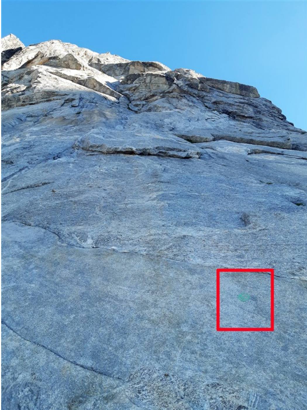
Attacco della via