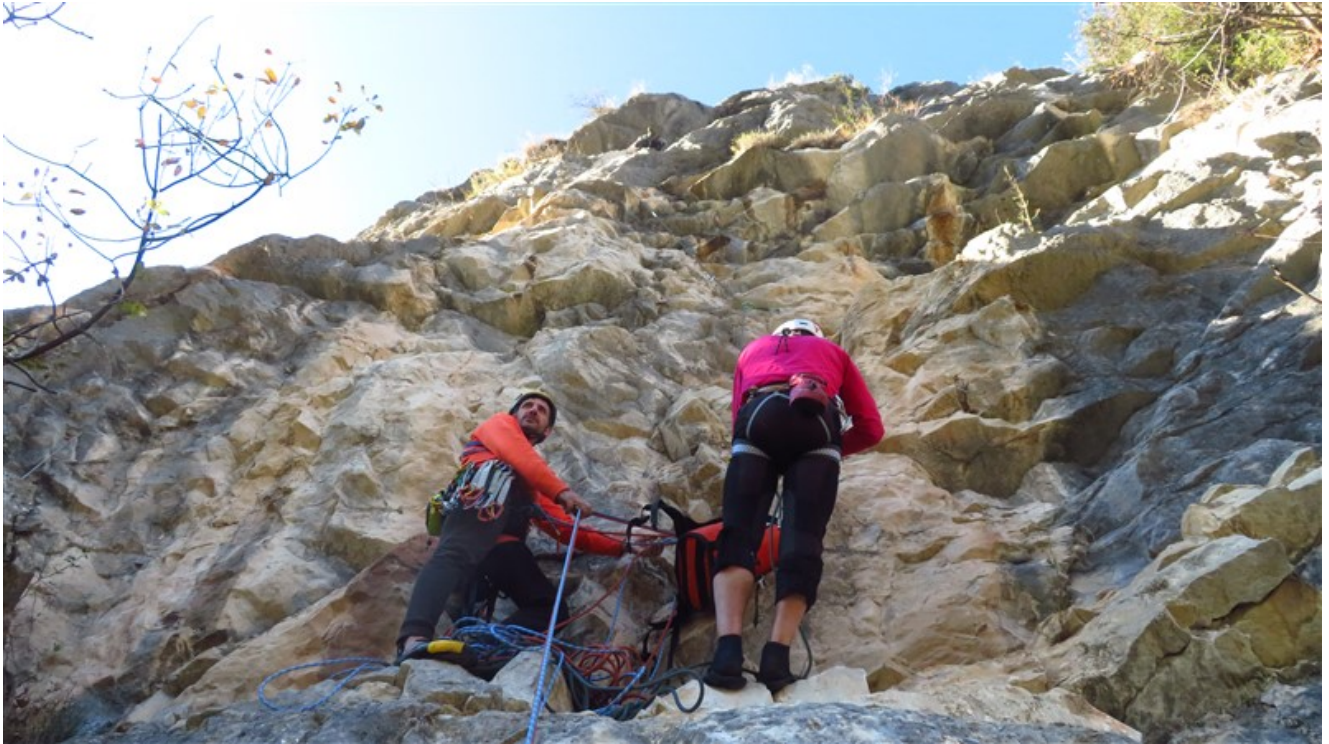
Sosta quarta lunghezza