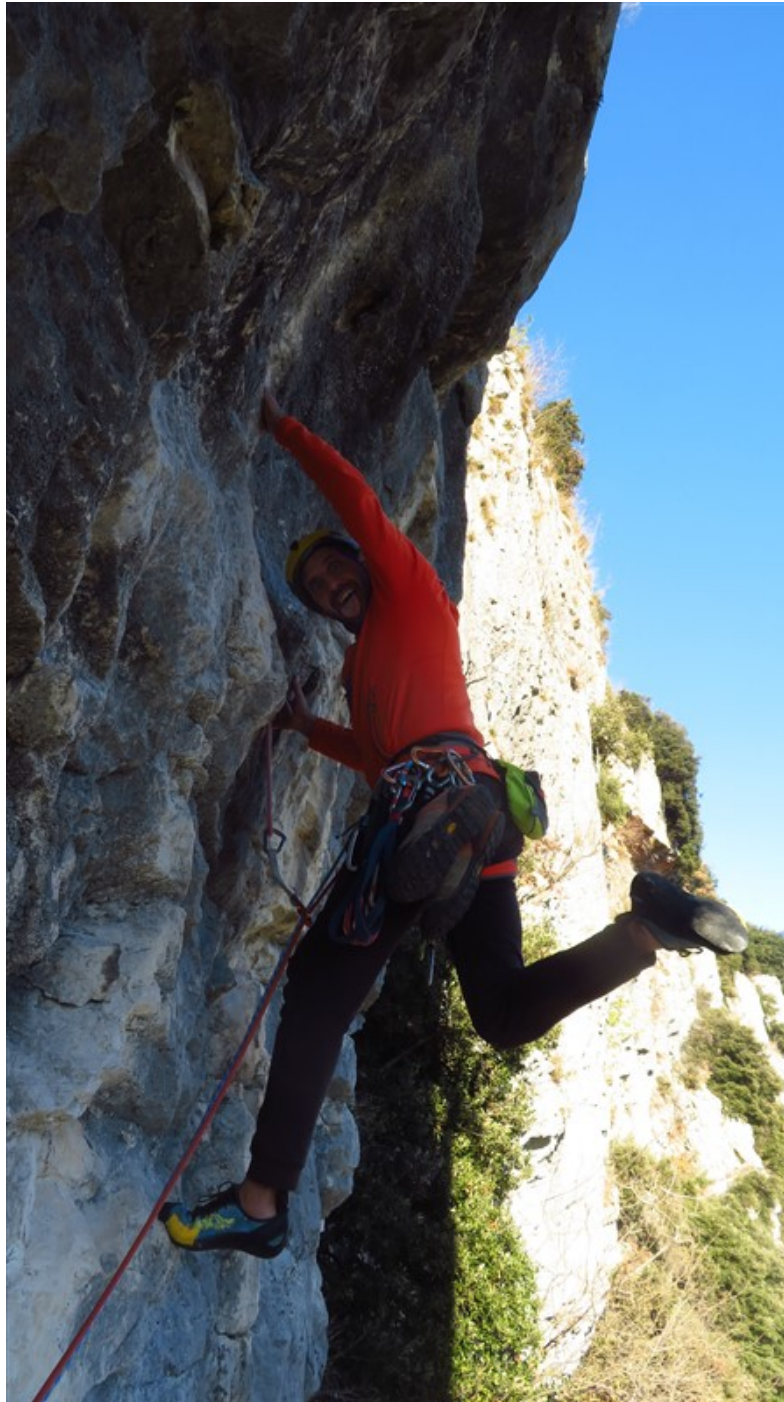
Partenza sesta lunghezza