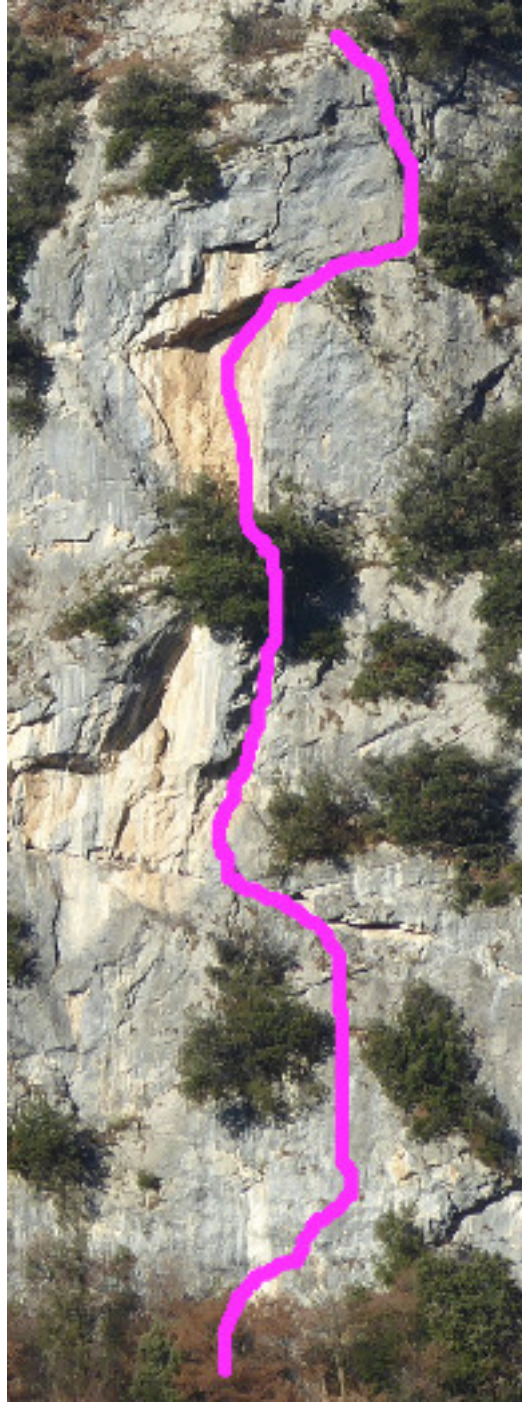
Tracciato indicativo, foto degli apritori