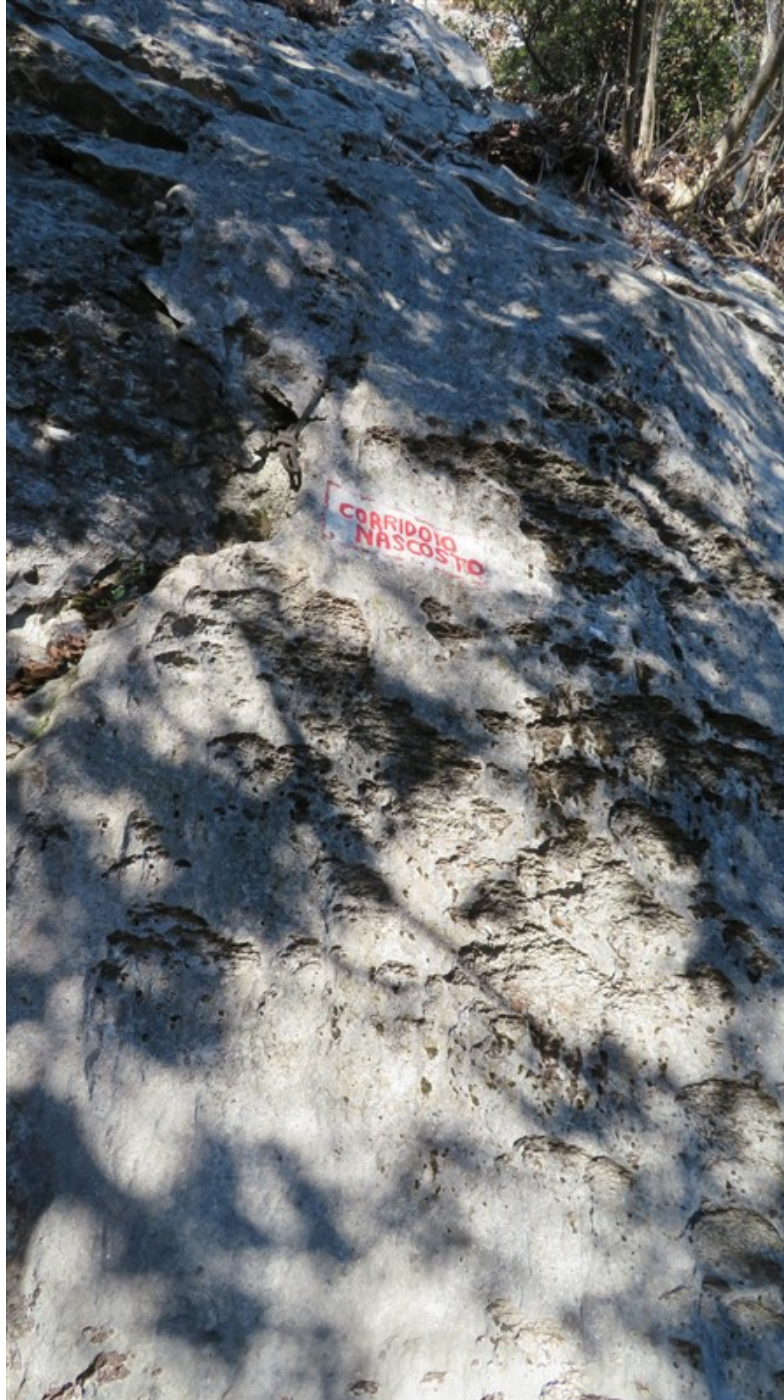
Attacco della via