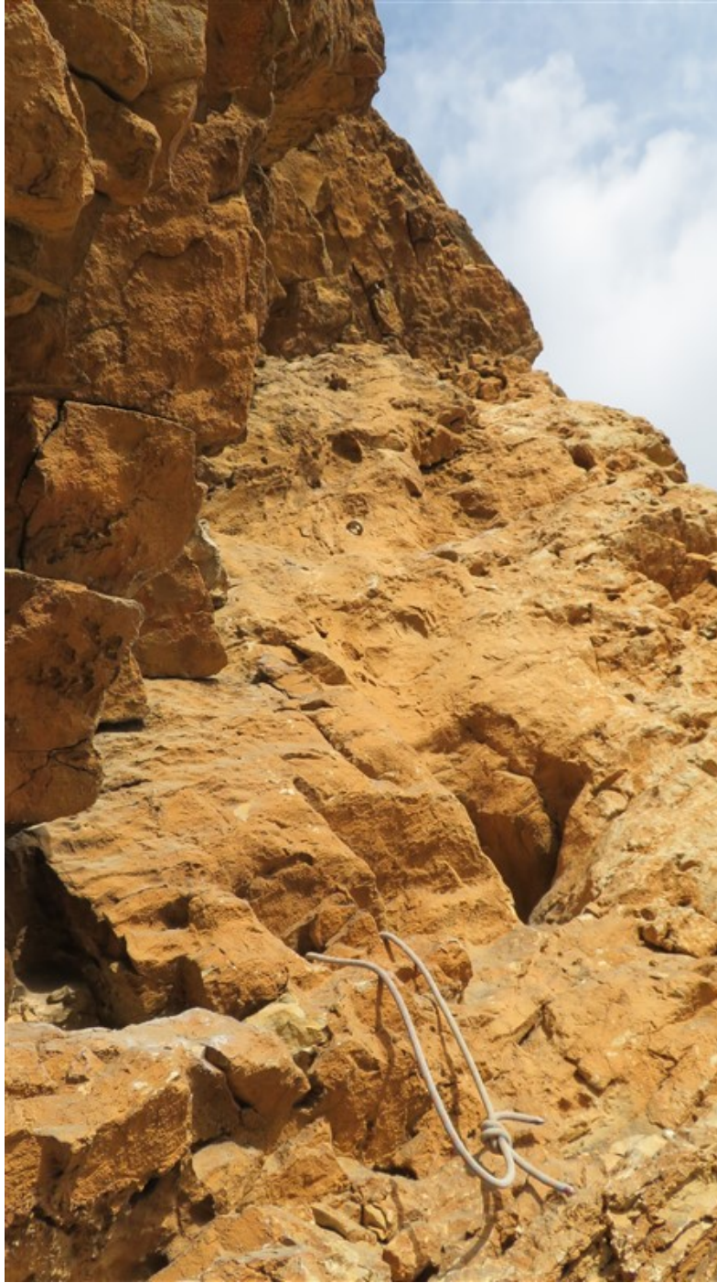
Partenza quinta lunghezza