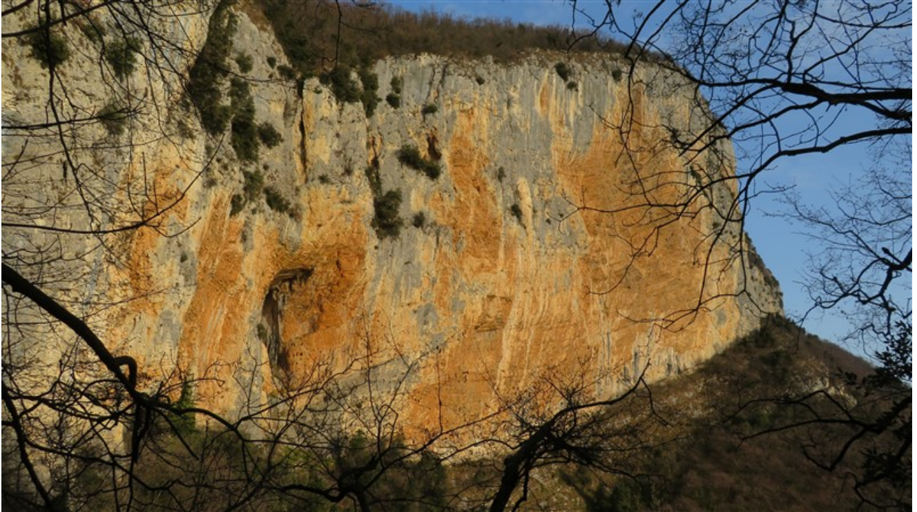
Parete Rossa di Castelpresina