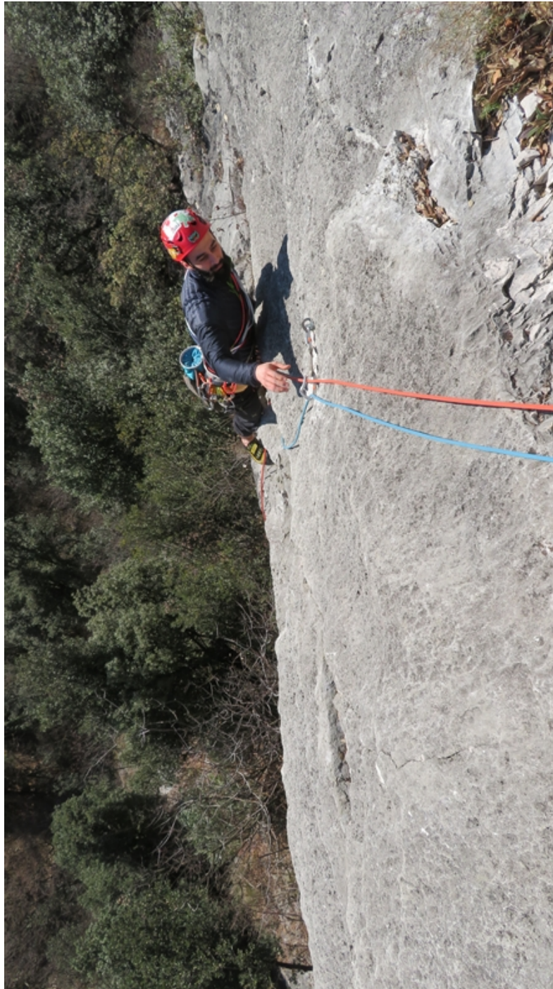
Fine seconda lunghezza