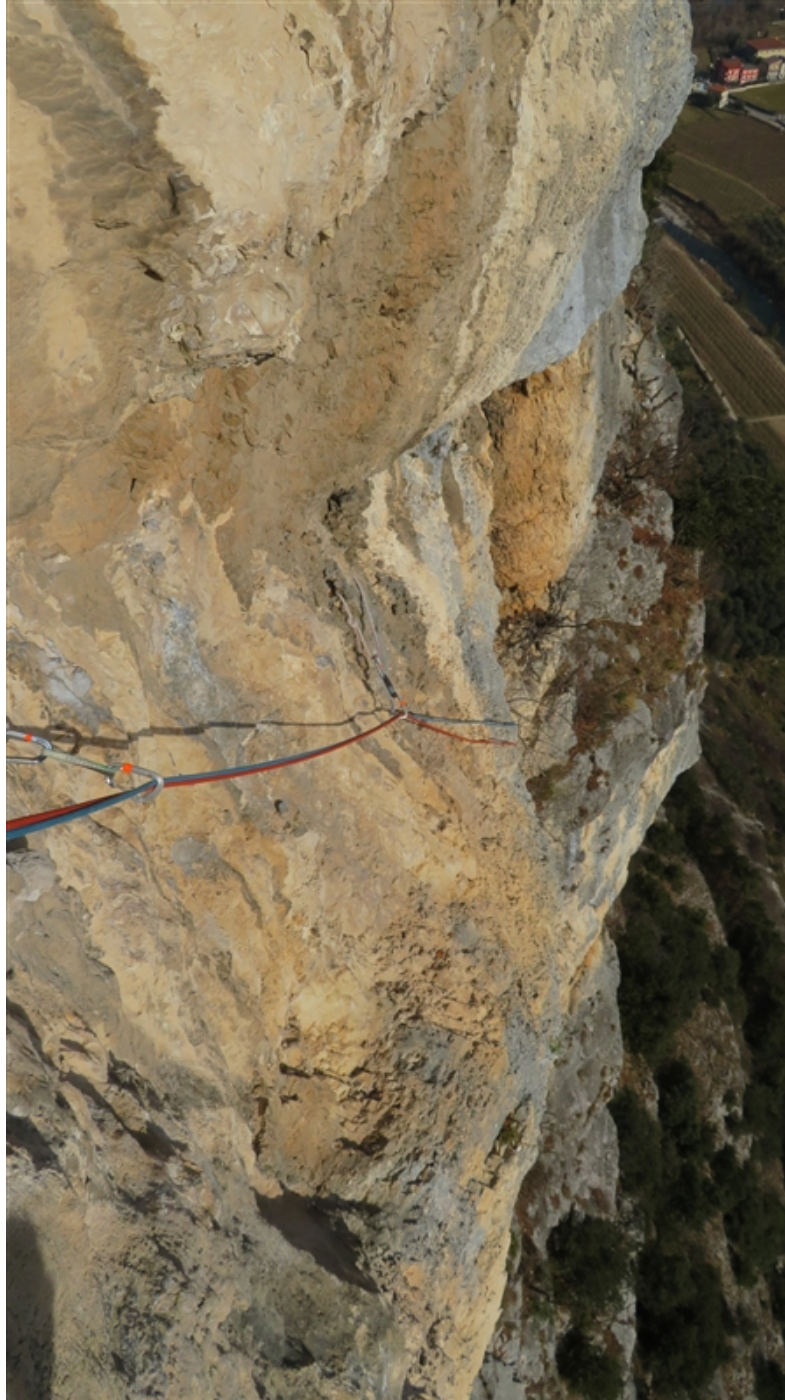
La placca finale dell'ottava lunghezza