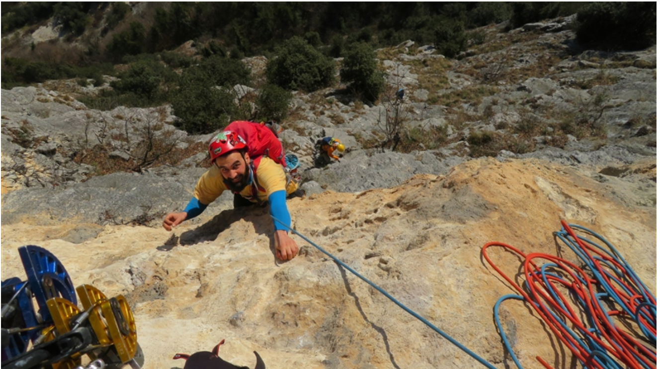
Uscita settima lunghezza