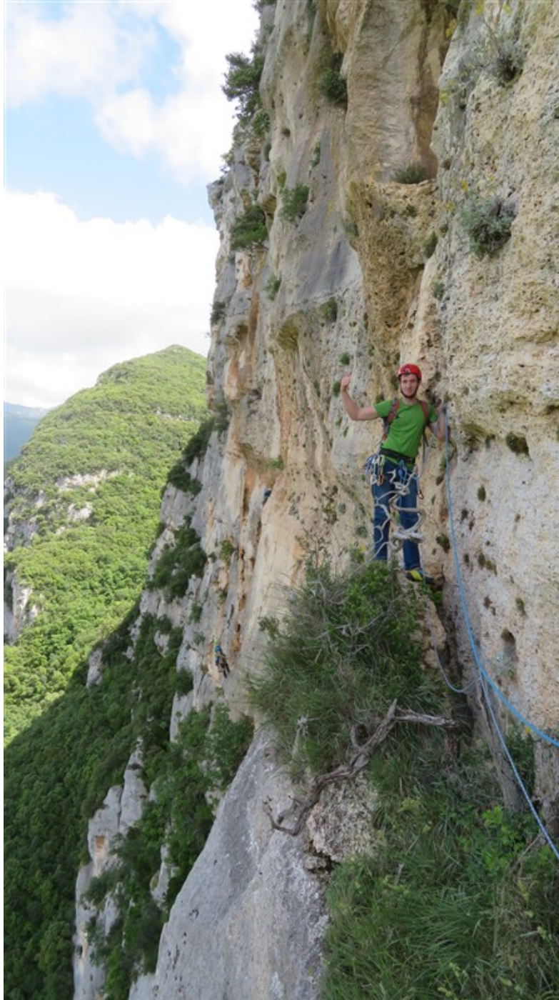
Uscita quinta lunghezza