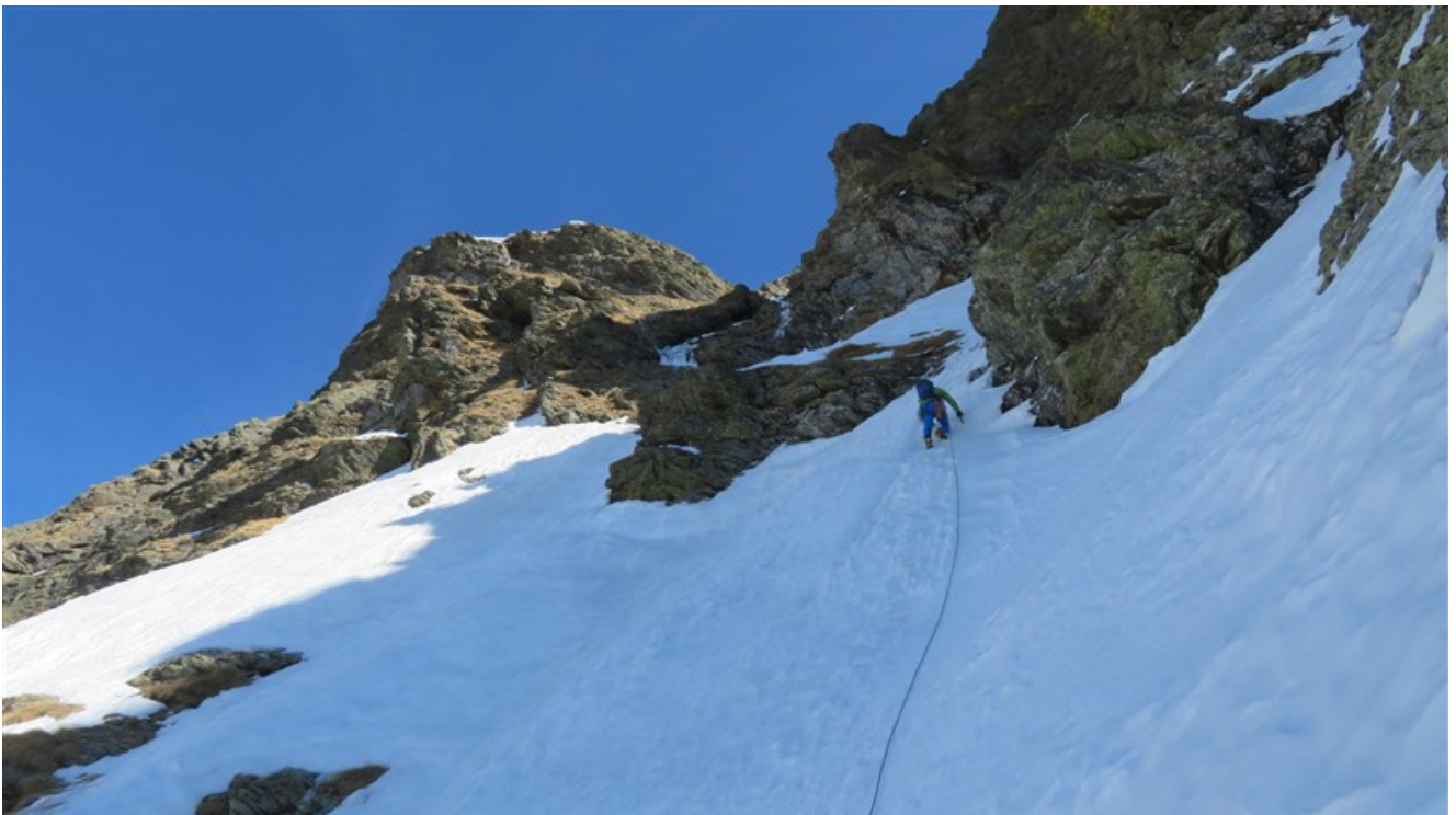
Quasi alla goulottina finale