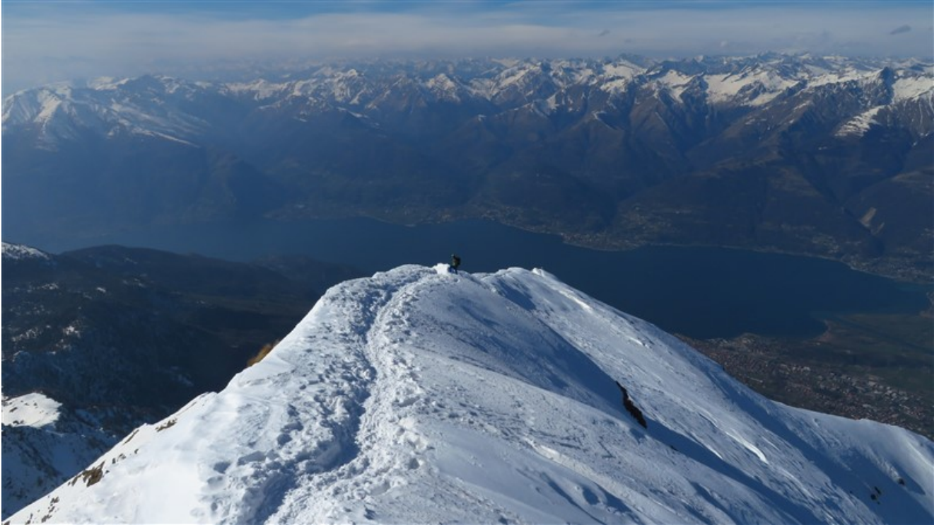
Cresta ovest di discesa