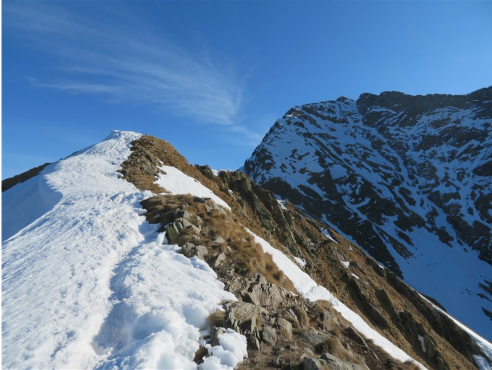
Avvicinamento dalla cresta ovest