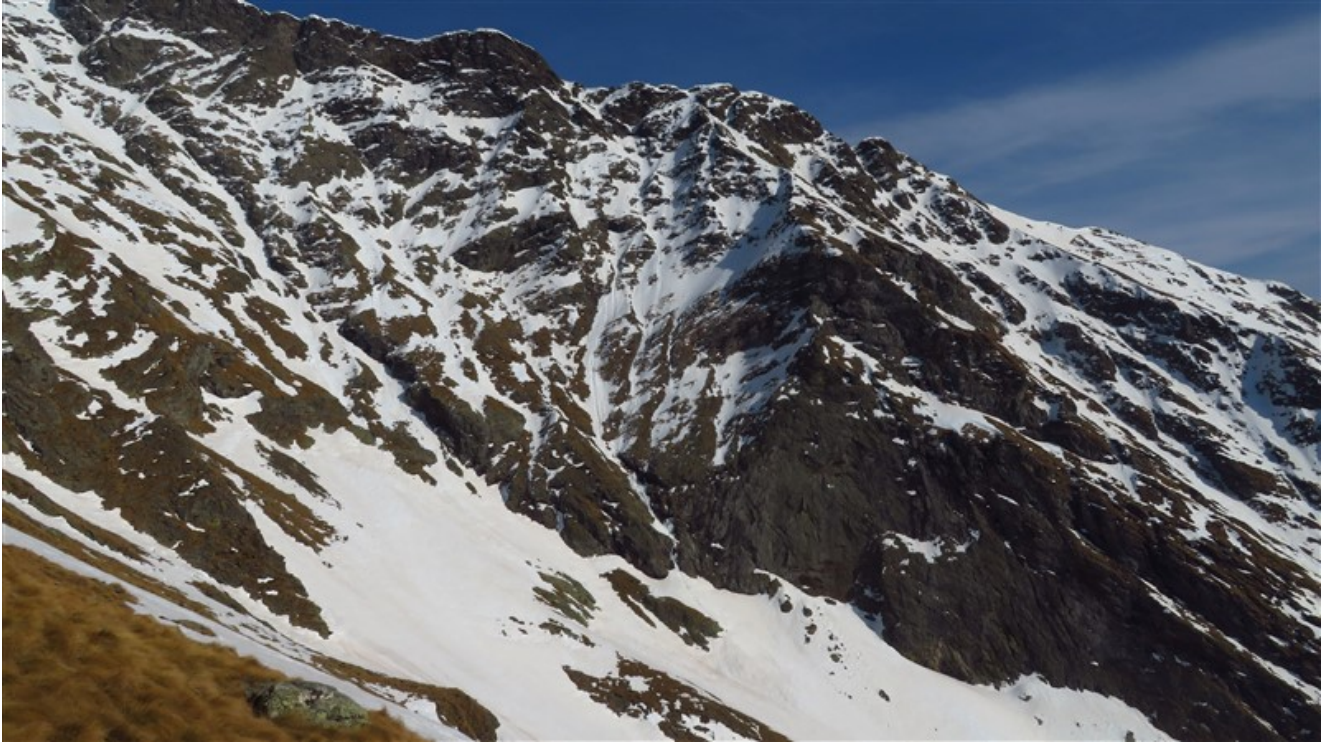
Parete ovest del Legnone