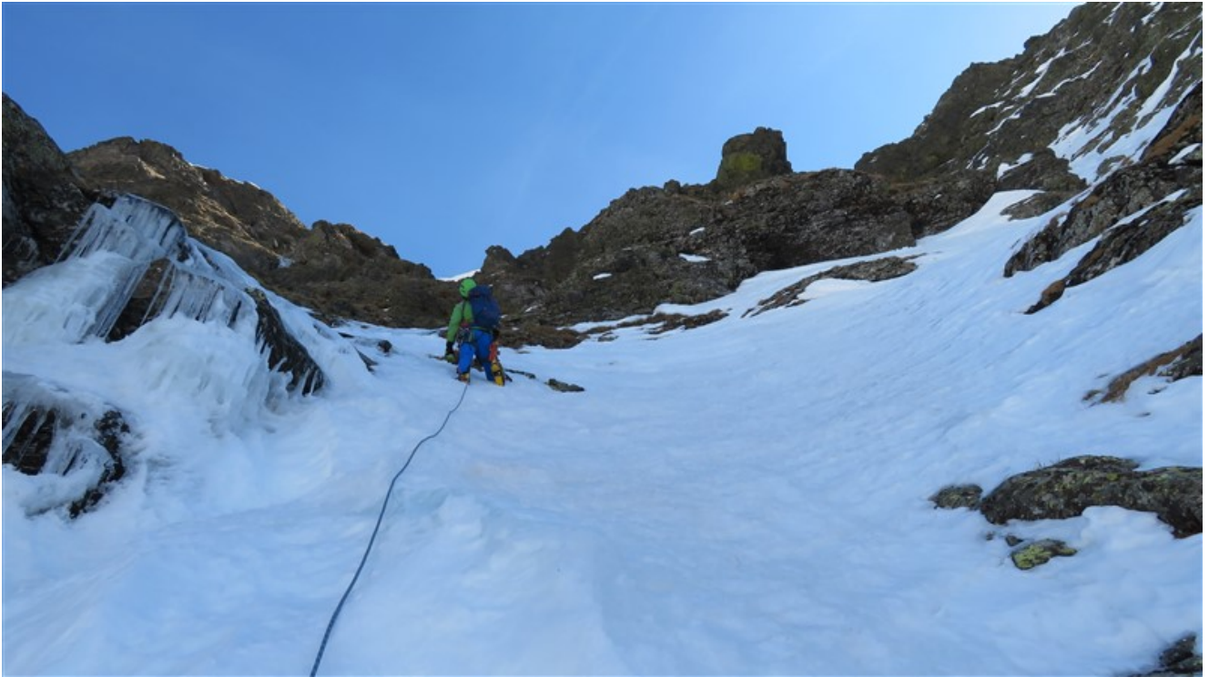
Verso l'anfiteatro superiore