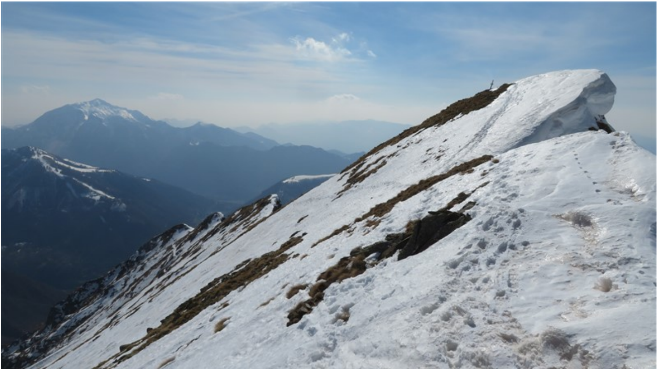
La cresta est che porta in vetta