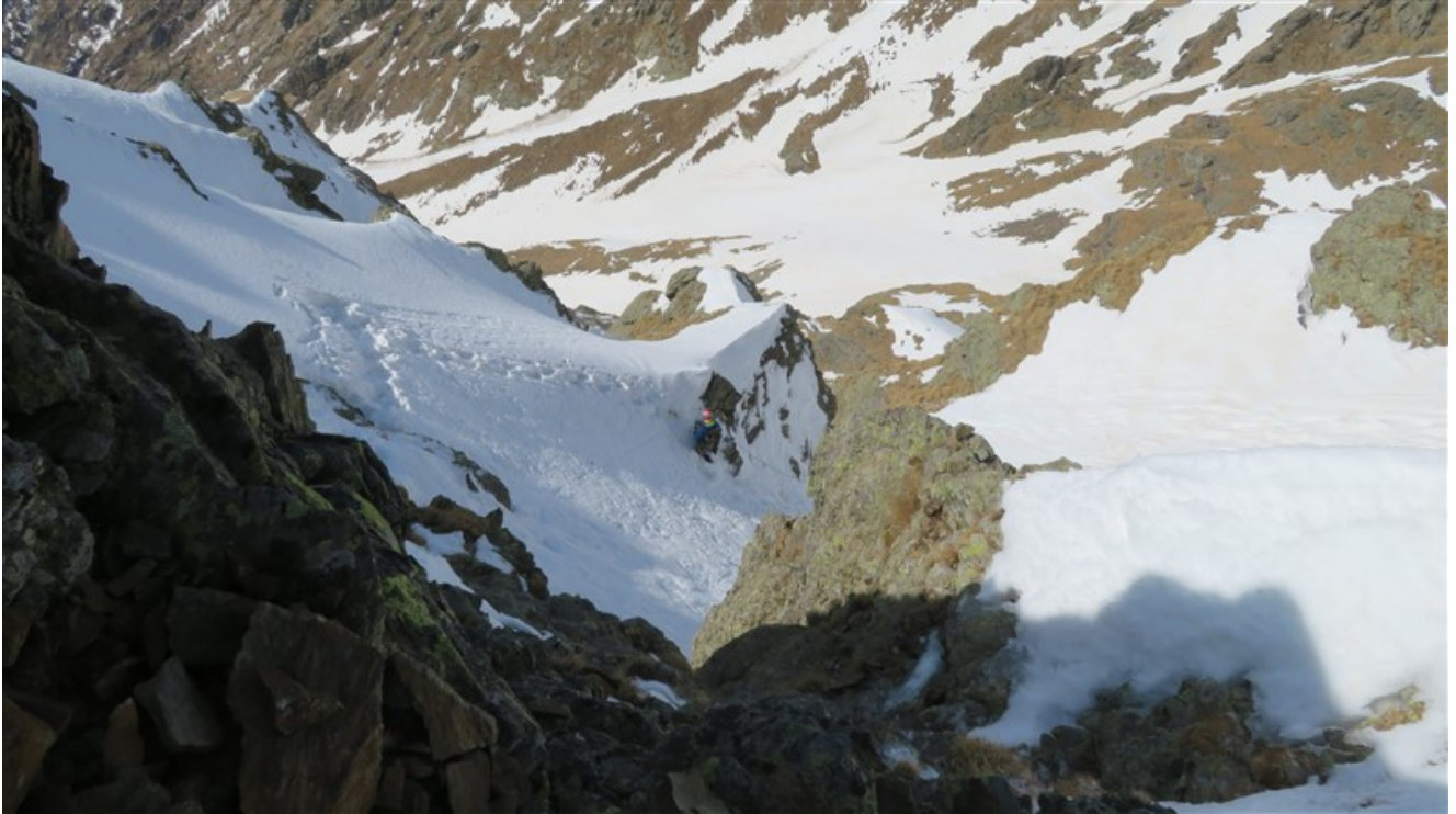
Ultimo tratto visto dalla cresta di uscita