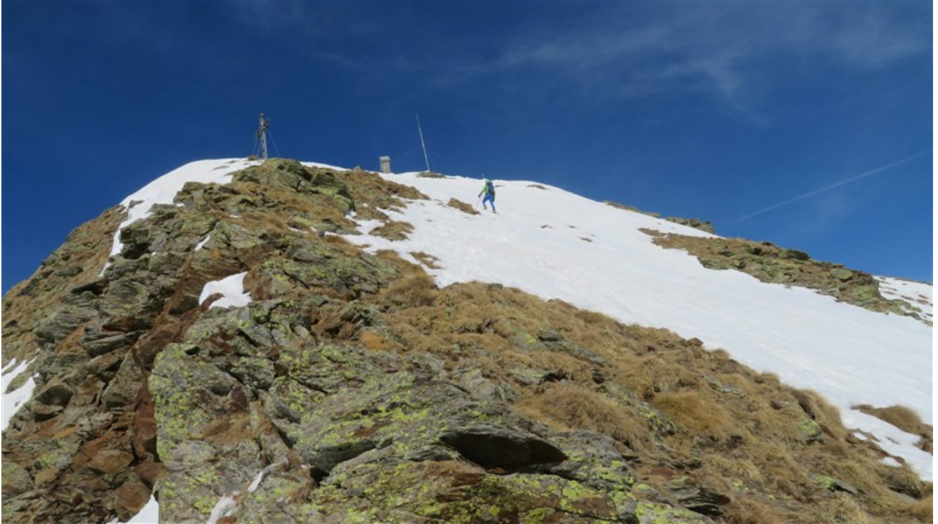
Quasi in vetta